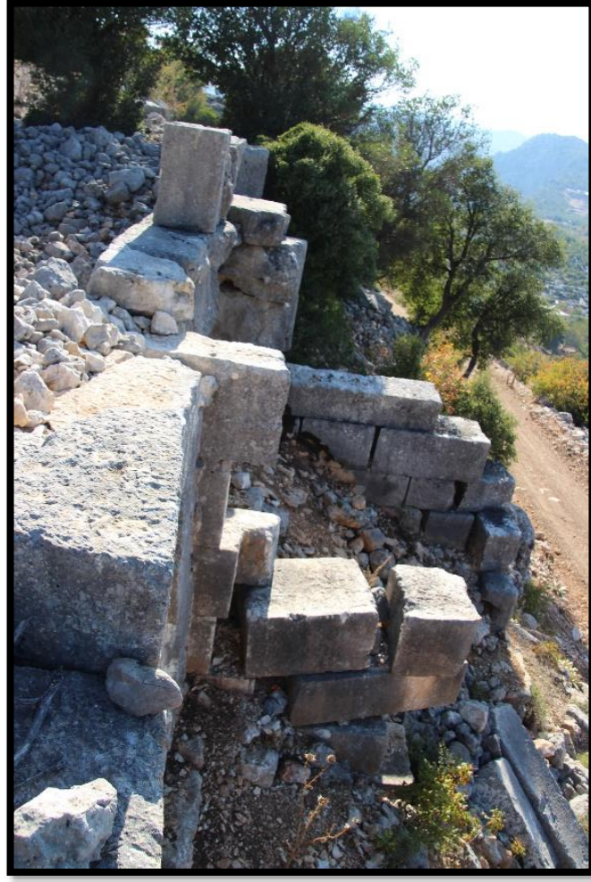
Fig. 5. Yeniuyurt Kale. Tapınak Mezar. Doğu Cephesi.