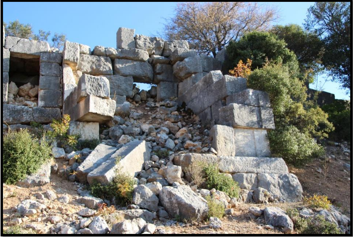
Fig. 2. Yeni yurt Kale. Tapınak Mezar ve Kule İşlevi.