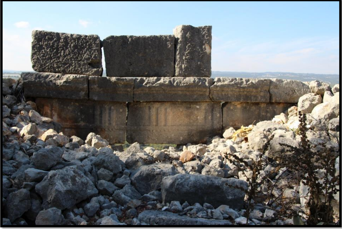
Fig. 3. Yeniyurt Kale. Tapınak Mezar. Ön Cephe.