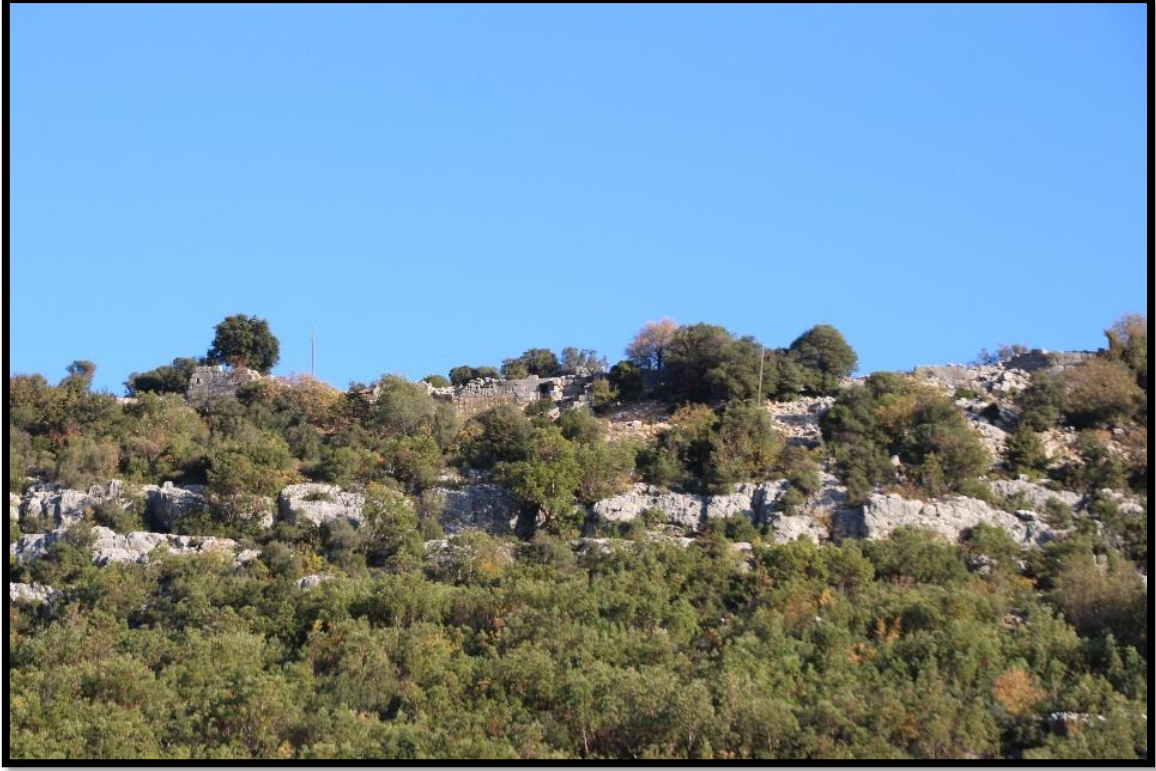
Fig. 1. Yeni yurt Kale. Genel Görünüm ve Tapınak Mezar.