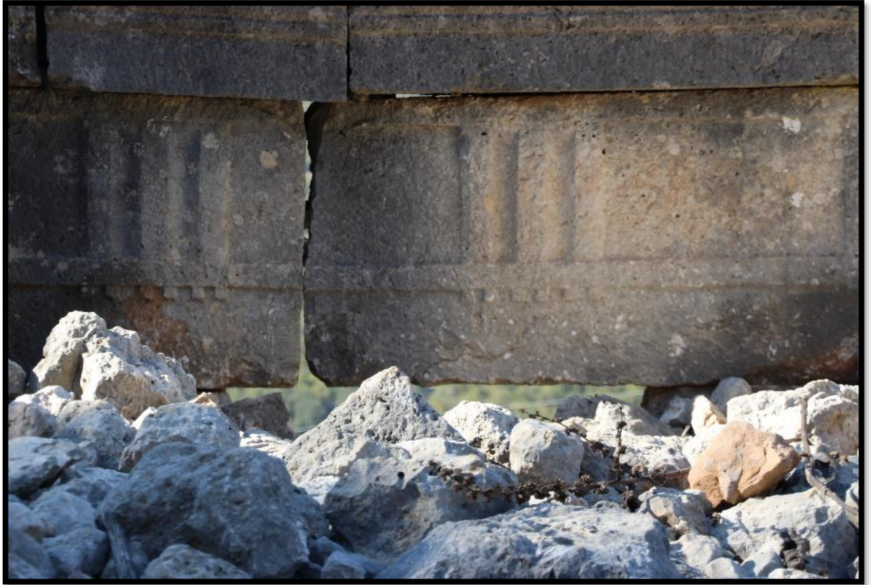
Fig. 8. Yeniyurt Kale. Dorik Mimari Elemanlar.