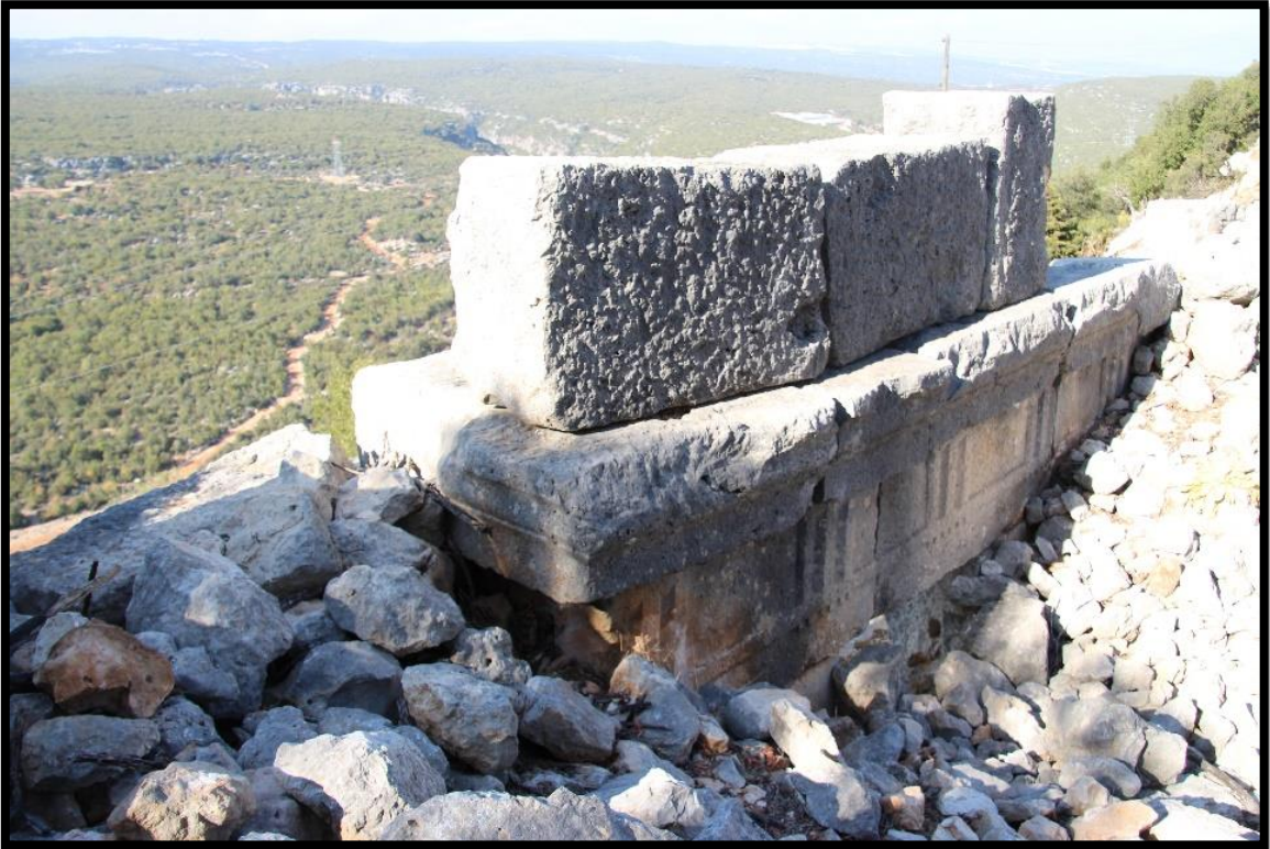
Fig. 4. Yeniyurt Kale. Tapınak Mezar. Ön ve Batı Cephesi.