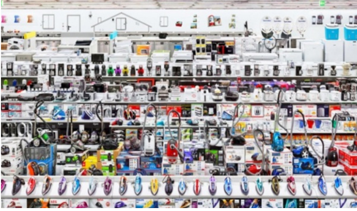
Görsel 7. Andreas Gursky, Media Markt, 2016, fotoğraf/dijital baskı.