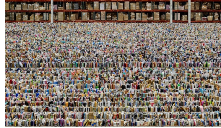
Görsel 6. Andreas Gursky, Amazon, 2016, fotoğraf/dijital baskı.

Sanatçının 2016 yılında gerçekleştirdiği Amazon adlı çalışmada tüm dünyada sanal ticaretin en ünlü şirketlerinden olan amazon mağazasının ürün bandında bir yandan büyük bir karmaşa içinde görünen nesnelere bir yandan da belli bir düzeni de ihtiva eden bir paradoksu beraberinde getiren bir çalışmadır 7 (Görsel 6).