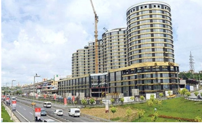
Görsel 10. Caprice Gold devremülk inşaatı, Bayrampaşa, İstanbul

grafik tasarımında reklamcılığın vazgeçilmez unsuru olarak kullanılan ve aynı zamanda pek çok sanatçının da çalışmalarında kullandığı neon malzemenin tüketim boyutuyla birebir örtüşen popüler odağı çalışmanın önemli bir özelliğini oluşturan doğal bir parçasıdır. Çalışmaya uzaktan bakıldığında görünen yazı ve ışık binayı devre dışı bırakarak sadece yazının görünür olmasını sağlamış tüketim kültürünün yanıltıcı ve etkileyici yanı vurgulamak istenmiştir. Ülkemizde de buna benzer bir cezbetme durumunu örnek verecek olursak İstanbul Bayrampaşa'da bulunan Caprice Gold adlı henüz tamamlanmayan devre mülk sisteminin önce dış cephesi tamamlanmış, alıcılar için cazip ve prestijli bir proje olarak lanse edilmiş fakat iç kısmı bitirilmemiştir (Görsel 10).