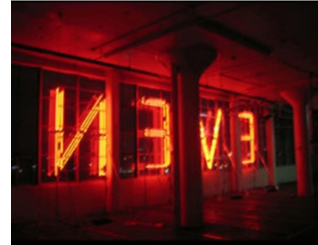
Görsel 9. Mary Ellen Carroll, It is Green Thinks Nature Even in The Dark: Doğayı Karanlıkta Bile Düşünen Yeşildir, (Detay).

1961 Amerika doğumlu bir sanatçı olan Mary Ellen Carroll, doğal çevre ve kaynakların kullanılış biçimi ile bunlara bağlı ekolojik etkilerin tüketimsel noktadaki durumuyla ilgili çalışmalar yapmaktadır. Sanatçı günümüzün popüler ve farklı disiplinlerdeki malzemelerini bir araya getirerek tüketimin olumsuz anlamdaki çevresel etkileri üzerine farkındalık yaratmak üzere projeler gerçekleştirmektedir. Bu kapsamda Precipice Alliance: Uçurum ittifakı adlı kuruluş için yapmış olduğu projede Carroll, iklim değişikliğine dikkat çekmek ve bu kapsamda çalışmanın çevreye zarar vermesini engellemek için çalışmanın ortaya çıkardığı etkisini sera gazı yayılımını onarmak için projenin iyileştirici bir etkisi olduğunu amaçlamıştır. Bu çalışmada sanatçı New Jersey’de kullanılmayan ve 5 binadan oluşan metruk durumdaki fabrikaların belli bir katına sıra halinde çok büyük puntolarla neon bir yazı düzenlemesi yapmıştır. Bu yazıda geçen ifade: "It is Green Thinks Nature Even In The Dark: Doğayı Karanlıkta Bile Düşünen Yeşildir" kelimelerini iki yüzden fazla kelime arasından rastgele seçmiş ve döngüsel bir akışkanlıktaki ifadeden oluşan bir yazıya dönüştürmüştür. Sanatçı bu projeye küresel ısınmanın bilimsel değil ahlaki bir mesele olduğunu savunmuştur (Brown, 2014:227) (Görsel 8 ve 9).