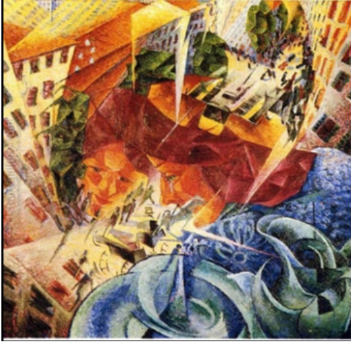
Görsel 1. Umberto Boccioni, Simultaneous Visions: Eşzamanlı Vizyonlar , 1912, Tuval üzerine yağlı boya 60x60 cm.

Bu dönem aslında fütürizm akımı içerisinde ele alınan hız enerji ve devrim mottosunun postmodern dönem içerisinde karşılığının artan dijital altyapının analog hareketleri olarak görebileceğimiz bir farkındalık olarak düşünülebilir (Görsel 1). 2 Çünkü bu yüzyılda teknolojinin ilk süreçteki olumsal tavrına odaklanılmıştır.