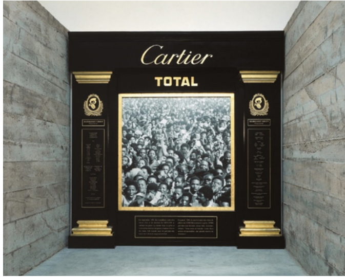
Görsel 4. Hans Haacke, Lest must de Rembrandt: Rembrandt'ın Kızgın Erkekleri , 1986, enstalasyon.