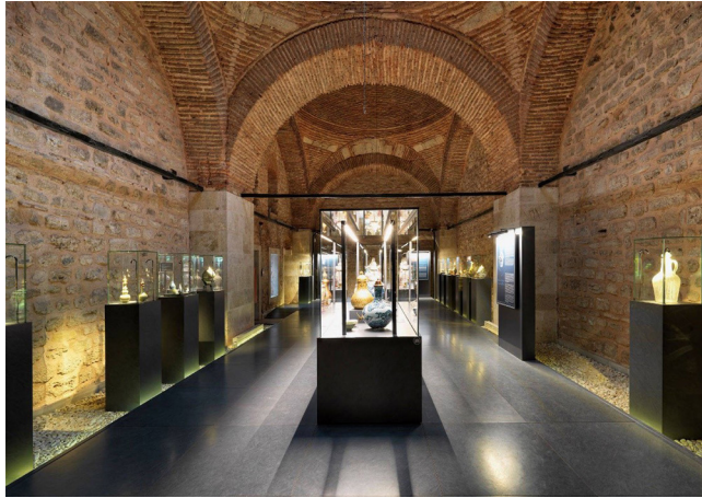
Görsel 1. Topkapı Sarayı Müzesi İç Mekândan Bir Görüntü

Oldukça eski ve köklü bir geçmişe sahip Türkler, özünde pek çok farklı inanış, kültür ve topluluğa ev sahipliği yapmıştır. Türk coğrafyası varlığıyla çeşitli olguları bünyesinde barındırarak ve koruyarak bu kültürel birlikliğin sürekliliğini sağlamıştır. Bu olgular, başta kültür olmak üzere, inanç sistemi, örf, adet, gelenek, din, ritüel, tören ve belge niteliği taşıyan daha bir çok kavramdan oluşur. Türk coğrafyası, Osmanlı döneminde her anlamda zenginleşmiştir. Bu zenginleşme sanatsal bağlamda da ilerlemeye, etkileşime ve çeşitliliğe sebep olmuştur. Kendi kültürel repertuarını oluşturmada oldukça başarılı olan Türkler, Osmanlı döneminde de var olan bu repertuarları zenginleştirerek değerlendirmiş, sınıflandırmış ve çeşitli meslek dallarına bölmüştür. Bu sınıflandırma ile birlikte her bir sanat ve zanaat alanının koleksiyonları da oluşturulmuştur. Bu koleksiyonlar günümüzde bize Osmanlı tarihi ve sanatı bağlamında rehberlik yapmaktadır. Özellikle Topkapı Sarayı Müzesi'nde Osmanlı devleti ile ilgili her türlü belge, sanatsal ve kültürel ve hatta mimari değerler görülebilmektedir (Görsel 1).