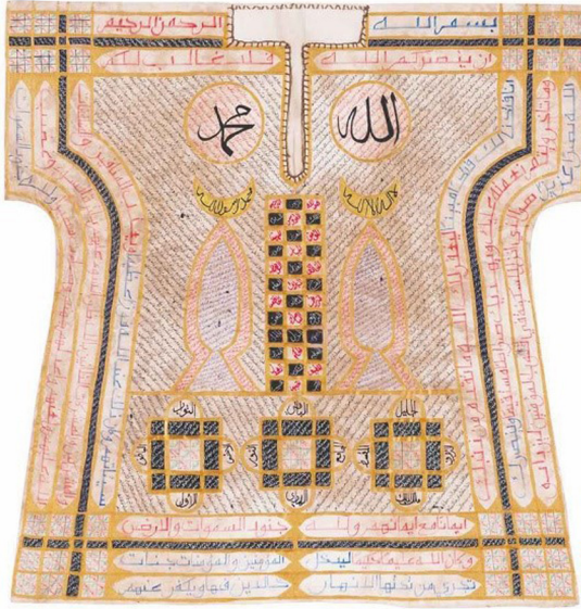
Görsel 2. Tılsımlı Gömlek Örneği

Tılsımlı gömlek, genel manada geçmişte Osmanlı padişahlarının ve zaman zaman da Osmanlı Saray erkanının savaşa giderken, önemli olaylarda, törenlerde ve ava giderken kıyafetlerinin içine korunmak amaçlı giyindikleri astara benzeyen içlik tarzı kıyafetlerdir (Görsel 2).