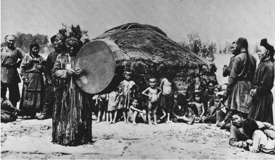
Görsel 5. Ayin Yapan Kam/Şaman ve Onu İzleyen Topluluk