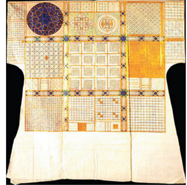
Görsel 3. Cem Sultan'ın Tılsımlı Gömleği

Burada tılsımlı gömleklerin Osmanlı'da kullanımı ve kamsal boyutta kullanımı açısından bağlantı kurulabilecek noktalardan ilki gömleğin kam kıyafetine biçimsel olarak benziyor olmasıdır. En önemli ikinci nokta ise, gömleğin üzerinde içeriklerindeki güçlerin gömleğe ve sahibine yansımalarının amaçlandığı sure, sözcük, çizim, şekil, sayı ve Allah'ın esmalarının yer almasıdır. Bu özellik kamlarda benzer özelliktedir fakat farklı bezemelerde ve süslemededir. Kamlar kıyafetlerinin üzerine her şeyden önce kötü ruhları