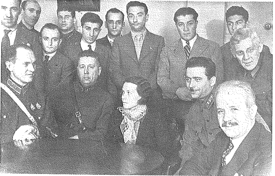
Atatürk'ün mânevî kızı, ilk kadın pilotumuz Sabiha Gökçen yedi erkek öğrenci ile yüksek planörlük kursları görmek üzere Moskovada bulunduğu sırada (1935) Büyükelçi Zekâi Apaydın, diğer öğrenciler ve Sovyet ilgililerle birlikte çekilmiş bir hatıra fotoğrafında.