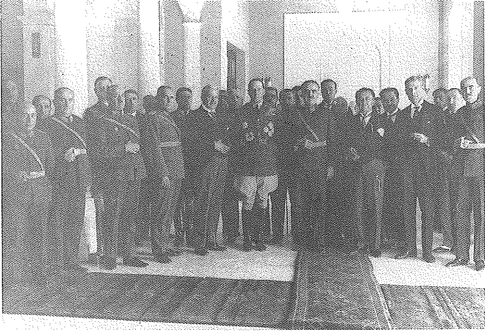
General Mac Arthur'un 26 Eylül 1932 günü Ankara'da, Genelkurmay Başkanı Fevzi Çakmak'ı ziyareti esnasında çekilen bir fotoğraf (Mac Arthur'un solunda Millî Savunma Bakanı Zekâi Apaydın, sağında Mareşal Fevzi Çakmak görülmüyor)