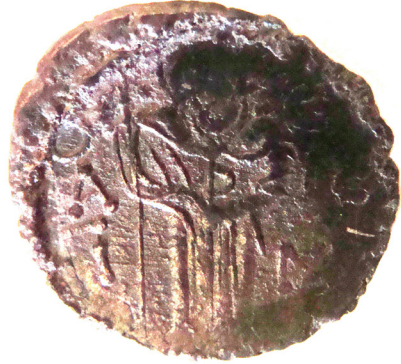
Lev. 1 (ön)