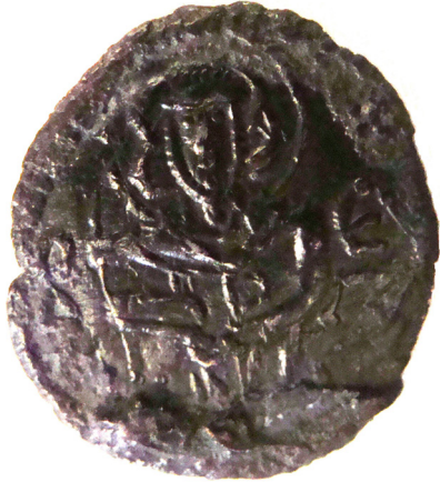
Lev. 2 (ön)