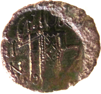
Lev. 1 (arka)