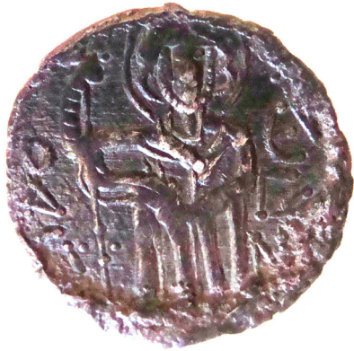
Lev. 3 (ön)