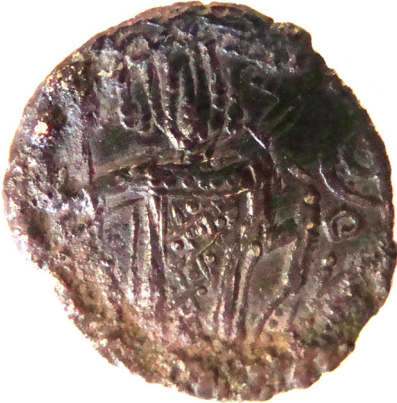
Lev. 2 (arka)