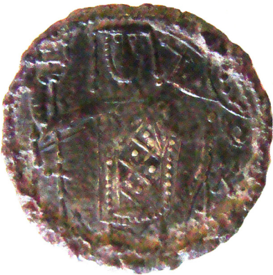
Lev. 3 (arka)