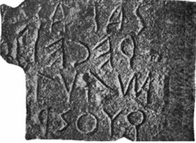
Lev. 1: Lapis Niger. iasias, recei l, ...evam, quos r... ( http://www.codex99.com/typography/images/ancient/niger_1_lg.gif ).