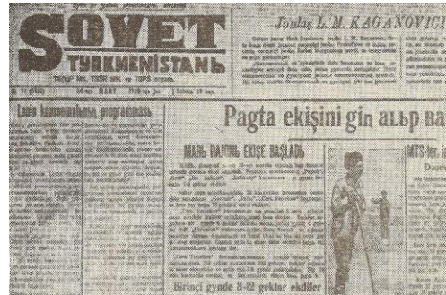
Ek-4: “Sovet Türkmenistanı” gazetesini. (Kırlı alfabesinde)