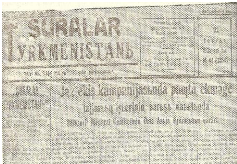
Ek-2: “Şuralar Türkmenistanı” gazetesini. (Latin alfabesinde)