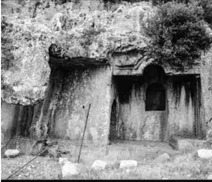
Çok Odalı Kaya Mezarı Olba - (Akçay 2006)