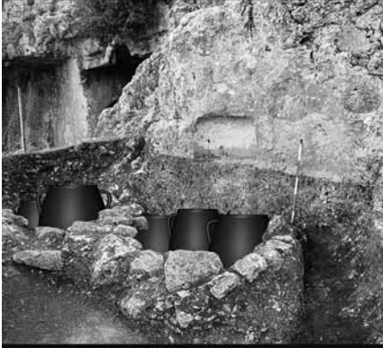
Pithos Mezar Olba - (Akçay 2016)