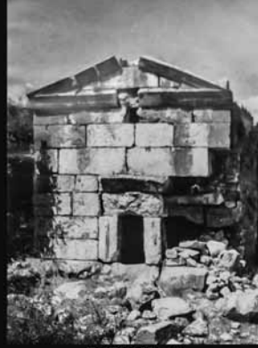
Ev Tipi Mezar