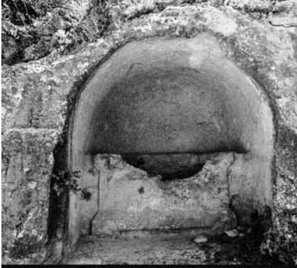
Arcosolium Diocaesarea - (Akçay 2006)