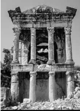
Tapınak Planlı Mezar