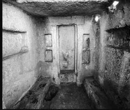
Columbarium Olba - (Akçay 2016)