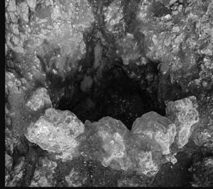
Urne Mezar Olba - (Akçay 2016)