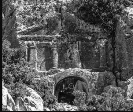
Tapınak Cepheli Kaya Mezarı Olba - (Akçay 2016)