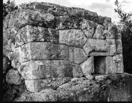
Çokgen Taş Duvarlı Mezar