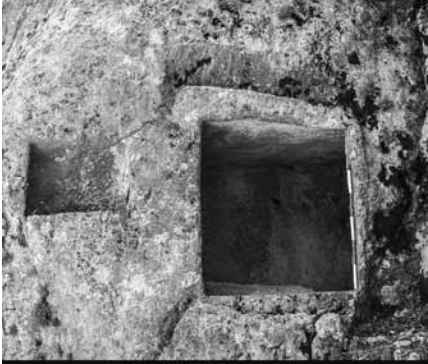
Tek Odalı Kaya Mezarı Olba - (Akçay 2006)