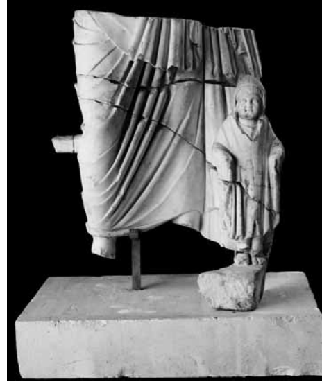
Levha 10: Perge Asklepiosu (Antalya Müzesi 2014-193).