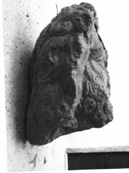
Levha 6: Kireç Taşından Erkek Başı.