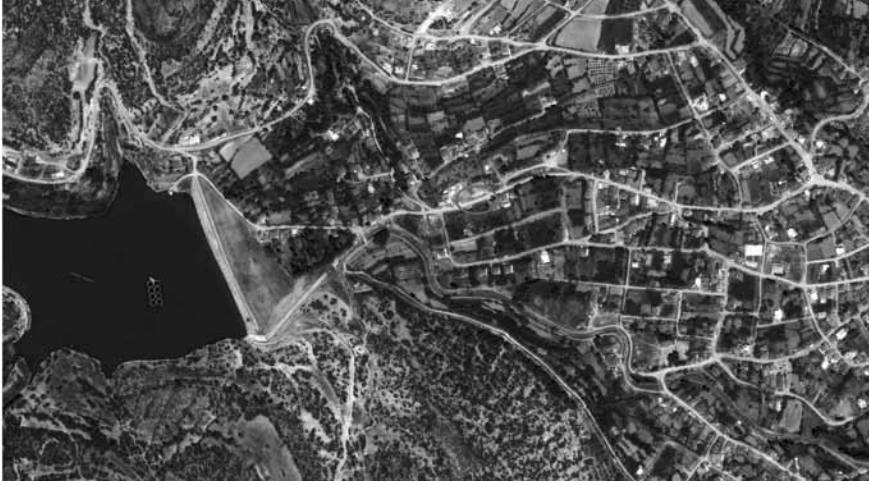
Levha 1: Antalya-Korkuteli Yelten Yerleşkesi.