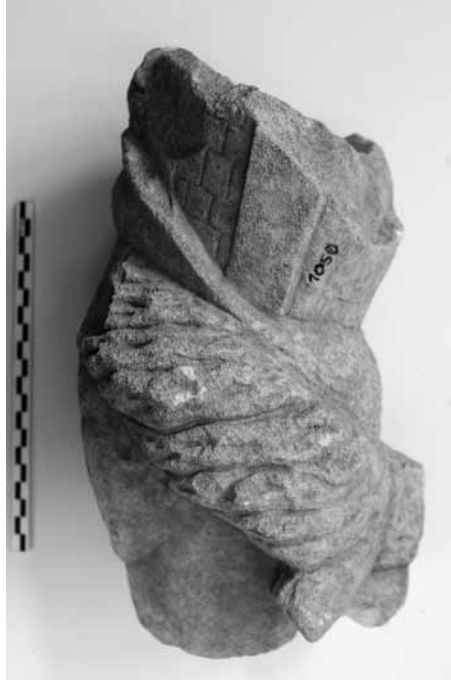
Levha 5: Mermer Thyke Başı.