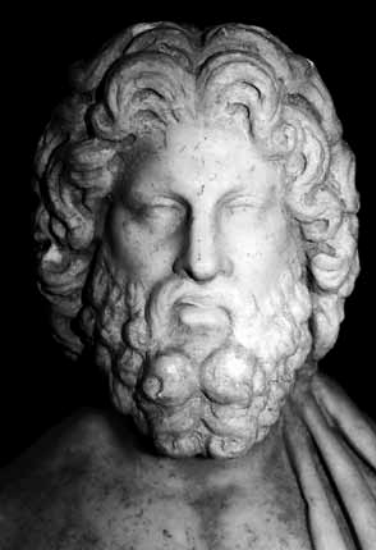
Levha 9: Asklepios Başı.