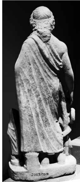
Levha 8: Arkadan Görünüşü