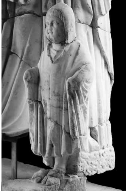
Levha 11: Perge Asklepiosu ve Telesphoros Heykeli (Antalya Müzesi 2014-193).