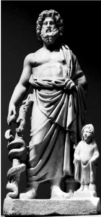
Levha 7: Asklepios Grubunun Önden Görünüşü.