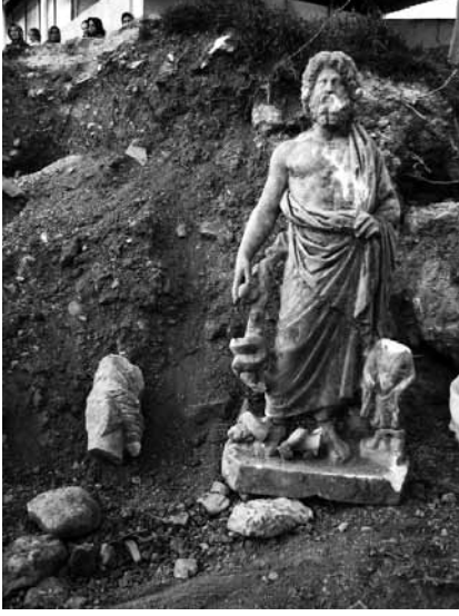
Levha 3: Asklepios Grubu, Thyke ve Erkek Başı'nın Alanda Çekilen Görüntüleri.