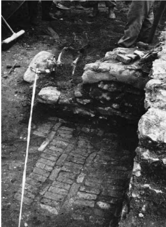
Levha 2: Yelten'de Heykellerin Bulunduğu Doğu Mekanının Taban Döşemesi ve Duvarları.