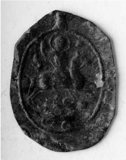
Lev. 9- Olba kazısından bronz madalyon tlsim (n yz- Kutsal Binici tasviri).