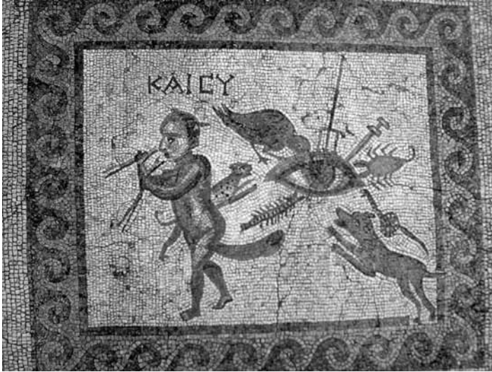
Lev. 3- Kemgöz mozaïği, Hatay Müzesi.