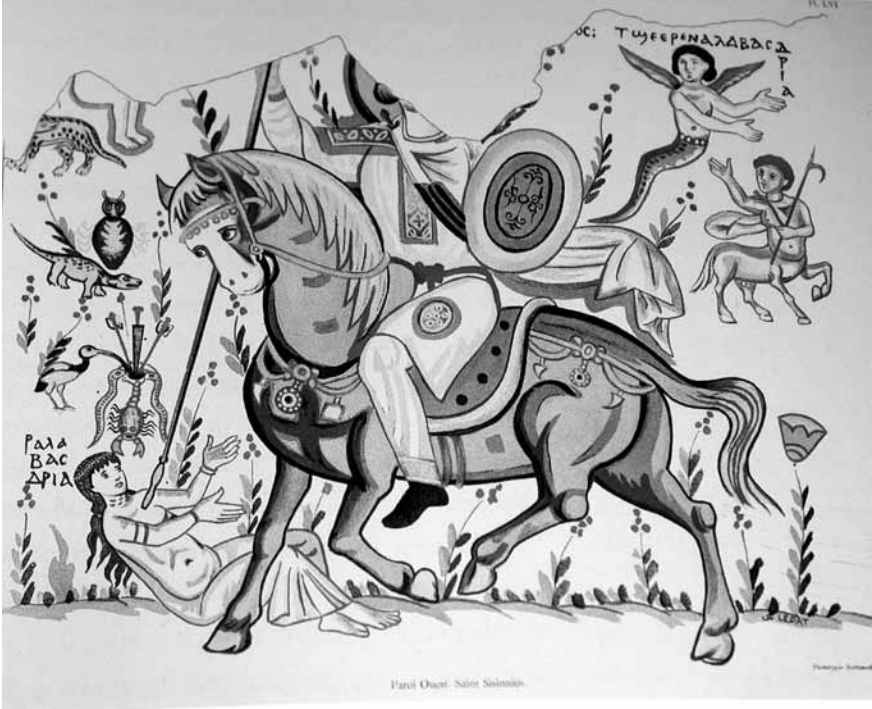
Lev. 8-Aziz Sisinnios'un Bawit'te bulunan duvar resmi.