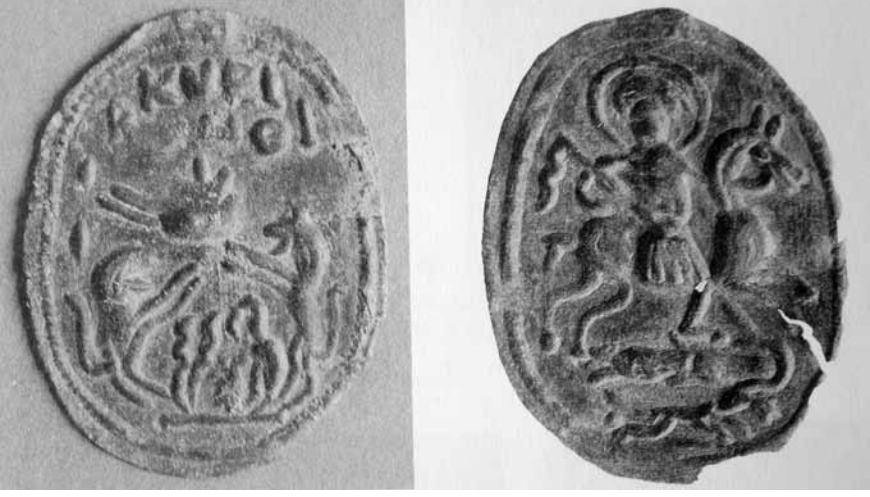
Lev. 4- Anemurium'dan Kutsal binici ve kemgz betimli tlsim kolye sarkacı (Russell 1995, 41, fig.5-6).