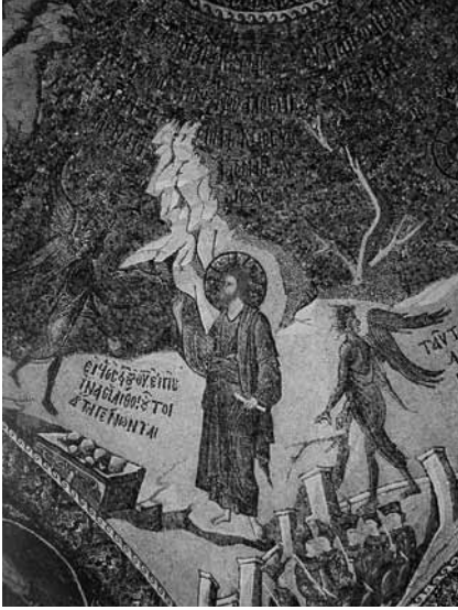
Lev. 1- İsa'nın şeytan tarafından baştan çıkarılmaya çalışılması, Kariye Müzesi (Khora Manastır Kilisesi) iç narteks tonozundaki mozaikten ayrıntı, 14. yy ilk çeyreği.