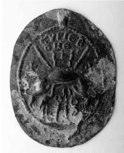
Lev. 10- Olba kazısından bronz madalyon tlsim (arka yz- Kemgz /Acı Cken Gz).