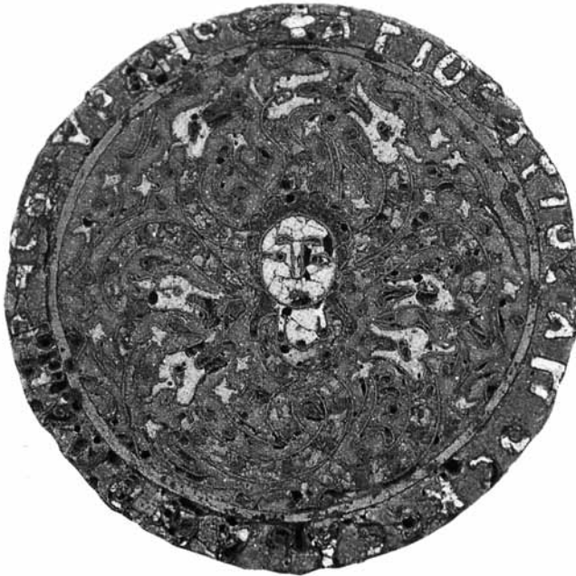
Lev. 7- Emaye bezemeli Medusalı madalyon tılsım (Evans-Wixom 1997, 166, no.114).