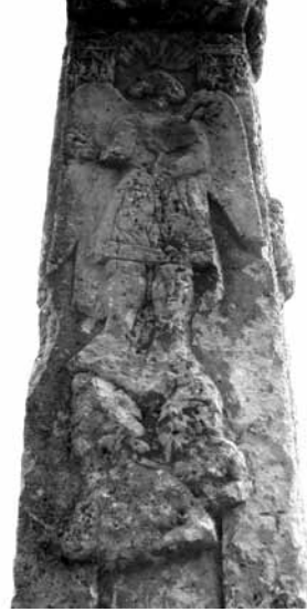
Lev. 2- Şeytanın Baş Melek Mikail tarafından ezilmesi, Mut Alahan Manastırı, Kuzey Kilisesi batı kapısından kabartma ayrıntı, 5. yy.