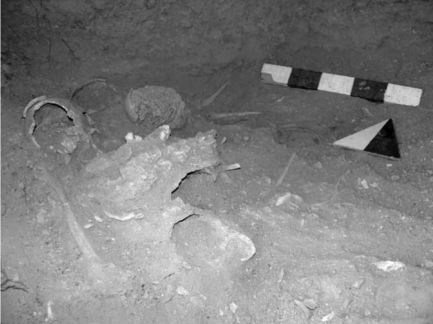
Levha 6. 6 no.lu kaya mezarının 1 no.lu lü yatađındaki iskeletler.