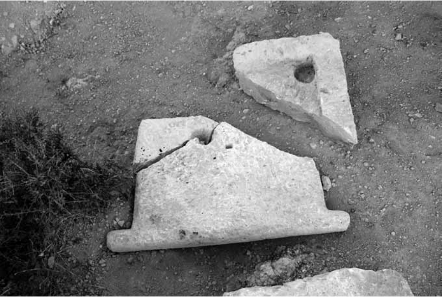
Levha 4. 6 no.lu kaya mezarının giriş kapısı.