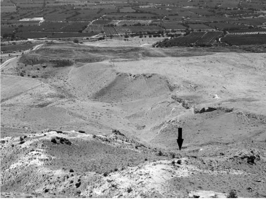
Levha 1. Tripolis Doğu Nekropolisi genel görünümü ve 6 no.lu kaya mezarın yeri.