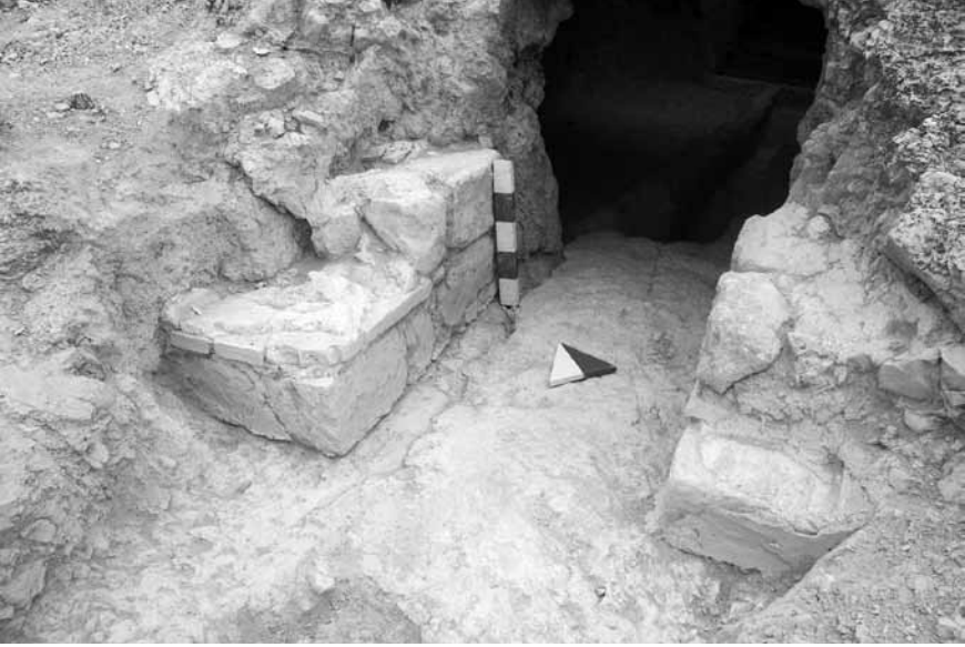
Levha 3. 6 no.lu kaya mezarının giriři.