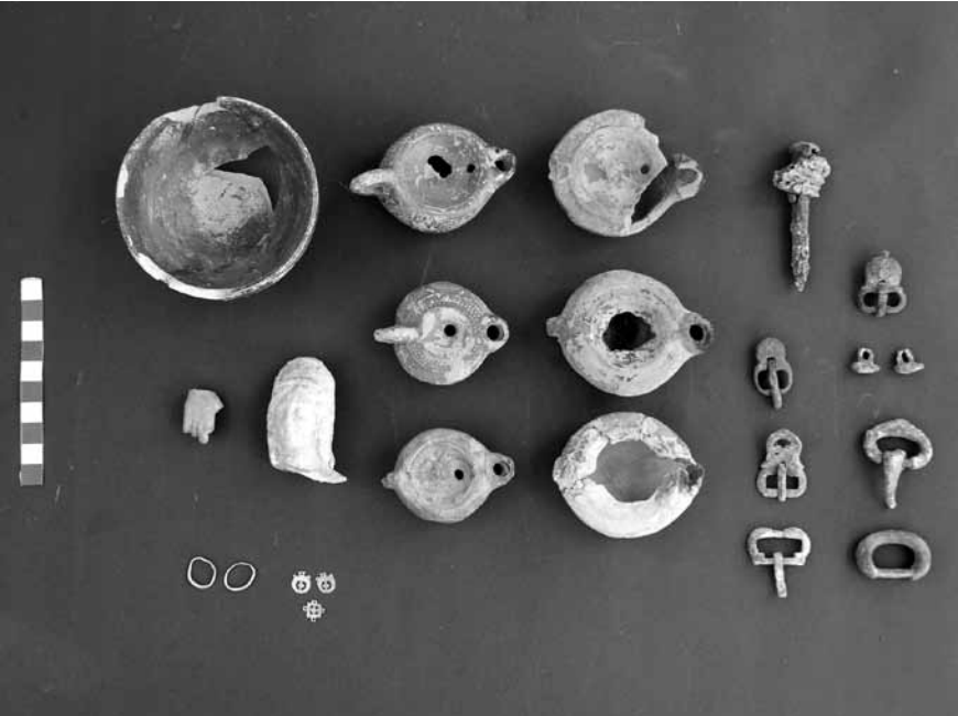
Levha 8. 6 no.lu kaya mezarından çıkan buluntular.