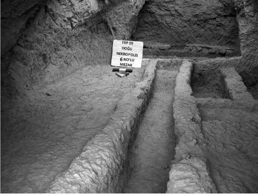
Levha 5. 6 no.lu kaya mezarının ii.