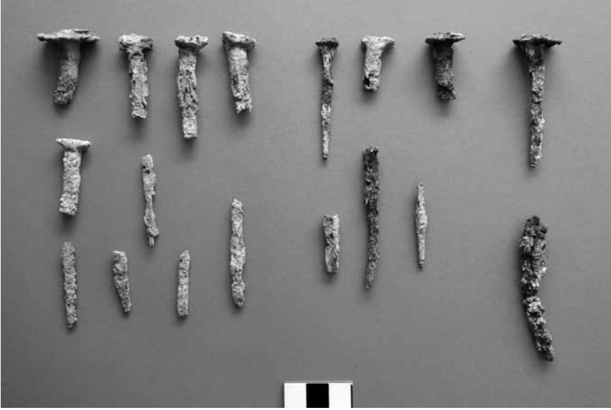
Levha 9. 6 no.lu kaya mezarından çıkan demir çiviler.