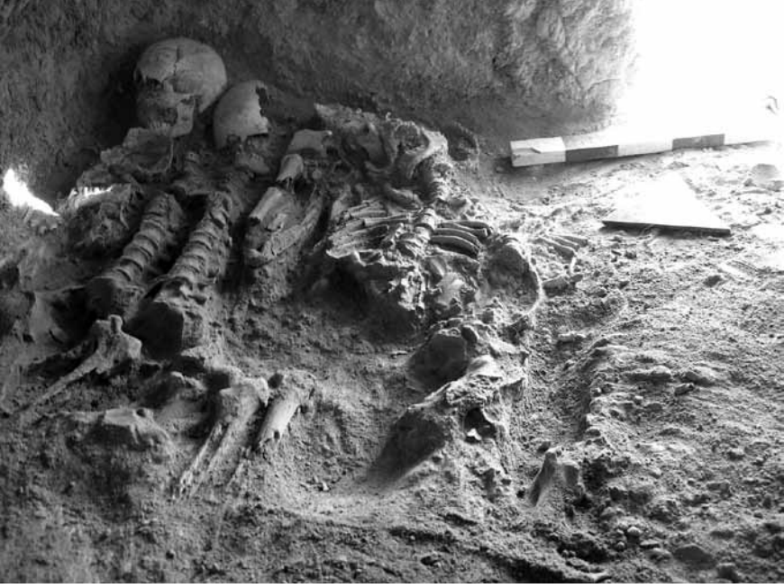
Levha 7. 6 no.lu kaya mezarının 2 no.lu ölü yatağındaki iskeletler.