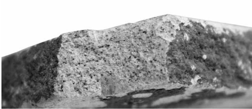
Lev. 4. Sepet kulplu amphoranın kesit detayı.