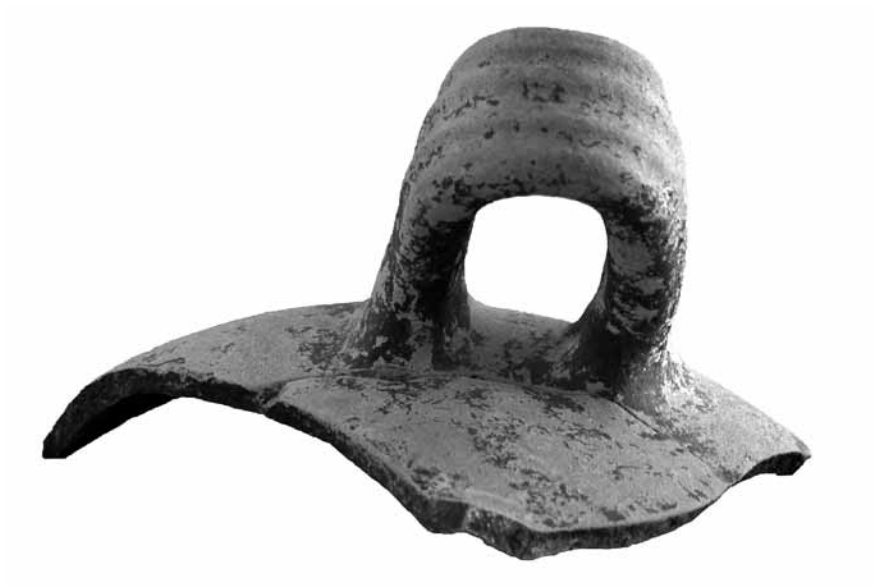
Lev. 3. Sepet kulplu amphoranın kulp detayı.