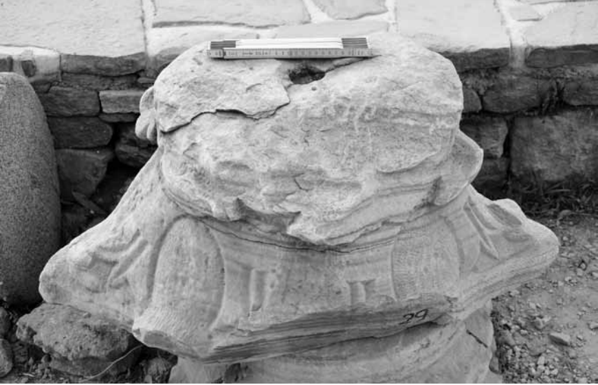
Levha 2. Tahrip olmuş sütun başlığı.