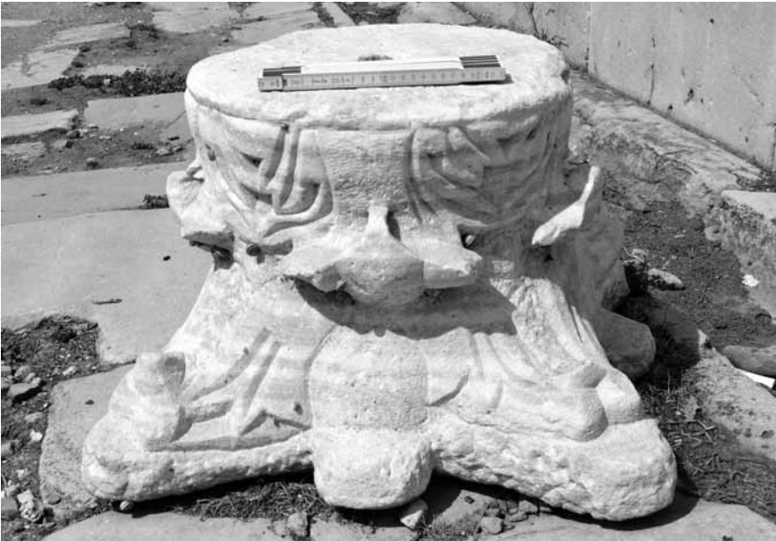
Levha 4. Yarı işlenmiş sütun başlığı.