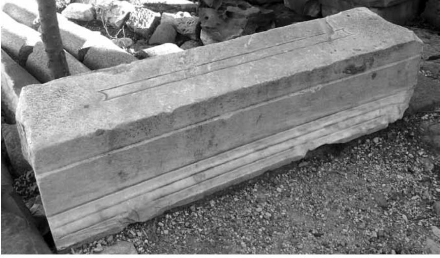
Levha 9. C caddesinin batı bölümünden bir arşitrav bloğu.