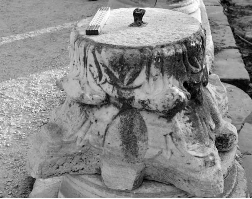
Levha 3. Yarı işlenmiş sütun başlığı.