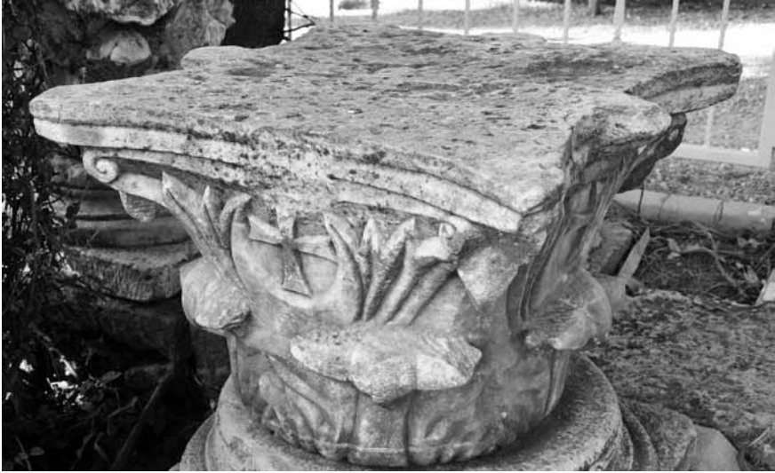
Levha 6. İşçiliği tamamlanmış sütun başlığı.