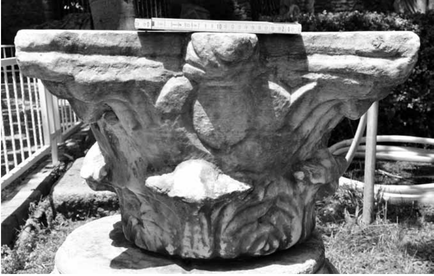
Levha 5. İşçiliği büyük oranda tamamlanmış sütun başlığı.