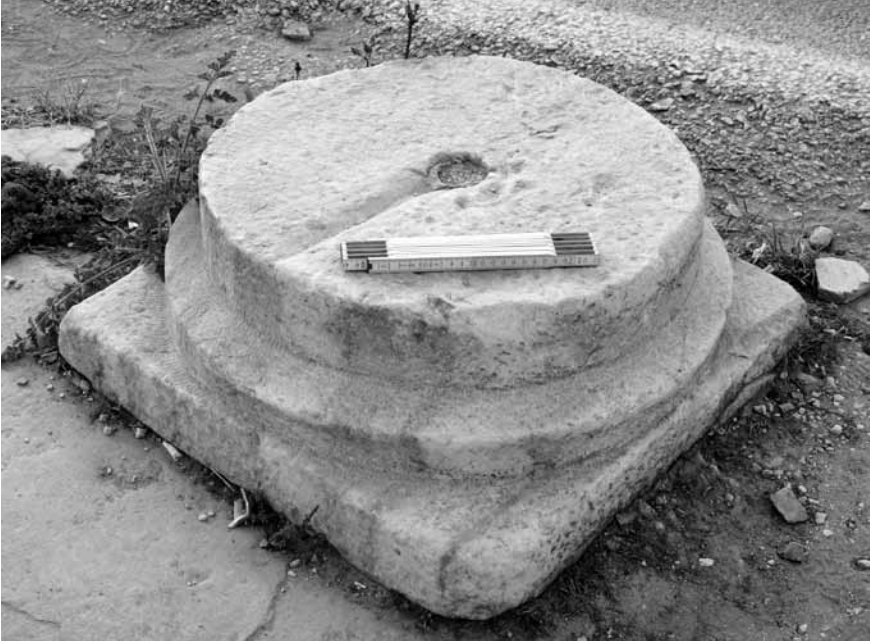
Levha 7. Yarı işlenmiş sütun kaidesi.