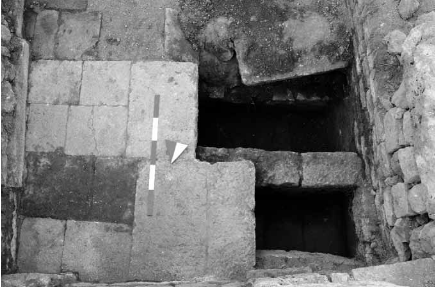
Levha 7-7a: Nartheks.