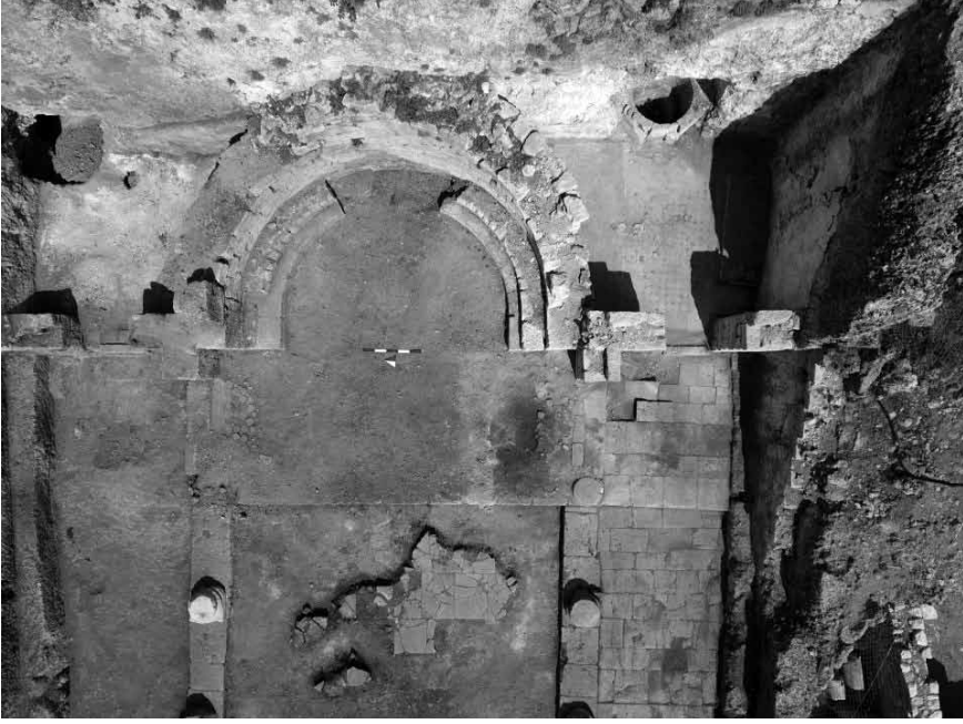
Levha 5: Kuzey Yan Oda (Prothesis).