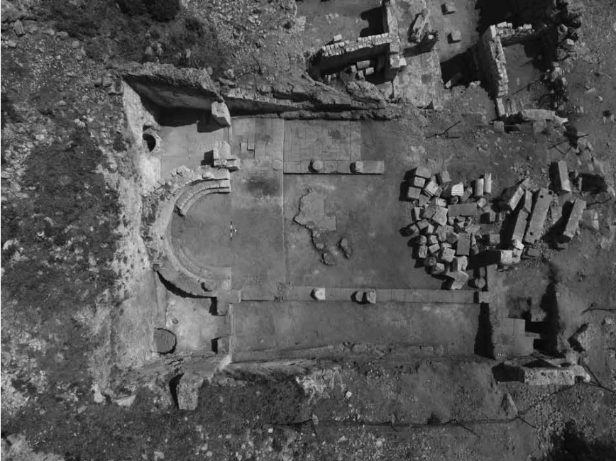
Levha 6: Ana Nef ve Yan Nefler.