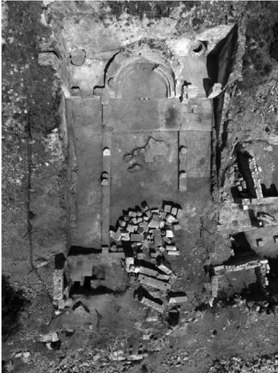
Levha 2: Kuzey Kilisesi Genel Görünüş.