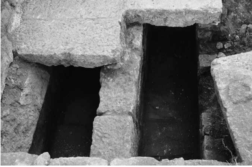
Levha 8: Nartheks Mezarları.