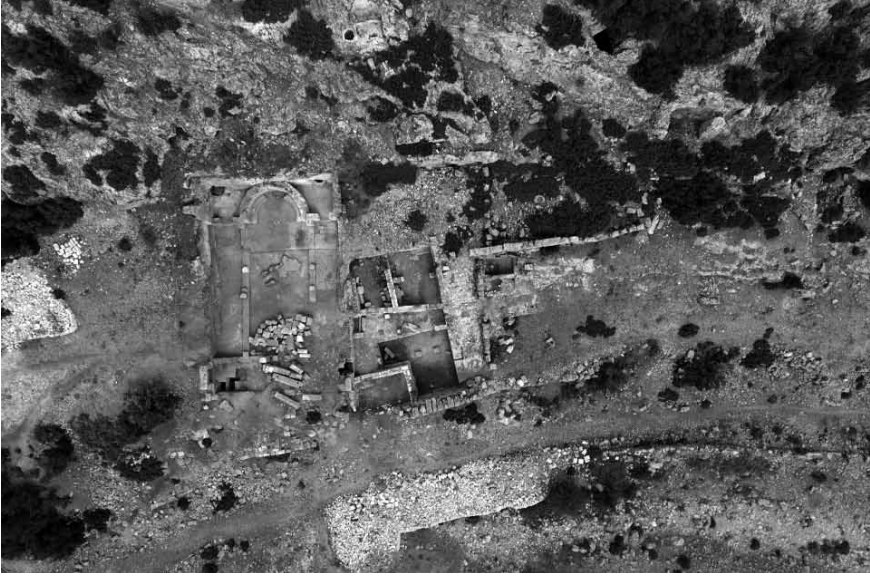
Levha 1: Olba Manastırı Genel Görünüş.