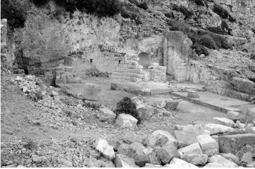
Levha 3: Apsis.