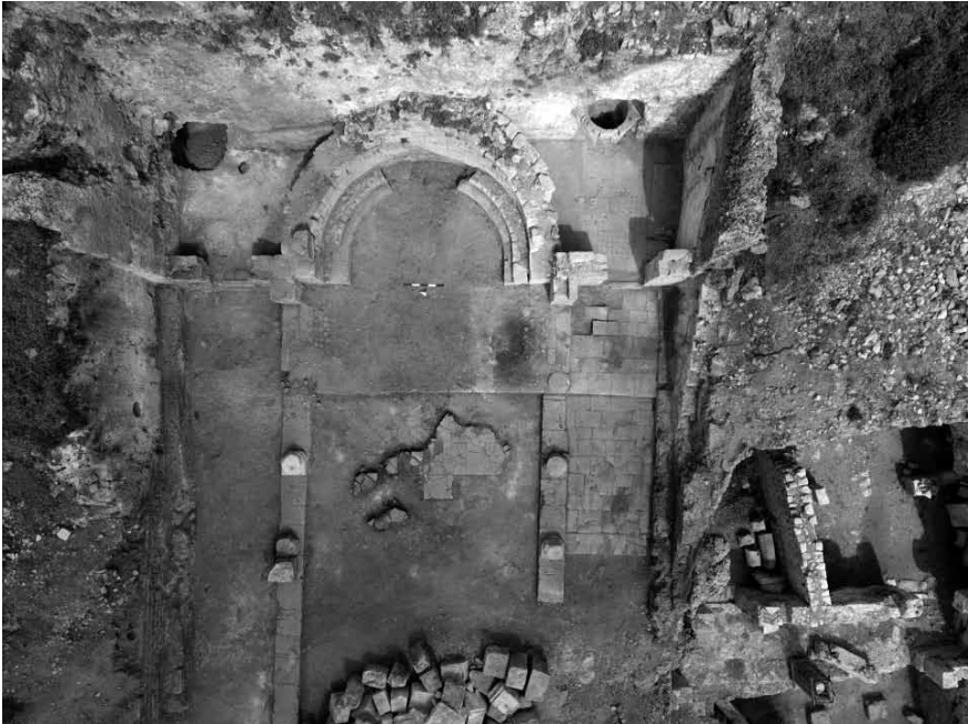
Levha 4: Synthronon.