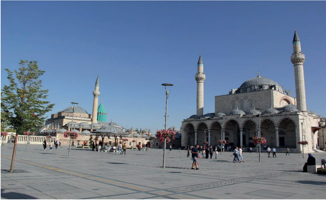
Fotoğraf 3: Konya Sultan Selim İmareti'nin yerine yapılan parkın günümüzdeki görünümü.