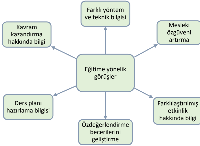
Şekil 2. Öğretmen adaylarının eğitimlere yönelik görüşlerinin mesleki açıdan incelenmesine yönelik kodlamalar