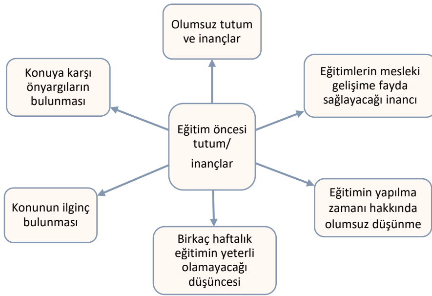
Şekil 1. Öğretmen adaylarının eğitim öncesi tutum ve inançlarına ilişkin görüşleri

Öğretmen adaylarına ilk soru olarak “Eğitim öncesinde yapılacak eğitime yönelik herhangi bir önyargınız var mıydı?” sorusu yöneltilmiştir. Öğretmen adaylarının eğitim öncesinde yapılacak eğitime yönelik tutum ve inançlarına yönelik kodlamalar Şekil 1’de verilmiştir.