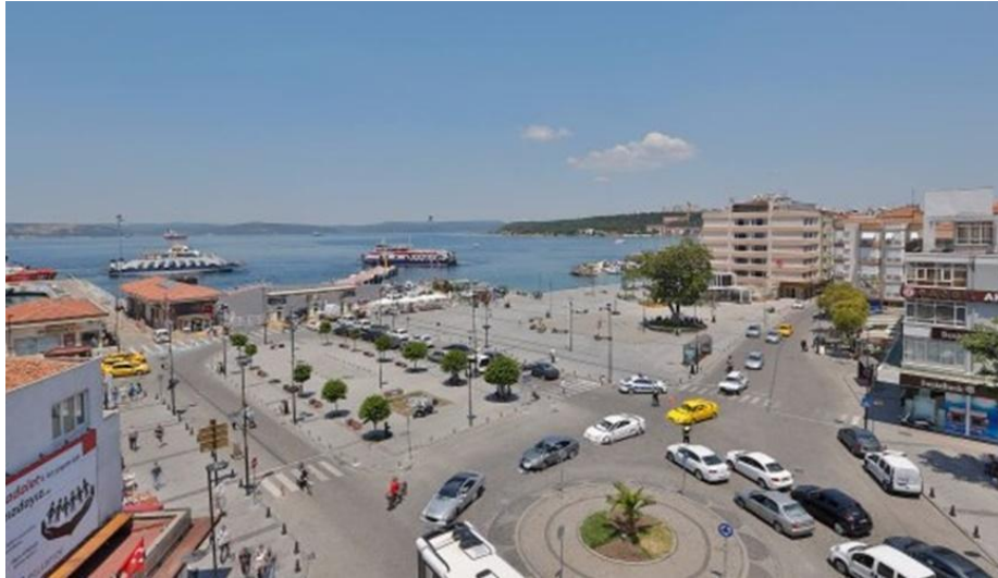
Şekil 2. Çanakkale İskele Meydanı (Kelem Gazetesi, 2020)

Günümüzde deniz, kara ve yaya ulaşımının bir arada olduğu İskele Meydanı, zaman içinde çeşitli düzenlemeler ile bugünkü halini almıştır (Şekil 2). Bu alan özellikle bahar ve yaz aylarında deniz ulaşımı ile kente gelen yerli ve yabancı turistlerin kent ile tanıştıkları alan olması sebebiyle büyük önem taşımaktadır. Aynı zamanda Eski Kordon aksı ile Demircioğlu Caddesi’nin kesişim noktasında yer alan ve kent halkının günlük yaşamında işlek olarak kullandığı bir alandır. Bu sebeplerle kent kimliğinin yansıtılabileceği önemli bir odak noktasıdır (Sağlık ve ark., 2016) Bunun yanı sıra, kent kimliğinin belirlenmesinde kent halkının kente yüklediği anlamlar ön planda olmaktadır. Bu amaçla Sağlık (2019) tarafından yapılan çalışmada, Çanakkale halkının kente yüklediği kimlik tipi tanımlamasında öncelikli olarak tarihi kent, sonrasında ise turizm kenti ve boğaz kenti ifadelerinin yer aldığı belirlenmiştir. Kültürel kimlik olarak en çok tarih kavramının öne çıktığı tespit edilirken, yerleşim alanları arasında ise en çok İskele Meydanı’nın kenti simgelediği ve önemli bir odak noktası olarak düşünüldüğü görülmüştür (Sağlık, 2019).