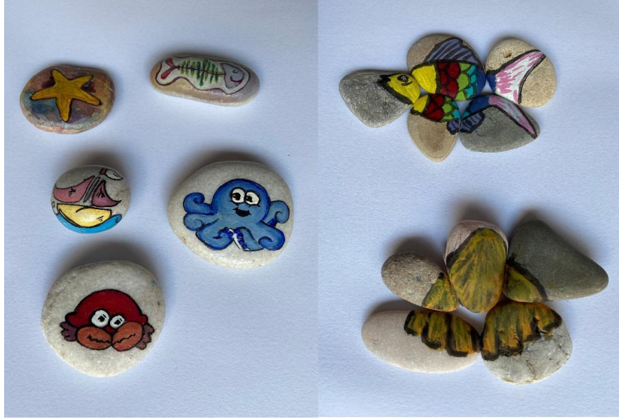
Şekil 6. 1 Numaralı Alanda Uygulanması Planlanan Tekli veya Çoklu Taş Boyama Örnekleri (Taş Boyama: Neşe Baytan ve Yasemin Yıldızgedik)

En az 100 cm 2 yüzeye sahip olan büyük taşlar tek bir simge ile boyanırken, 20-25 cm 2 yüzeye sahip küçük boyutlarda olan taşların ise 4-5 adedi bir araya getirilerek tek bir simge ile boyanması uygun görülmüştür (Şekil 6). Bu şekilde boyanan taşların 4-5 metre uzaklığa kadar algılanabilir olması planlanmıştır. Taşların boyanması tamamlandıktan sonra ise tüm taşlara koruma amaçlı vernik işlemi uygulanması ve bakımı için ortalama 2 yılda bir tekrarlanması planlanmıştır.