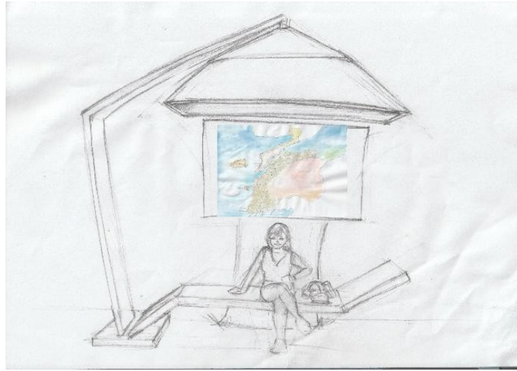
Şekil 3. Kent Mobilyası ve İşaret Ögesi Tasarımı (Tasarım ve Çizim: Neşe Baytan)

Çalışmada tasarlanan işaret ögesi, sabitleneceği kent mobilyasıyla birlikte bütünsel olarak geliştirilmiştir (Şekil 3). Geliştirilen kent mobilyası üç parçadan oluşmaktadır. Bunlar, gündüzleri güneşten koruma ve geceleri yukarıdan aydınlatma işlevini sağlayan plaj şemsiyesi, oturma elemanı görevi gören şezlong ve hemen arkasında bitişik olarak konumlanan işaret ögesinin yer aldığı pano kısmıdır.