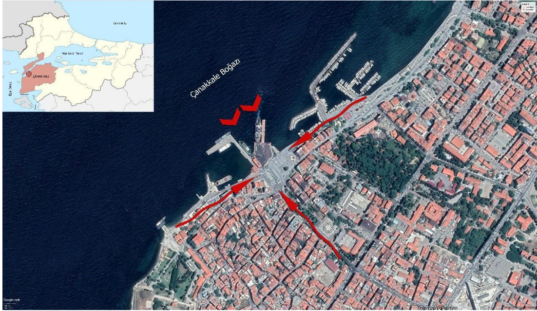
Şekil 1. Çanakkale İskele Meydanı

Araştırmanın yönteminde ilk olarak konu ile ilgili literatür çalışmaları yapılarak çalışma alanı yerinde incelenmiş, veri toplama, analiz ve sentez ile değerlendirme yapılmıştır. Sonraki aşamada, taş boyama sanatı ile ilgilenen katılımcılar ile dijital birebir görüşme yöntemi uygulanmıştır. Bu yöntem, çalışma konusuyla ilgili bilgi, deneyim veya problem amaçlı soruların konunun uzmanlarına sorulması şeklinde gerçekleştirilmiştir. Araştırmanın son aşamasında ise tasarım fikri oluşturularak, çizim ve uygulama ile ifade edilmesi için atölye çalışması yapılmıştır.