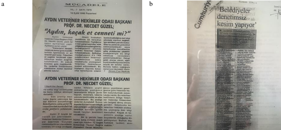
Şekil 5: Ulusal ve yerel basında yer alan demeçler (1996) (a): Yerel Gazete (b): Ulusal Gazete. (1994-2019 Yılları Basın Dosyası, Aydın VHO Arşivi).

Figure 4: Aydın Chamber of Veterinary Surgeons in Local Press (a): Opening of new office, (b): Press statements.