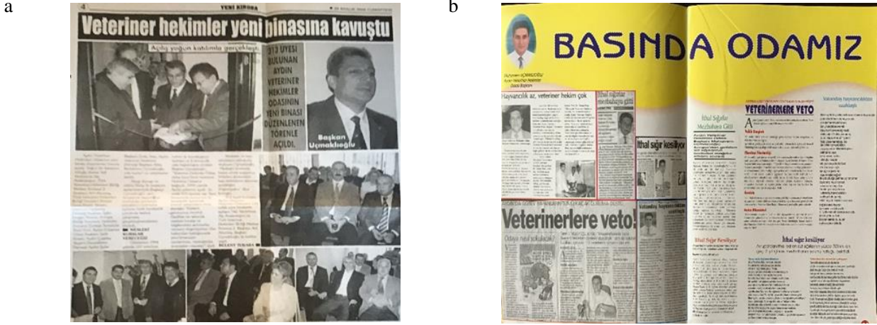
Şekil 4: Yerel Basında Aydın VHO (a):Yeni ofis açılışı, (b): Basın demeçleri.

Aydın VHO çeşitli tarihlerde, Aydın'ın yerel basın organlarında da yer alarak, faaliyetlerine, veteriner hekimliği mesleğine ya da önemli gündem konularında demeçler vererek çalışmalarından bahsetmiştir. (Şekil-4/ Şekil-5) 37 . Aydın ili sınırları içerisinde yabancı hayvan orjinli kuduz vakalarına ilişkin 2002 yılında oda başkanlığı tarafından yerel bir televizyon kanalında; veteriner hekimliği mesleği tanıtılmış ve kuduz konusunda bilgi verildiği belirlenmiştir 38