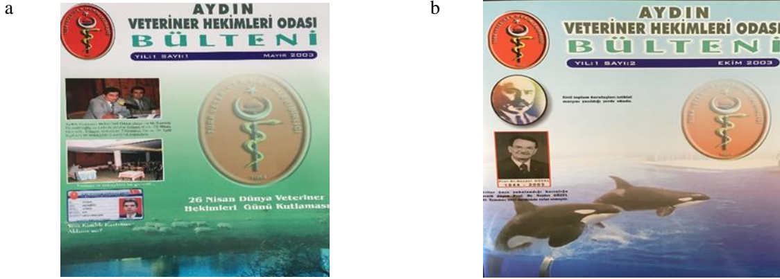
Şekil 2.: Aydın VHO Bülteni 1. (a) ve 2. sayılar (b).