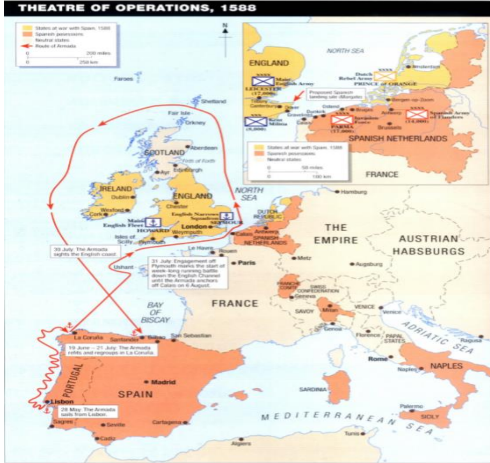
Harita 1: İspanyol donanması Armada'nın sefer güzergâhı