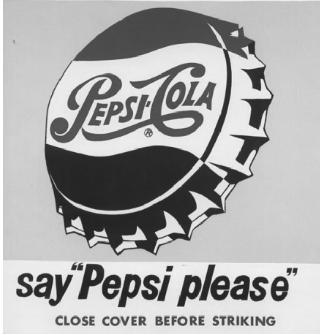
Resim 5 Andy Warhol "Close Cover Before Strinking" tuval üzerine Akrilik, 197cmx 137cm, 1962