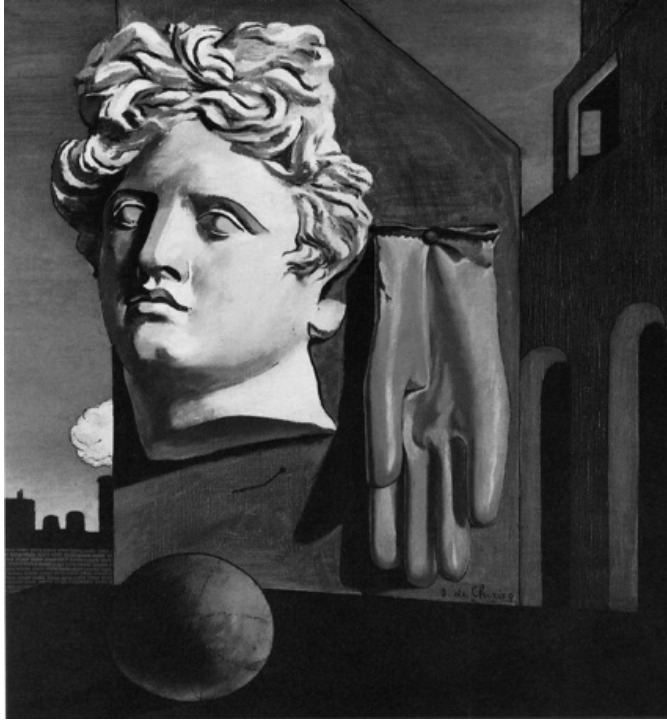
Resim 3 Giorgio De Chirico, "Aşk Şarkısı" 1914, 73x59.1.

Chirico, resimlerinde yalnızlık, derin boşluklar, düş dünyası, rüya ve bilinçaltı gibi metafizik konularını ele almıştır. Chirico, "Aşk Şarkısı" (1914) adlı eserinde Sürrealistlere has bir özellikle birbiriyle ilişkisi olmayan ya da olmaması gereken yerde objeleri inşa edip yerlerini değiştirir. Apollon Başı ve Yunan mimarisine has yapıyı anormal ölçülerde resmedilmiş, eldiven, plastik top gibi gündelik hayattaki objeleri bir tiyatro sahnesi andıran mekanda bir araya getirir. Antik prestij ve gündelik nesnelere esrarengiz ve gerçek bilgi geçmişle gelecek arasında bilgiyle bir köprü kurar. (Resim 3).