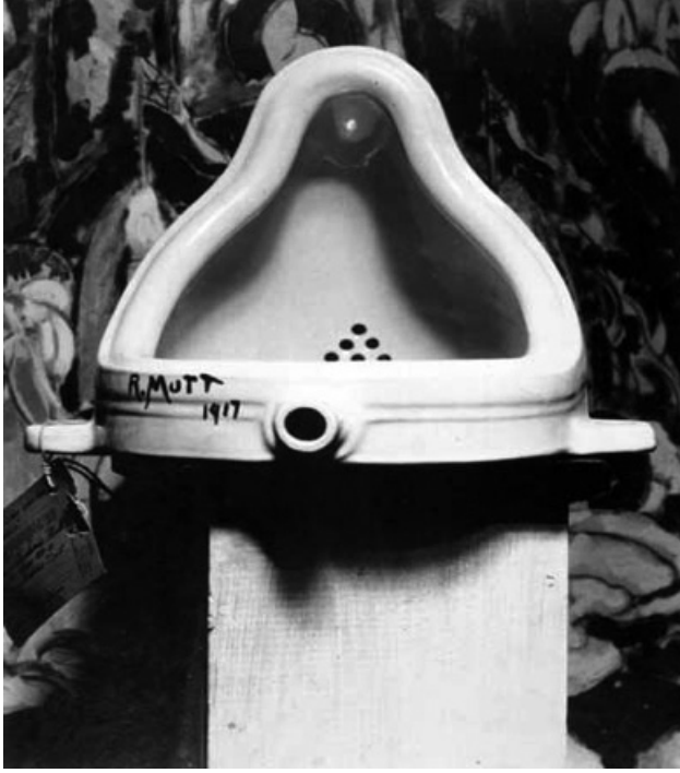
Resim 2 Marcel Duchamp, "Çeşme" (Pisuar), 1917, 33x42x52.

Marcel Duchamp, gündelik bir nesnenin kendi zamanına göre adeta zamanın dışına çıkararak olağandışı, bir biçimde sanatsal bir objeye dönüştürerek gündelik hayatın içinden çıkardı. Duchamp'ın sanayi ürünü hazır nesnesi "Pisuar" dönemin geleneksel sanat anlayışına ve estetik anlayışına oldukça uzaktı. Duchamp'ın bu endüstriyel hazır nesnesi "Pisuar"ı kişisel beğenisi ve tercihi sanat olan ile olmayanın sınırını zorlaması, gündelik hayata ait olan nesnenin dönüşümü estetik açıdan tartışmalara yol açmıştı.