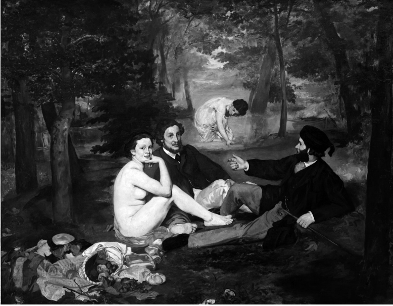
Resim 1 Edouard Manet “Kırda Öğlen Yemeği” 1863, Tuval üzerine yağlıboya,

19.yüzyılda Fransa’da başlayan kendinden sonraki sanat akımlarını ciddi bir şekilde etkileyen Empresyonizm’de (İzlenimcilik) doğanın zamana bağlı olarak dönüşümünün ve duygusal izlerin önemi artırmıştır. Empresyonizm yeni görme biçimlerinin geliştirilmesi açısından ve sanatın kişiselleşmesinin adeta özel bir durumu haline gelmiştir. Buna bağlı olarak yaşamda görmenin gerçeklikle olan ilişkisi ve zihinsel süreçlere doğru yönelmesi bu dönemde farklı tepkilere yol açmıştır. Brecht’in iddia ettiği gibi: “Gerçeklik değiştiğinde, onu temsil edebilecek yöntemler de değişmek zorunda kalacak mı?” (Antmen, 2013:18).