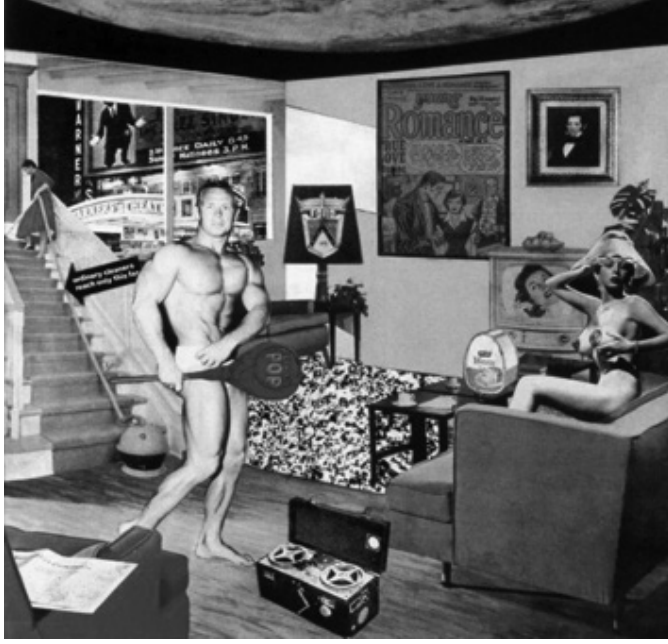
Resim 4 Richard Hamilton "Bugünün Evlerini Bu Denli Farklı, Bu Denli Cazip