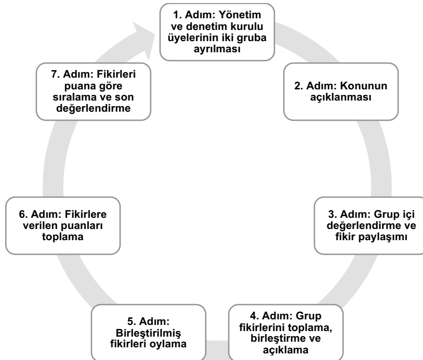
Şekil 1. Nominal Grup Tekniği Uygulama Diyagramı 6