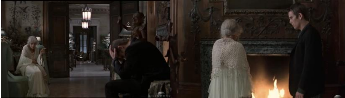
Şekil 14. Esinlenerek Uyarılma Örneğinde Dinsmoor Malikanesi, geç dönem. (Cauron, 1998)

Başkarakter Finn, aynı konutu yıllar sonra tekrar ziyaret eder. Filmde bu ziyaret, bir hesaplaşma ve gerçeği buluş olarak ele alınmıştır. Bayan Dinsmoor, bu kısımda daha dengeli bir kişilik sergiler. Karakter renkli ve abartılı kostümlerinden sıyrılmış, yaşıyla uyumlu beyaz bir kostüm giymiştir. Konut iç mekanı bu kez çok daha düzenli ve aydınlıktır (Şekil 14). Duvar yüzeylerindeki bitkisel desenli duvar kağıtları ve koridor boyunca görülen metal aksamli fener tavan aydınlatmaları, Viktorya İngiltere'sine göndermeler içerir. Yaşam alanında yanan mermer alınlı şömine, yine bu dönemin hayatla birleştirdiği simgelerden biri olarak, Dinsmoor'un yaşama döndüğüne dair bir belirti olarak düşünülebilir. Şömine yüzeyinde dönemin vazgeçilmezi bitkisel desenler metal işçilikle birleştirilmiştir.