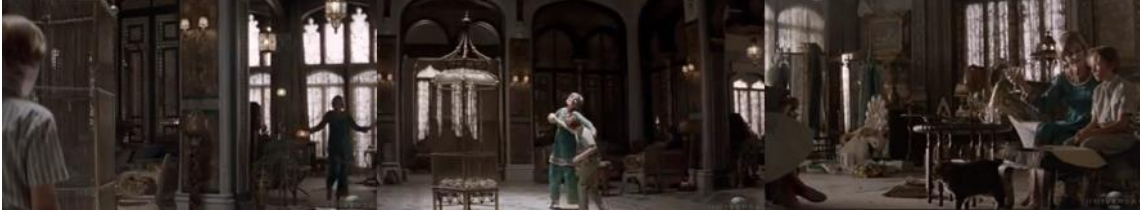
Şekil 13. Esinlenerek Uyarılma Örneğinde Dinsmoor Malikanesi, kişisel alan. (Cauron, 1998)

Başkarakter Finn, aynı konutu yıllar sonra tekrar ziyaret eder. Filmde bu ziyaret, bir hesaplaşma ve gerçeği buluş olarak ele alınmıştır. Bayan Dinsmoor, bu kısımda daha dengeli bir kişilik sergiler. Karakter renkli ve abartılı kostümlerinden sıyrılmış, yaşıyla uyumlu beyaz bir kostüm giymiştir. Konut iç mekanı bu kez çok daha düzenli ve aydınlıktır (Şekil 14). Duvar yüzeylerindeki bitkisel desenli duvar kağıtları ve koridor boyunca görülen metal aksamli fener tavan aydınlatmaları, Viktorya İngiltere'sine göndermeler içerir. Yaşam alanında yanan mermer alınlı şömine, yine bu dönemin hayatla birleştirdiği simgelerden biri olarak, Dinsmoor'un yaşama döndüğüne dair bir belirti olarak düşünülebilir. Şömine yüzeyinde dönemin vazgeçilmezi bitkisel desenler metal işçilikle birleştirilmiştir.