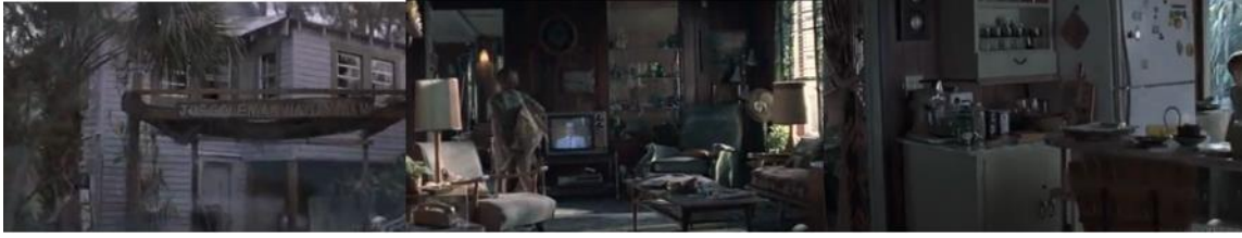
Şekil 7. Esinlenerek Uyarlama Örneğinde Finn Bell'in Konutu, çocukluk dönemi (Cauron, 1998)

kaplamasından, ihtiyaca dönük kullanımın ön planda olduğu sonucu çıkarılabilir. Evin dış ve iç mekan görüntülerinde soğuk filtreler ile aktarılan renklerle bunaltıcı bir atmosfer yaratılmıştır.