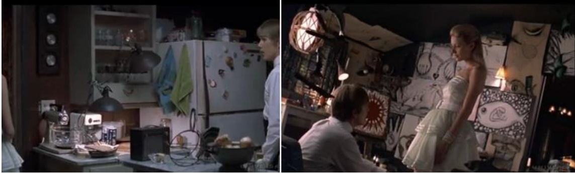
Şekil 8. Esinlenerek Uyarlama Örneğinde Finn Bell'in Konutu, gençlik dönemi. (Cauron, 1998)

Filmin başkarakterinin çocukluk ve gençlik dönemleri boyunca kullandığı konutta, genel kullanım alanında hiçbir değişiklik olmadığı dikkat çekicidir. Gençlik döneminin anlatıldığı karelerde mutfak alanında daha canlı renkler kullanıldığını, aydınlatma ile kısmen daha sıcak ve sakin bir atmosfer yaratıldığını görürüz. Kendisini büyüten Joe ile geçirdiği bu yıllarda Finn'in, daha sakin ve rahat olduğunu hissederiz. Bu dönemde Finn'in evdeki özel alanına, odasına yoğunlaşılır. Odanın duvar yüzeyleri Finn'in yaptığı resimlerle kaplıdır. Özel alanında karakterin resme olan yeteneğini keşfederiz (Şekil 8).