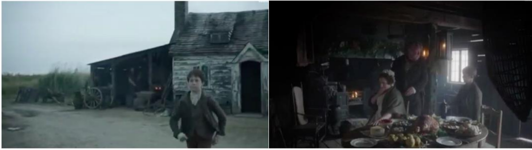
Şekil 2. Doğrudan Uyarlama Örneğinde Viktoryan alt sınıf konutu_Pip'in çocukluk evi, dış ve iç mekan. (Kirk, 2011)

Filmde izlenen ikinci konut, Pip'in Londra'da yaşadığı döneme aittir. Pip esrarengiz bir mirasla hızla zenginleşmesinin ardından kentli bir centilmen olarak sınıf atlar. Yükselme hırsıyla girdiği bu zengin ortam, yine dönemin başlıca iç mekan karakteri ile temsil edilir. Üst sınıf Viktoryan konutunun başlıca iç mekan donatıları olarak, şömine, duvar yüzeylerinde ahşap giydirmeler, eklettik mobilyalar ve metal şamdanlar dikkat çekicidir. (Şekil 3)