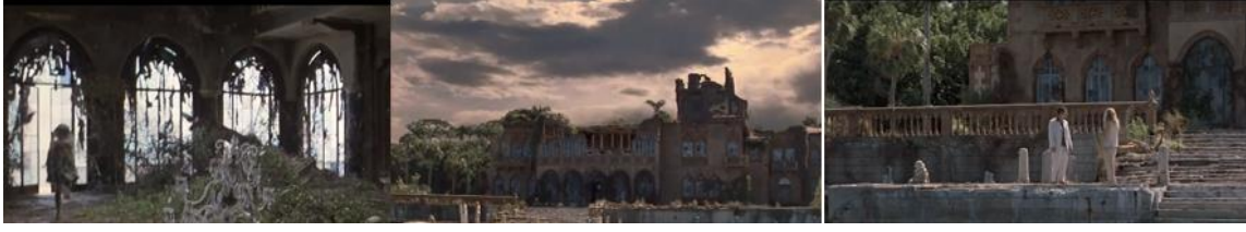
Şekil 15. Esinlenerek Uyarlama Örneğinde Dinsmoor Malikanesi, son dönem. (Cauron, 1998)