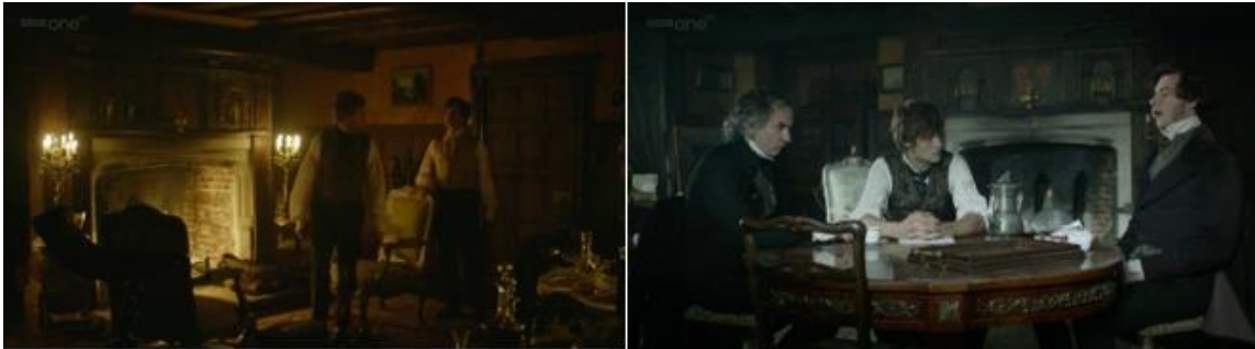
Şekil 3. Doğrudan Uyarlama Örneğinde Viktoryan Konutu_Centilmen Pip'in Londra Konutu, iç mekan. (Kirk, 2011)

Filmde izlenen ikinci konut, Pip'in Londra'da yaşadığı döneme aittir. Pip esrarengiz bir mirasla hızla zenginleşmesinin ardından kentli bir centilmen olarak sınıf atlar. Yükselme hırsıyla girdiği bu zengin ortam, yine dönemin başlıca iç mekan karakteri ile temsil edilir. Üst sınıf Viktoryan konutunun başlıca iç mekan donatıları olarak, şömine, duvar yüzeylerinde ahşap giydirmeler, eklettik mobilyalar ve metal şamdanlar dikkat çekicidir. (Şekil 3)