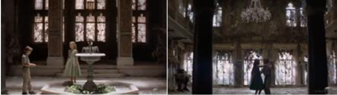
Şekil 12. Esinlenerek Uyarlama Örneğinde Dinsmoor Malikanesi, İç Mekan. (Cauron, 1998)

Şekil 13'te yer alan kareler, Bayan Dinsmoor'un kabul salonu ve yatak odasından görüntüler içermektedir. Viktoryan döneme bir diğer gönderme olarak bu kapıda ve ahşap mobilyada egzotik bezemeli kaplamalar dikkati çeker. Genel eklektik yapı kişisel alanda da hakimdir. Egzotizmin belirgin simgelerinden büyük boy bir kafes iç mekânın ortasında yer almaktadır ki dönem etkisi kadar, özgürlük-esaret ikilemini yansıtmaya anlamında da simgesel bir anlam taşıdığı söylenebilir. Odanın donatıları, yapının dış cephesi ile uyum içinde eklektik biçimsel özellikler taşırlar. Pencere önündeki giyinme alanı, egzotik figürlerle süslenmiş bir paravanla ayrılmıştır. Finn'in çizim yaptığı sehpalardan biri sedef kakmaları, koyu renk masif ahşap malzemesi ve incelen kesitli ayakları ile eklektik özellikler taşıırken, diğeri altın varak kaplanmış eğrisel formlu bacakları ile Neo-barok döneminin biçimsel özelliklerini gösterir. Tuvalet masası ise bezemeli, kıvrımlı ayakları, eğrisel kontürlü tablası ile Neo-rokoko dönemsel izler taşımaktadır.