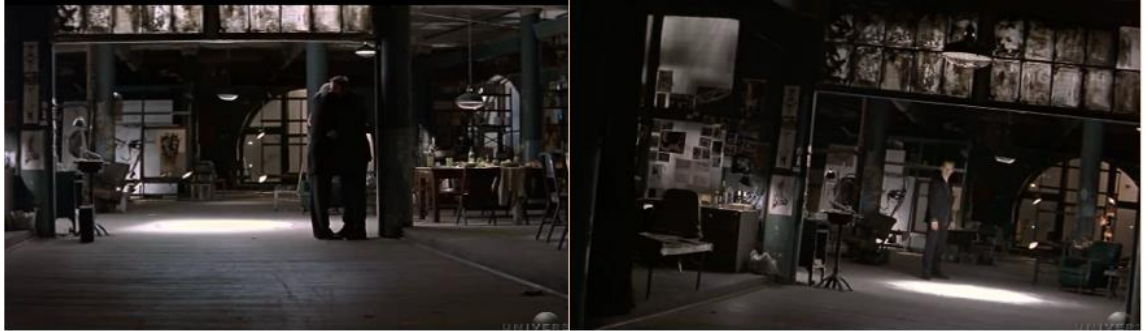
Şekil 10. Esinlenerek Uyarlama Örneğinde Finn'in New York'da Yaşadığı Loft. (Cauron, 1998)

Filmde izlenen ikinci konut, Finn'in New York' da kısa sürede ünlenmesinin ardından yaşadığı lofttur (Şekil10). Viktorya İngiltere'sinde kırma çatılı yuva ortamına endüstriyel ürünlerin girişine benzer şekilde burada da endüstriyel bir yapı, konut olarak kullanılmaya başlamıştır. Çünkü Finn karakteri, tıpkı 19.Yüzyıl burjuvasında olduğu gibi hızlıca zengin olmuştur. Çelik strüktürlü asma katın duvar yüzeyleri Finn'in çalışmaları ile kaplıdır. Çelik malzeme ve siyah beyaz kontrastı, yuva sıcaklığından uzak, soğuk bir atmosferi vurgulamaktadır. Büyük şehirdeki yeni yaşamı ifadesi, hem konutun ezici oranları hem de soğuk renk planlaması ile karakterin yalnızlığına dikkat çekmektedir.