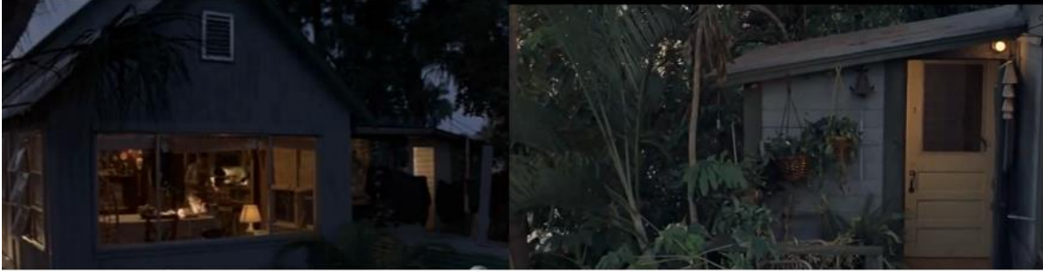
Şekil 9. Esinlenerek Uyarlama Örneğinde mutlu aile evi. (Cauron, 1998)

Filmde izlenen ikinci konut, Finn'in New York' da kısa sürede ünlenmesinin ardından yaşadığı lofttur (Şekil10). Viktorya İngiltere'sinde kırma çatılı yuva ortamına endüstriyel ürünlerin girişine benzer şekilde burada da endüstriyel bir yapı, konut olarak kullanılmaya başlamıştır. Çünkü Finn karakteri, tıpkı 19.Yüzyıl burjuvasında olduğu gibi hızlıca zengin olmuştur. Çelik strüktürlü asma katın duvar yüzeyleri Finn'in çalışmaları ile kaplıdır. Çelik malzeme ve siyah beyaz kontrastı, yuva sıcaklığından uzak, soğuk bir atmosferi vurgulamaktadır. Büyük şehirdeki yeni yaşamı ifadesi, hem konutun ezici oranları hem de soğuk renk planlaması ile karakterin yalnızlığına dikkat çekmektedir.