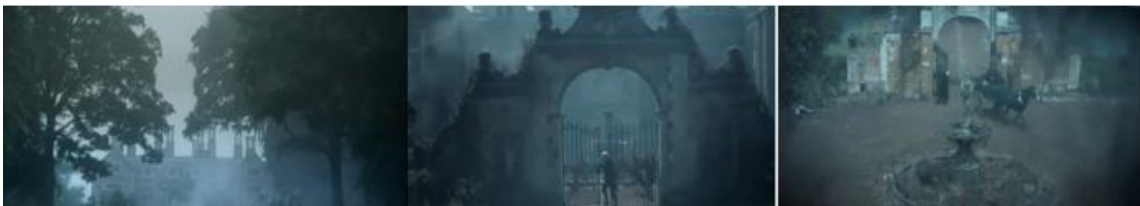
Şekil 4. Doğrudan Uyarlama Örneğinde Viktoryan Konutu, Dış mekan _ Bayan Havisham Evi. (Kirk, 2011)

Filmde izlenen üçüncü konut, tüm anlatıya temel oluşturan Bayan Havisham'ın kızı Estella ile birlikte yaşadığı malikanedir. Filmin büyük bir bölümü, bu zengin konutunun görüntülerinden oluşmuştur. Anlatıdaki şekliyle, Pip'in çocukluk, gençlik dönemleri boyunca her hafta ziyaret ettiği bu konut, yıllar içinde bir değişime uğramaz. Yapı dış mekan görüntülerinde anlatıdaki atmosferi birebir karşılayacak şekilde sisli, donuk bir renk filtresiyle yalnız ve sıkıntılı bir biçimde tarif edilir.