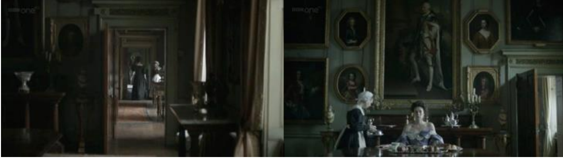
Şekil 6. Doğrudan Uyarlama Örneğinde Viktoryan Konutu_Estella Evi. (Kirk, 2011)