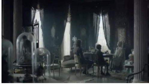
Şekil 5. Doğrudan Uyarlama Örneğinde Viktoryan Konutu_ Bayan Havisham Evi.