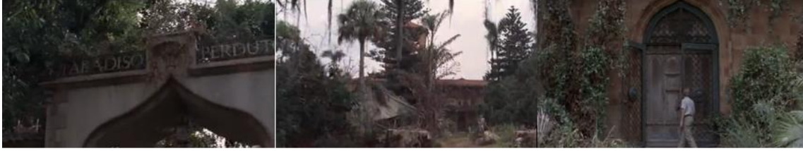
Şekil 11. Esinlenerek Uyarlama Örneğinde Dinsmoor Malikanesi Dış Mekan. (Cauron, 1998)

düğün gecesinden sonra yıllarca, olduğu gibi bırakılmış harap bir yerdir. İç mekanda, eklektik biçimsel özellikler barındıran mermer bir süs havuzu ve iki katlı galerinin ortasında görkemli bir avize görülür. Yırtık perdeler ve donatısız boş mekan yalnızlık ve yıpranmışlık duygusunun güçlü aktarımlarıdır. (Şekil 12).