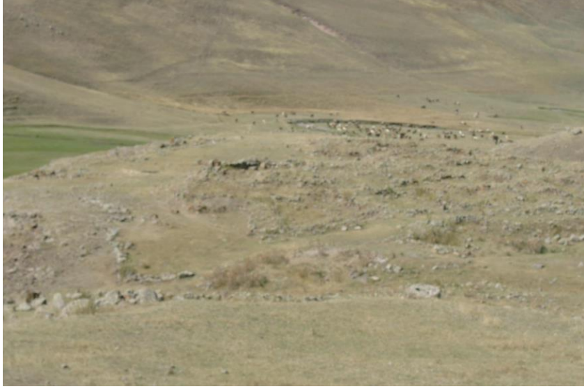
Resim-9 Carcı Yerleşmesi