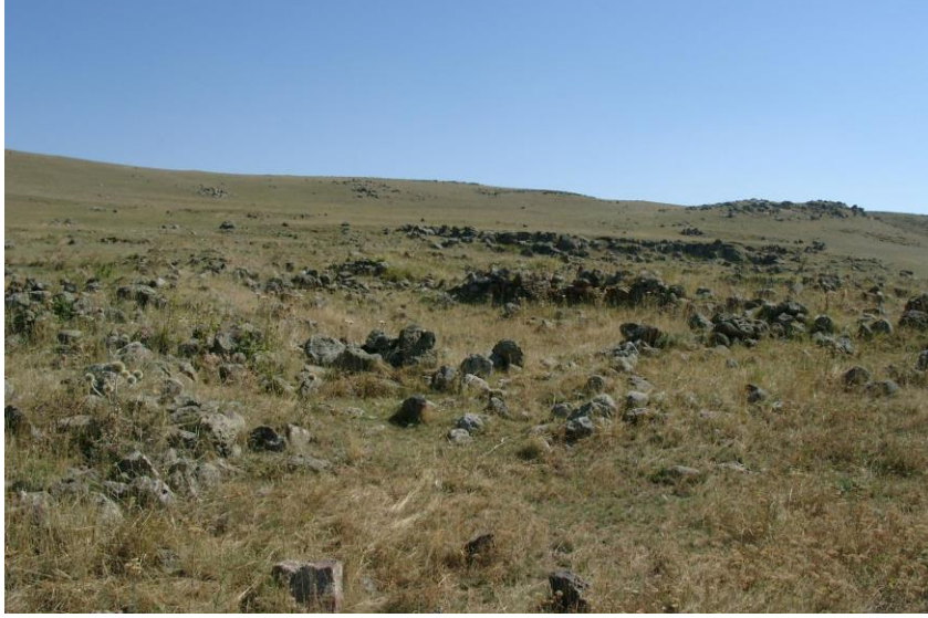
Resim-7 Zöhrap Yerleşmesi