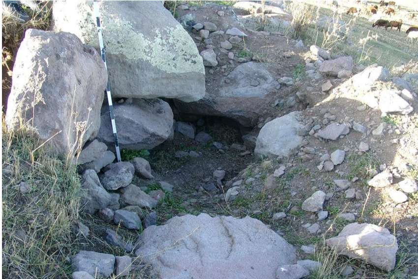
Resim-6 Kilisetepe Yerleşmesi