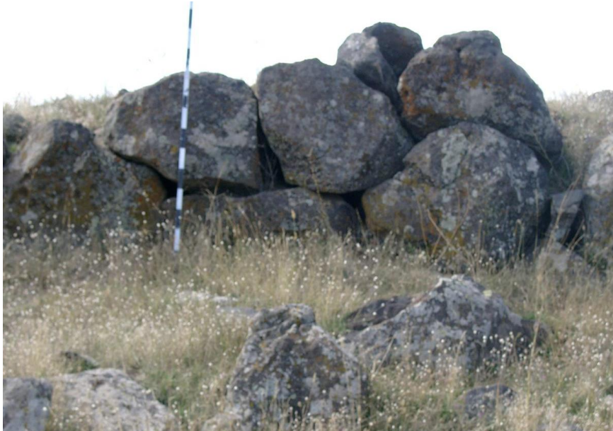
Resim-4 Yarbaşı Yerleşmesi