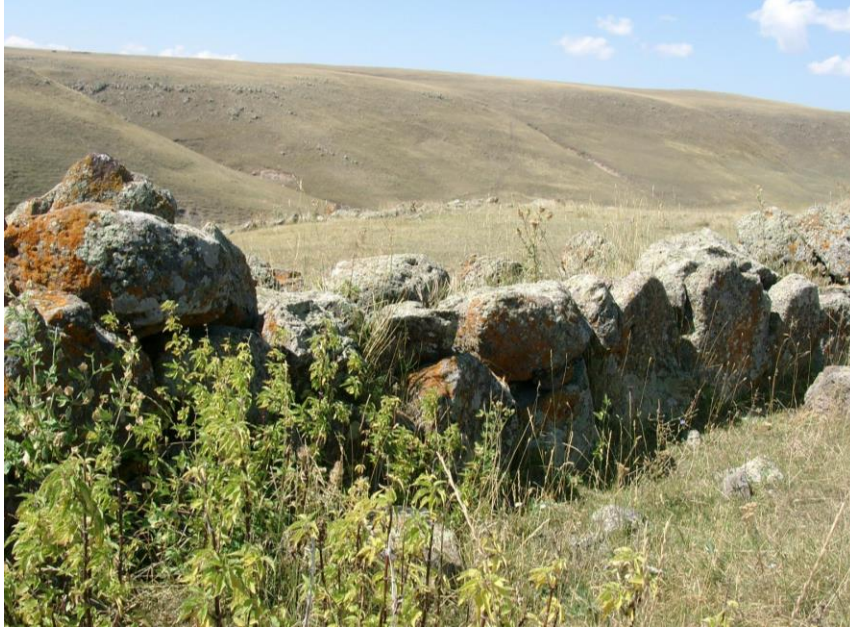
Resim-8 Zöhrap Yerleşmesi