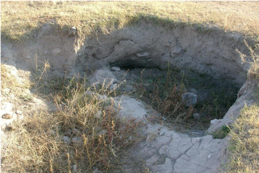
Resim-16 Tepecik Yerleşmesi