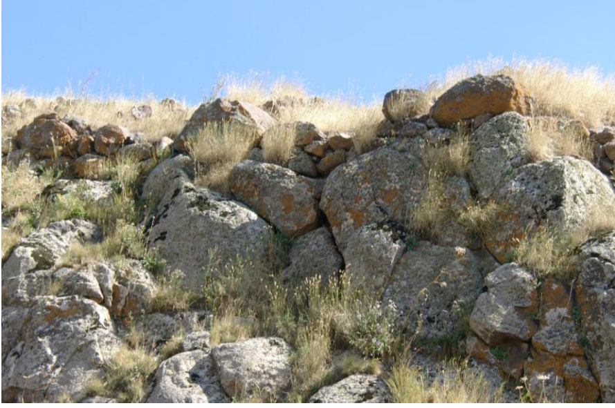
Resim-13 Carcı Kalesi