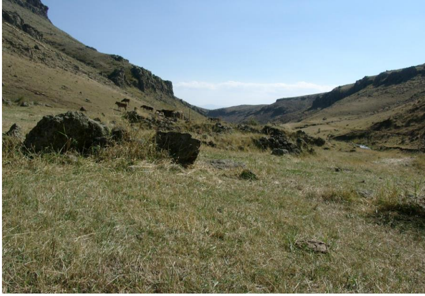
Resim-11 Carcı 2 Yerleşmesi