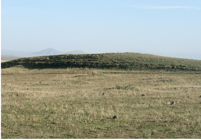
Resim-5 Kilisetepe Yerleşmesi