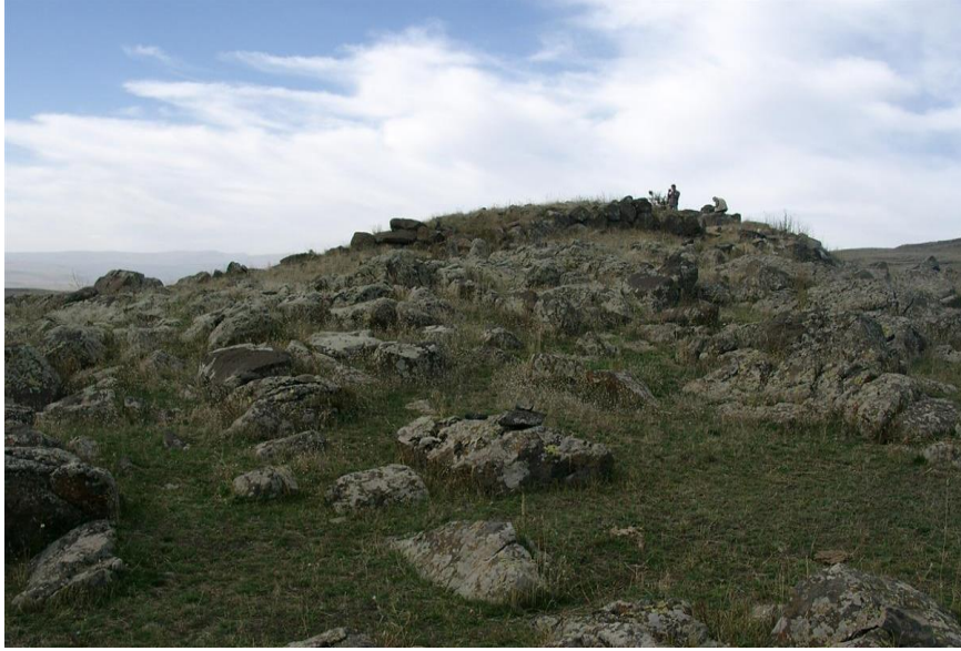
Resim-3 Yarbaşı Yerleşmesi