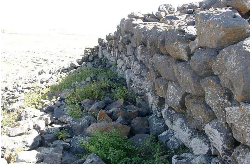
Resim-2 Polat Kalesi