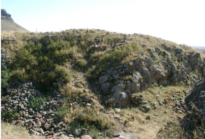
Resim-12 Carcı Kalesi