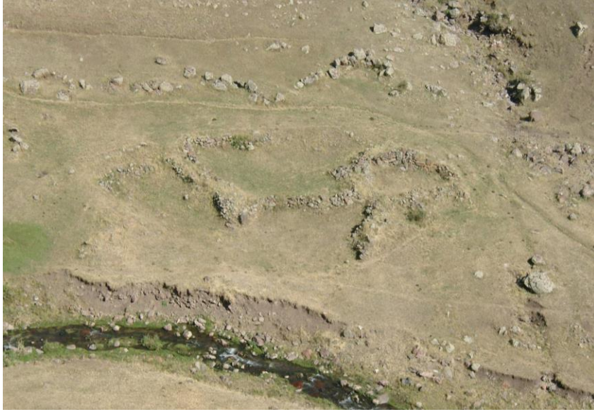
Resim-10 Carcı-2 Yerleşmesi