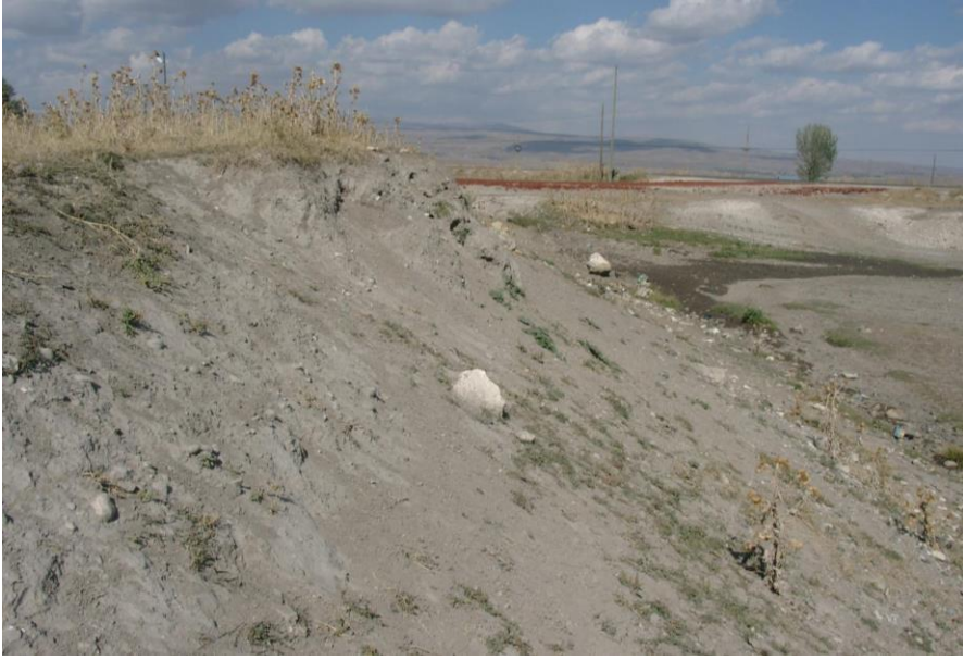
Resim-15 Yalınçayır Höyük