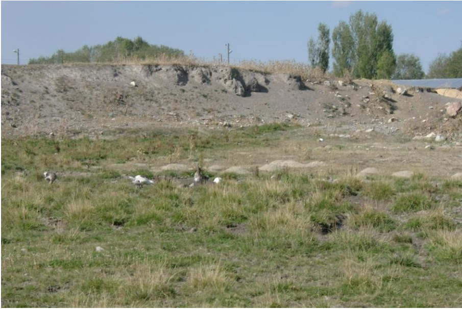
Resim-14 Yalınçayır Höyük