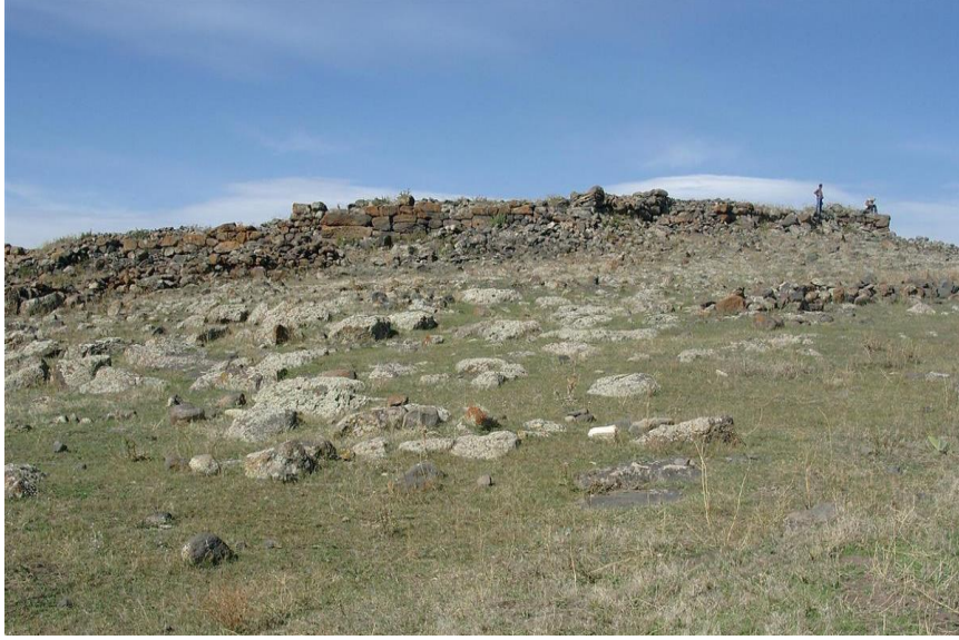
Resim-1 Polat Kalesi