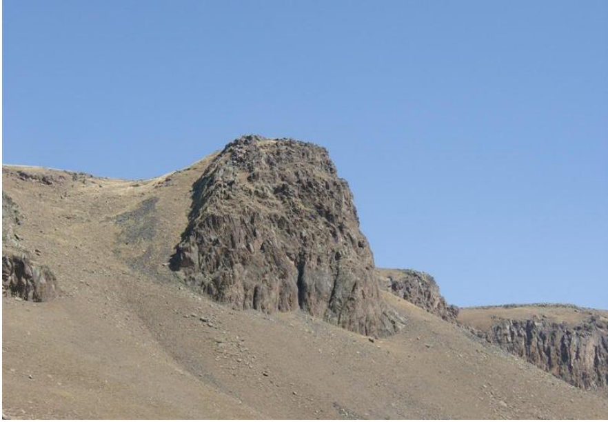
Resim-7 Şaban Kalesi- Şaban-Kağızman