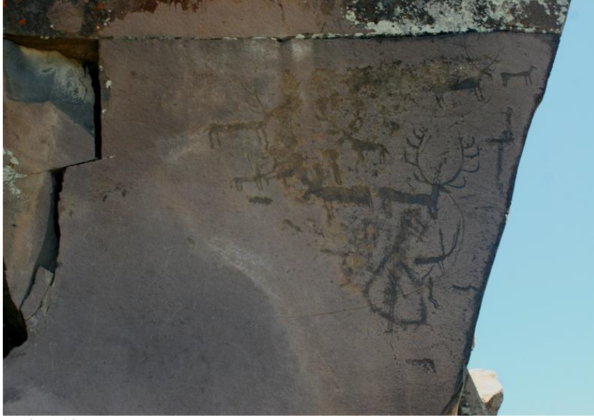
Resim-13 Yazılıkaya Kaya Panoları-Kağızman