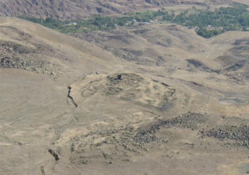
Resim-6 Çallı(Har) Kalesi- Çallı/Kağızman