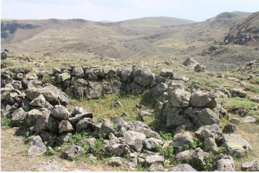
Resim-3 Kuyumcular Yerleşmesi- Kozlu /Kağızman