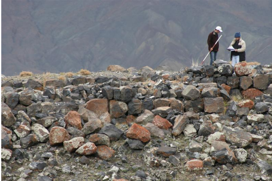
Resim-10 Kızlar Kalesi- Çeperli/Kağızman