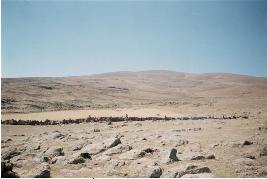
Resim-11 Çamuşlu Kaya İşaretleri- Çamuşlu/Kağızman