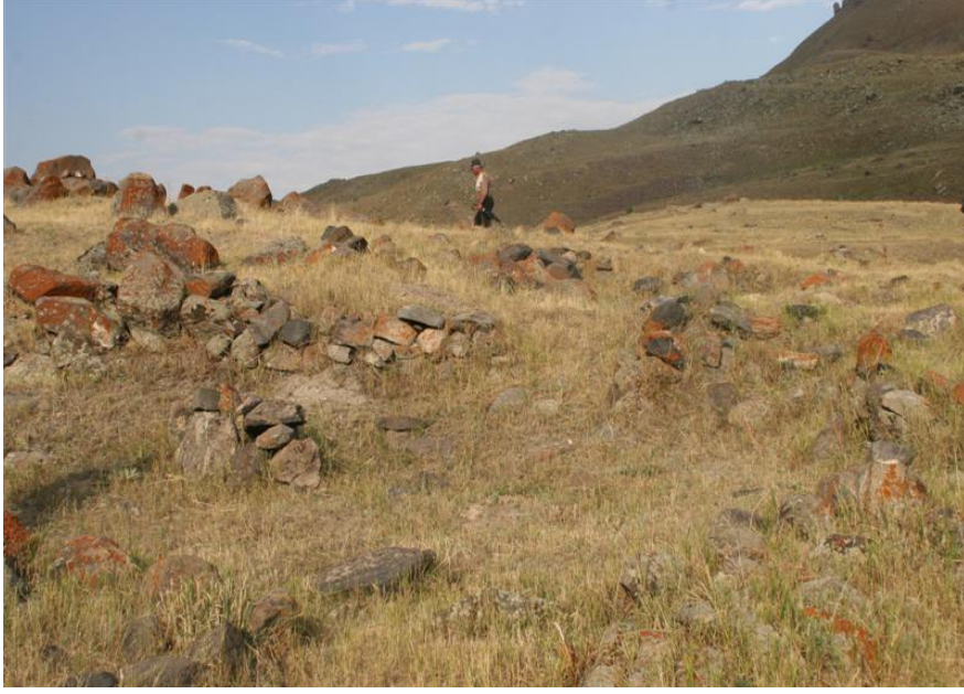
Resim-1 Budakveren Yerleşmesi- Kozlu/Kağızman