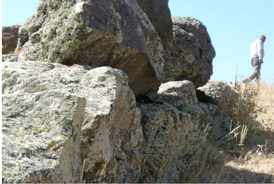
Resim-8 Sakasen Kalesi-Şaban/Kağızman