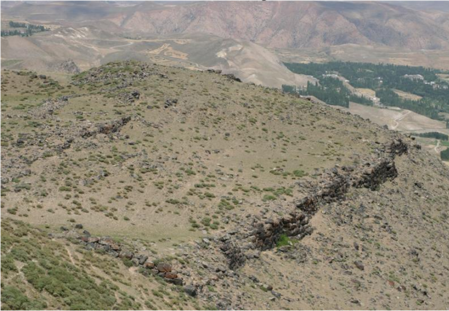
Resim-2 Kozlu Kalesi- Kozlu/Kağızman