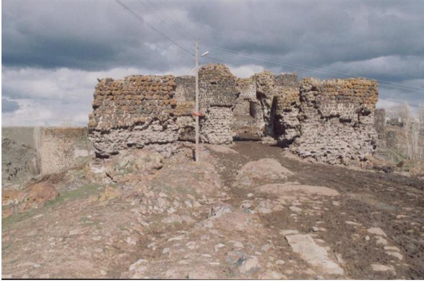
Resim-5 Keçivan Kalesi- Keçivan /Kağızman