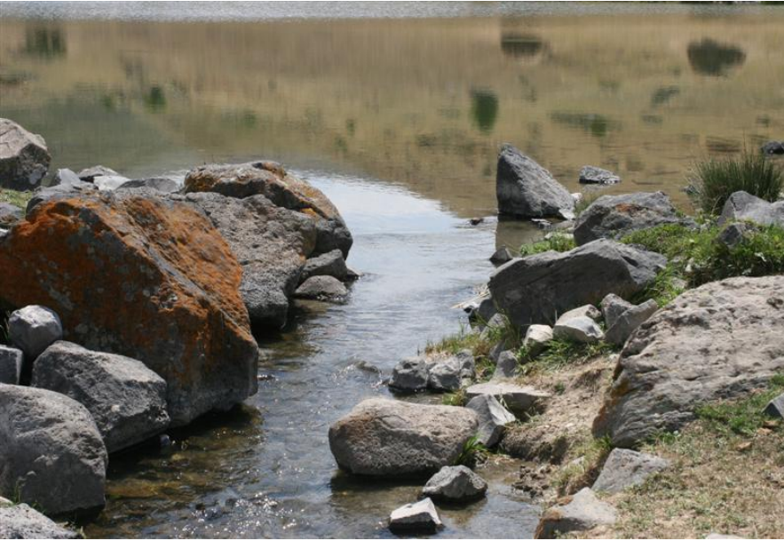
Resim-4 Kozlu Göletleri- Kozlu-Kağızman