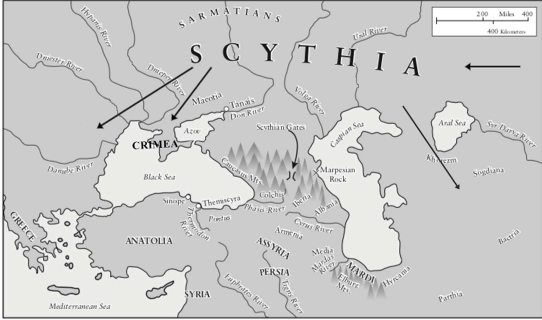
Harita 1: İskit coğrafyası.