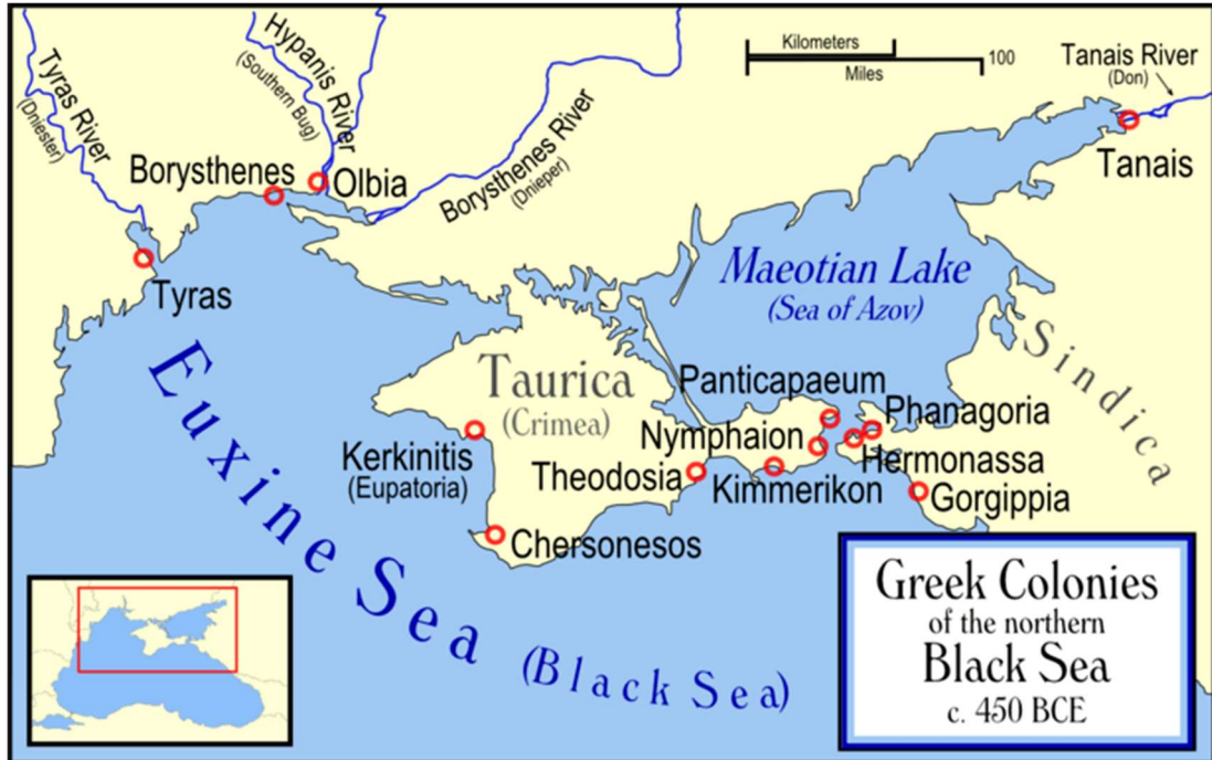
Harita 2: Karadeniz'in kuzeyinde Grek kolonileri. ( https://www.ancient.eu/image/72/greek-colonies-of-the-northern-black-sea/ )