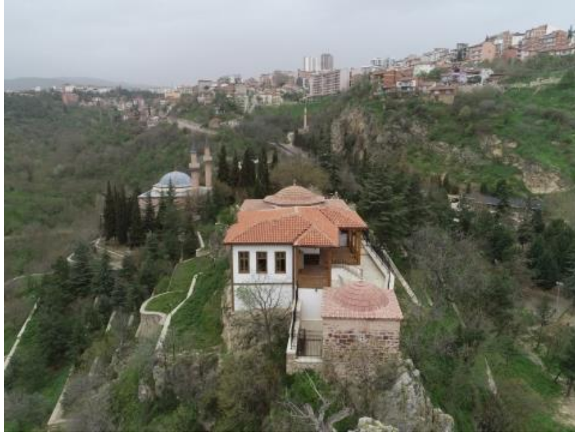
Fotoğraf 1- Şeyh Edebali Türbesi ve Orhan Gazi Camisi Photograph 1- Şeyh Edebali Tomb and Orhan Gazi Mosque

Kaynak: https://www.star.com.tr/yerel-haberler/seyh-edebali-turbesi-3573218/ Erişim: 10.02.2020