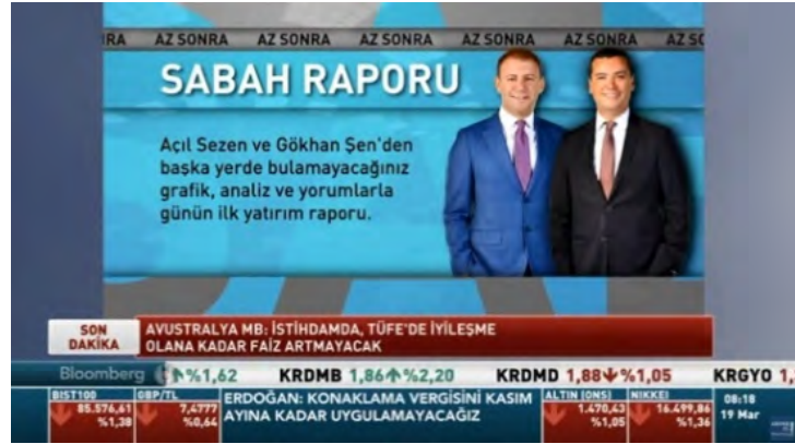
Görsel 6: Bloomberg Tv yayın akışı ön bilgi (teaser) ekran görüntüsü. 2020. https://www.youtube.com/watch?v=4s1NwwWmaKA . E.T. 19.03.2020.

Televizyon kanallarının her türlü yayın akışında kullandığı görselleri kapsayan ve yapı olarak iki ve üç boyutlu grafiklerin bir arada kullanıldığı sayısal görsel paketine Yayın Tasarımı (Broadcast Design) denilmektedir. Televizyon yayıncılığına hareketli ve estetik bir görsel tasarım disiplini getirilmiş olmaktadır. Bilgisayar destekli sayısal görüntülerin yayın akışına ilgili donanım ve yazılımlarla aktarılması şeklinde gelişen süreçte estetik görüntülerden oluşan yayın içeriğinin izleyici üzerinde olumlu etki oluşturması beklenmektedir. Görsel 7'de 2010 yılında yayın yapmaya başlayan Beyaz TV isimli televizyon kanalı için hazırlanmış üç boyutlu görüntülerden oluşan yayın tasarımında, hareketli grafiklerin ve renk düzenlemelerinin etkileyici olduğu görülmektedir. Soyut biçimli şekillerin sürekli hareket etmesinin yanında kanal ile ilgili logo ve diğer görseller bir arada yer almaktadır. Yayın içerikleri hakkındaki başlıklar, üç boyutlu olarak hazırlanan tipografik görseller halinde hareketli ve değişken yapıli kurgularda yansıtılmıştır.