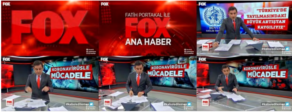
Görsel 10: FOX Ana Haber bülteninden ekran görüntüsü. 10 Nisan 2020 https://www.youtube.com/watch?v=WIRklRbGavQ . E.T. 19.05.2020.