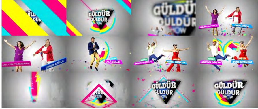
Görsel 12: Eğlence programı “Güldür güldür Show”un kısa tanıtımını yapan görüntüler. 2015. https://www.youtube.com/watch?v=yZh6NdGZ9FE . E.T. 19.04.2020.

Show” isimli programın giriş kısmına ait görüntüler bulunmaktadır. Programın sunumunu yapan ve içeriğinde yer alan oyuncuların isimleri ile tanıtan görüntülerde, kişilerin gerçek görselleri ile birlikte bilgisayar ortamında hazırlanmış grafikler ve tipografiler bir arada kullanılmıştır. Program isminin üç boyutlu olarak ekranda görülmesinin ardından oyuncuların isimleri renkli alanlar içinde hareketli olarak belirmektedir. Parlak renkli hareketli grafiklerin de kullanılması kısa tanıtım girişini etkili bir sunum haline getirmiştir.