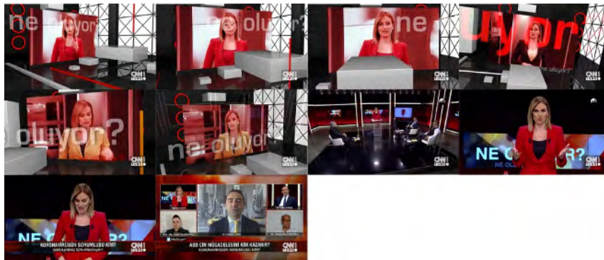
Görsel 13: CNN TÜRK - Ne Oluyor? Tartışma programı giriş görüntüleri.Y.T.: 17.05.2020 https://www.youtube.com/watch?v=z0yxYgwXXqA . E.T. 23.05.2020.

Merkezi aslen Amerika Birleşik Devletleri’nde olan “CNN INTERNATIONAL” haber kanalının Türkiye’deki iştiraki olan CNN TÜRK, yapı itibari ile tematik bir televizyon kanalıdır. Gün içerisinde farklı konularda haber içerikli yayınlar yapan kanalın, “Ne Oluyor?” isimli karşılıklı tartışma şeklinde yürütülen programa ait giriş görüntüleri bulunmaktadır (Bkz. Görsel 13). Görsellerde programın adının ve sunucusunun bir arada yer alması yayının sunucusu ile özdeşleştirilmesini sağlamaktadır. Kullanılan tipografinin görüntü üzerinde farklı yönlerde kayarak hareket ettirilmesi dikkat çekme amacıyla uygulanmıştır. Yayın esansında ekranın altında kayan veya sabit duran yazıların, program hakkındaki bilgileri ve diğer ilgili haberleri aktarmak üzere kullanıldığı görülmektedir.