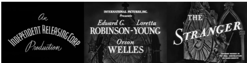
Görsel 4: Yabancı “The Stranger” isimli filmin giriş başlık kartından görünüm. 1941. https://www.youtube.com/watch?v=5zU7MoRuGDw . E.T. 01.06.2020.

Gelişim sürecinde film karelerine müdahale yolu ile farklı uygulamalar görülmüş ve kısmen de olsa hareket sağlanmış olsa da asıl hareket etkisi bilgisayar destekli düzenlemelerle mümkün olabilmiştir. Sinema kültürünün bir yapım biçimi olan “Canlandırma” tekniğinin tipografiye olan etkisini, hareketli tipografi kavramının çıkış noktası olarak değerlendirmek mümkündür. Hareket eden, canlanan tipografi, durağanlıktan çıkarak film yapımlarına hayat veren karakterler gibi yazının da hayat bulmuş şekli olmaktadır. Zaman ve hareketle yazım tasarlamak, bir mesajı geliştirmek, düşünceleri