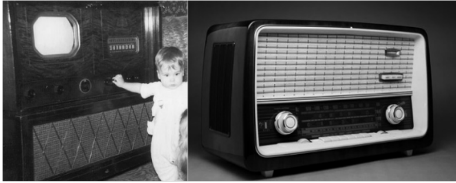
Görsel 1: 1928 yıllarına ait televizyon ve radyo görünümü. https://www.pinterest.cl/pin/85216617929894466/ . E.T. 19.03.2020.