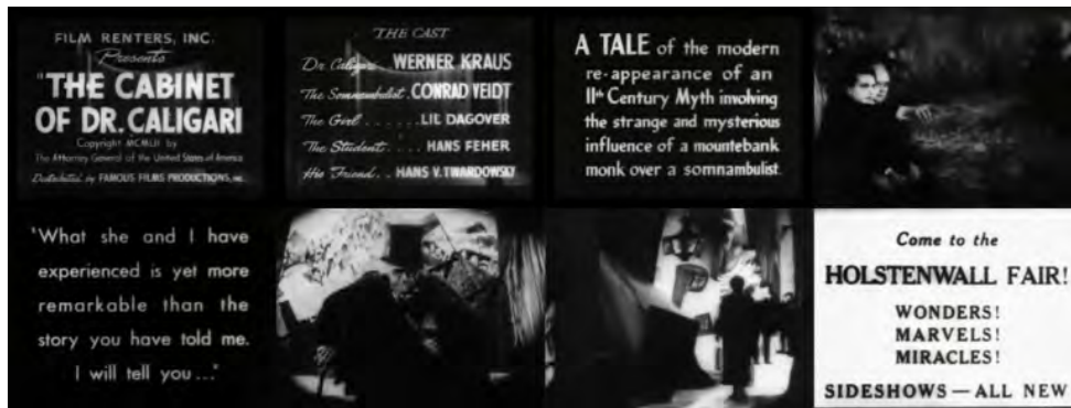
Görsel 3: “Dr. Caligari'nin Dolabı” isimli sessiz filmde bir ara başlıklı kart görünümü.1920. Korku filminin sahnelerine uygun olarak etkileyici tipografi tarzı kullanılmıştır. https://www.youtube.com/watch?v=aimAeeDx2p4 . E.T. 01.06.2020.