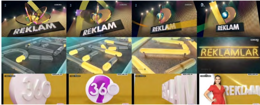
Görsel 8: Kanal D-2011, Bloomberg HT-2017, Kanal 360-2020, Reklam jenerikleri ekran görüntüleri. Kanal D: https://www.youtube.com/watch?v=XPQnwJBP5jw , Kanal 360: https://www.youtube.com/watch?v=0RFwbJjMQqA , Bloomberg HT: https://www.youtube.com/watch?v=LEi0XUj3smg . E.T.: 23.04.2020.

Televizyon yayınlarının çoğunda yapılan program içeriğine yönelik dikkat çekici hareketli yazıların dahil edildiği görülmektedir. Bu yazılar genelde okunmak üzere kayar şekilde sağdan sola doğru hareket ettirilir. Ekranın belirlenmiş alanlarında konumlandırılan farklı yazılar da yer alabilmektedir. Görsel 9'da ekonomi yayını yapan Bloomberg HT ekonomi ve haber kanalının "Grafik Düellosu" adlı ekonomi programının yayın akışından görüntüler bulunmaktadır. Görselde televizyonun alt kısmındaki kırmızı şerit üzerinden kayan yazılar son dakika haberleri ve günlük olaylarla ilgili kısa bilgiler verilmektedir. Diğer alanlarda da döviz ve borsa gibi verilerin sayısal değerleri tipografik olarak yansıtılmaktadır.