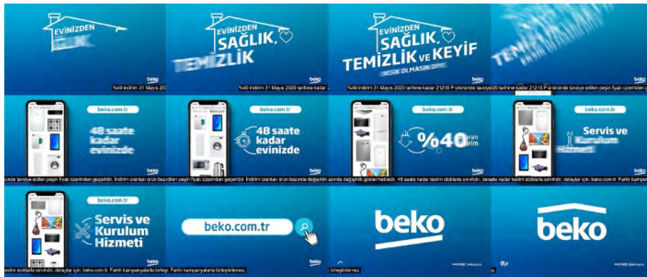
Görsel 11: beko.com.tr'de Her Sipariş 48 Saate Kadar Evinizde! Reklam filmi görüntüleri. 15 Nis 2020 https://www.youtube.com/watch?v=BnlUuQ1LjJ0 . E.T. 19.05.2020.

Kapsamında tipografik görsellerin sıklıkla hareketli olarak kullanıldığı ve televizyon yayıncılığının vazgeçilmez gelir kaynağı olan reklam filmlerinin yoğun bir şekilde yayınlanması söz konusudur. Yapım süreci sinema sektöründen aktarılmış ve kısa süreli tanıtım filmi mantığında oluşturulmasından öte, etkili bir anlatıma sahip olabilmesinde tipografinin önemi büyüktür. İlk örneklerinden bu yana reklam filmlerinde sıklıkla hareketli veya hareketsiz tipografik düzenlemeler kullanılmıştır. Günümüzde bilgisayar destekli görsel içeriklerin de dahil edilebilmesi ile tipografinin hareketli yapısı daha etkin biçimde görülmektedir. Görsel 11'de beyaz eşya üretimi yapan Beko firması için hazırlanmış reklam filminin yapımında hareketli tipografilerin yoğun kullanımı görülmektedir. Telefon görseli ile reklam tasarımının desteklenerek sözlü sunum ve hareketlendirilmiş tipografilerin bir arada kullanımı ile reklamın kurgulanması söz konusudur.