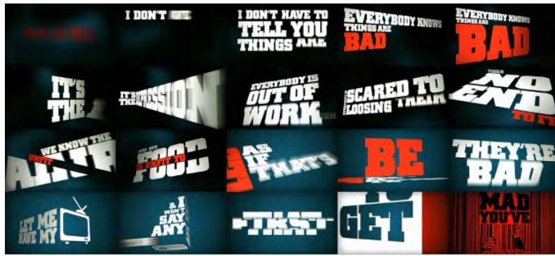
Görsel 5: Sidney Lumet Film Ağı'na (1976) dayalı "MAD AS HELL" isimli filme ait kısa bir hareketli tipografi çalışması, 2012. https://www.youtube.com/watch?v=cG6A8I5X1Xk . E.T. 19.03.2020.