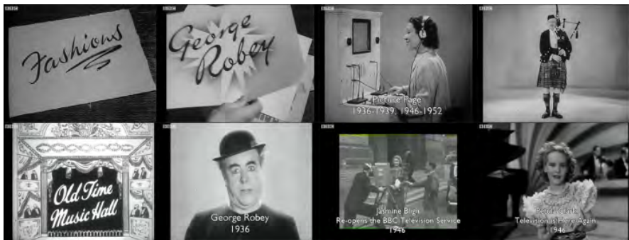
Görsel 2: İngiliz BBC kanalının (British Broadcasting Corporation) yayın görüntüleri. 1936. https://www.youtube.com/watch?v=YOQCA0r1PZk . E.T. 19.03.2020.

Televizyonun icadından önceki dönemlerde, haber ve bilgilendirme içerikli görüntülerin yayınlanması sinema salonları aracılığı ile mümkün olabilmıştır. Sinemaya olan ilginin görülmesi ile birlikte görsel seyir keyfi veren yapımların da zamanla daha çok görülmeye başlaması söz konusu olmuştur. Yüksek ışıkla beyaz perde üzerine yansıtılan pozlanmış film karelerinin arka arkaya gösterimini sağlayan cihazlar eşliğinde çalışan sinemalar, geçmişten günümüze dikkat çekici görüntüler sunması bakımında önemini sürdürmeye devam etmektedir.