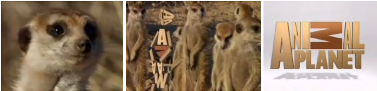
Görsel 15: Animal Planet üç boyutlu tipografi görüntüleri, 2008 https://www.youtube.com/watch?v=8VZW00SFBgk , E.T. 21.03.2020.

"Animal Planet" isimli televizyon kanalı, Amerikan uydu ve kablolu TV sisteminde 1996 yılı "Discovery Channel" televizyon yayın kuruluşunun altında faaliyet göstermeye başlamıştır. Genel yayın içeriğini hayvan belgeselleri oluşturan bu kanalda, yayınladığı yapımlar arasındaki geçişlerde kullandığı kısa tanıtım görüntülerinde, hayvanlar ile iç içe geçen tipografiler kullanılmaktadır (Bkz. Görsel 15). Kanalin ismi bilgisayar ortamında hazırlanmış üç boyutlu tipografik düzenlemelerle hayvan görüntüsü şeklinde oluşturulmuştur. Yayın akışında önce gerçek bir hayvan görüntüsü belirlemektedir. Ardından gerçek hayvanların arasına üç boyutlu tipografik hayvan biçiminde canlandırılmış görüntülerin eklendiği görülmektedir. Devamında tipografik hayvandaki harfler dağılarak "Animal Planet" yazısını oluşturmaktadır. Kısa tanıtım videolarında (jenerikler), köpek, fil, balık ve mirket gibi çeşitli hayvanların üç boyutlu tipografik olarak gerçek hayvanların bulunduğu ortamları da izleyiciye yansıtılmaktadır. Kanal, yayın içeriğiyle doğrudan ilişkili görüntülerle tipografik unsurları bir arada kullanarak farklı bir yaklaşım sunmaktadır.