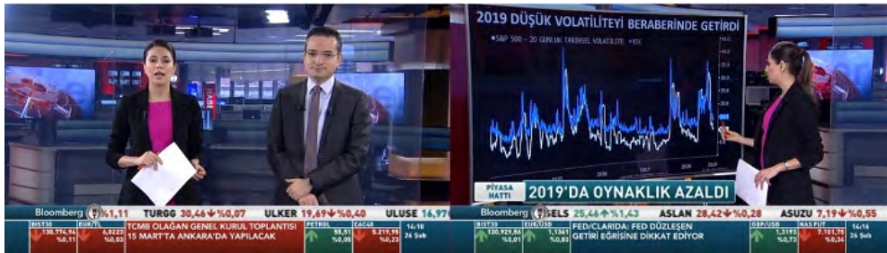
Görsel 9: Bloomberg HT "Grafik Düellosu", yayın girişi ve akışından görüntüler. 2019. https://www.youtube.com/watch?v=2kdrNwKxV3k , E.T.: 23.04.2020.

Televizyon yayınlarının çoğunda yapılan program içeriğine yönelik dikkat çekici hareketli yazıların dahil edildiği görülmektedir. Bu yazılar genelde okunmak üzere kayar şekilde sağdan sola doğru hareket ettirilir. Ekranın belirlenmiş alanlarında konumlandırılan farklı yazılar da yer alabilmektedir. Görsel 9'da ekonomi yayını yapan Bloomberg HT ekonomi ve haber kanalının "Grafik Düellosu" adlı ekonomi programının yayın akışından görüntüler bulunmaktadır. Görselde televizyonun alt kısmındaki kırmızı şerit üzerinden kayan yazılar son dakika haberleri ve günlük olaylarla ilgili kısa bilgiler verilmektedir. Diğer alanlarda da döviz ve borsa gibi verilerin sayısal değerleri tipografik olarak yansıtılmaktadır.