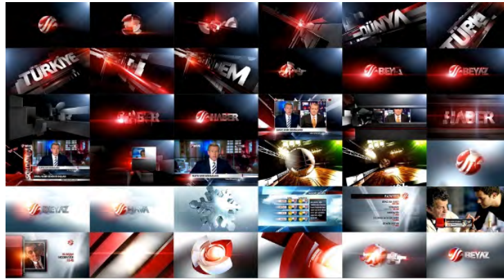
Görsel 7: Beyaz Televizyon kanalının Kurumsal görsel kimliğinden görüntüler. 2018. http://www.madeinbraidedesign.com/project/beyaz-tv-id/ . E.T.: 23.04.2020.

Televizyon kanallarının her türlü yayın akışında kullandığı görselleri kapsayan ve yapı olarak iki ve üç boyutlu grafiklerin bir arada kullanıldığı sayısal görsel paketine Yayın Tasarımı (Broadcast Design) denilmektedir. Televizyon yayıncılığına hareketli ve estetik bir görsel tasarım disiplini getirilmiş olmaktadır. Bilgisayar destekli sayısal görüntülerin yayın akışına ilgili donanım ve yazılımlarla aktarılması şeklinde gelişen süreçte estetik görüntülerden oluşan yayın içeriğinin izleyici üzerinde olumlu etki oluşturması beklenmektedir. Görsel 7'de 2010 yılında yayın yapmaya başlayan Beyaz TV isimli televizyon kanalı için hazırlanmış üç boyutlu görüntülerden oluşan yayın tasarımında, hareketli grafiklerin ve renk düzenlemelerinin etkileyici olduğu görülmektedir. Soyut biçimli şekillerin sürekli hareket etmesinin yanında kanal ile ilgili logo ve diğer görseller bir arada yer almaktadır. Yayın içerikleri hakkındaki başlıklar, üç boyutlu olarak hazırlanan tipografik görseller halinde hareketli ve değişken yapıli kurgularda yansıtılmıştır.