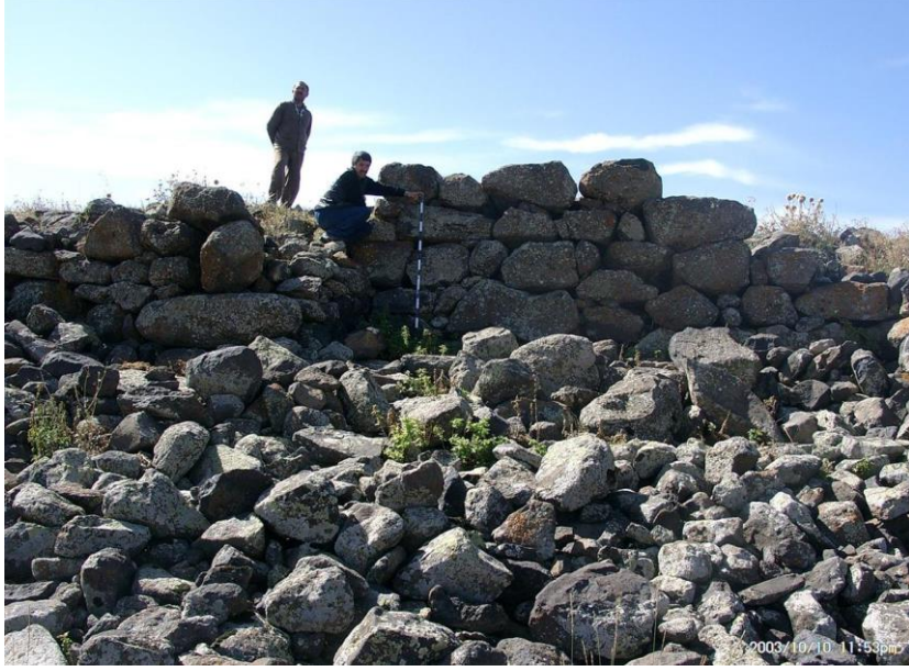
Fotograf 3. Polat Kalesi