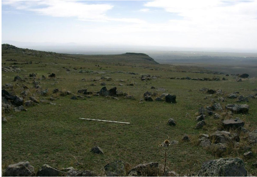
Fotograf 4. Yarbaşı Yerleşmesi