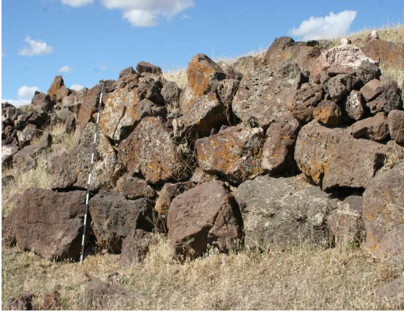
Fotograf 7. Ziyarettepe Kalesi