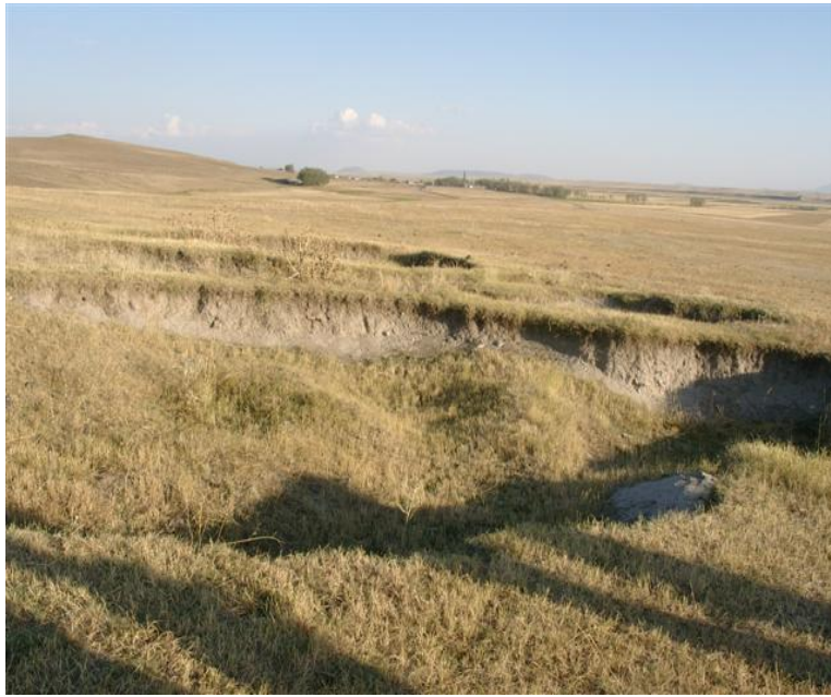
Fotograf 6. Tepecik Yerleşmesi