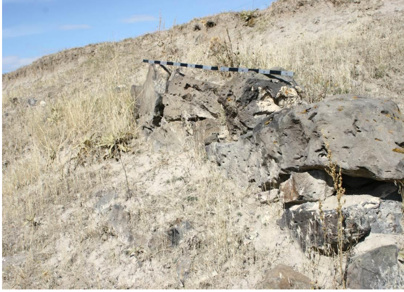
Fotograf 9. Yarüstü Yerleşmesi