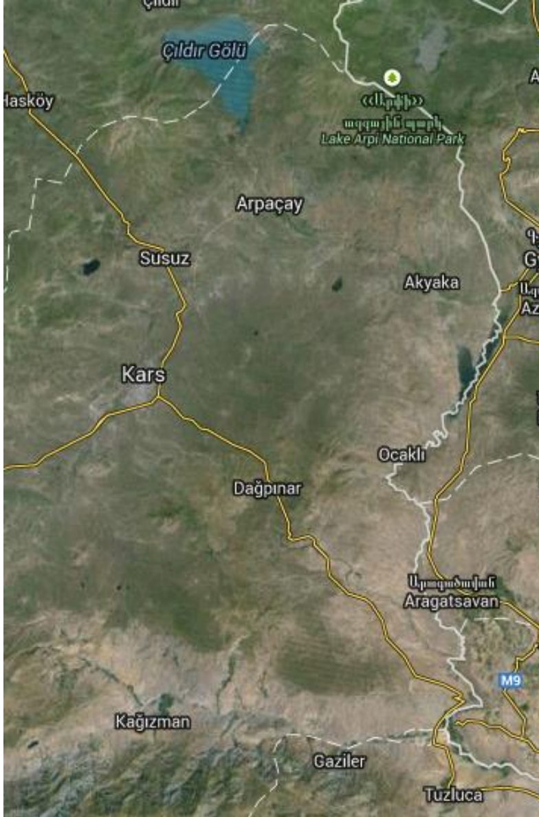
Harita 2. Arpaçay Havzası