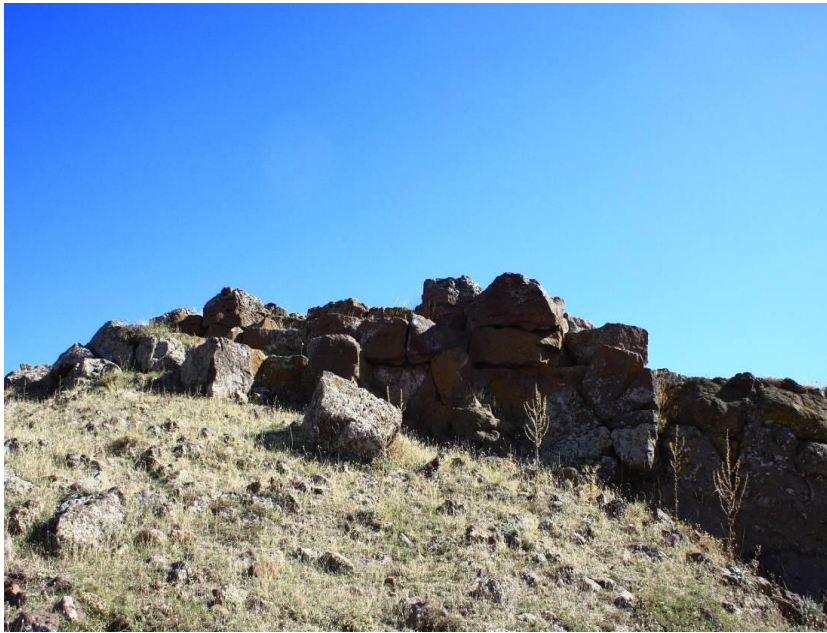
Fotograf 8. Angut Kalesi