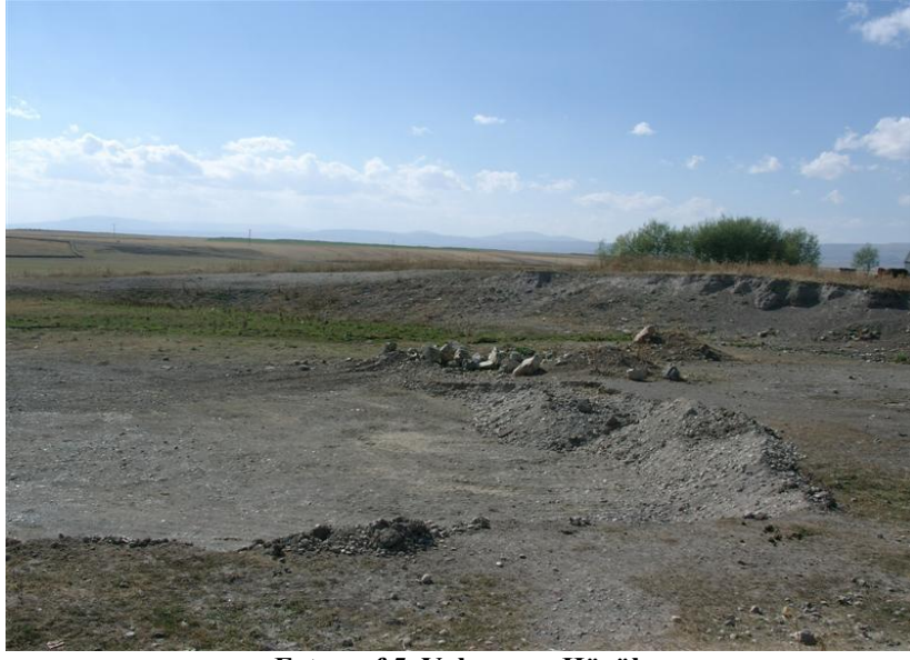
Fotograf 5. Yalınçayır Höyük