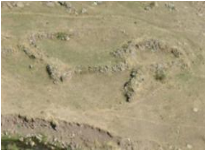
Fotograf 2. Carcı Yerleşmesi