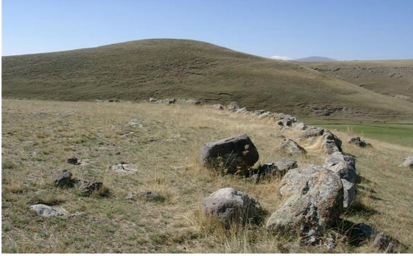
Fotograf 1.Zöhrap Yerleşmesi