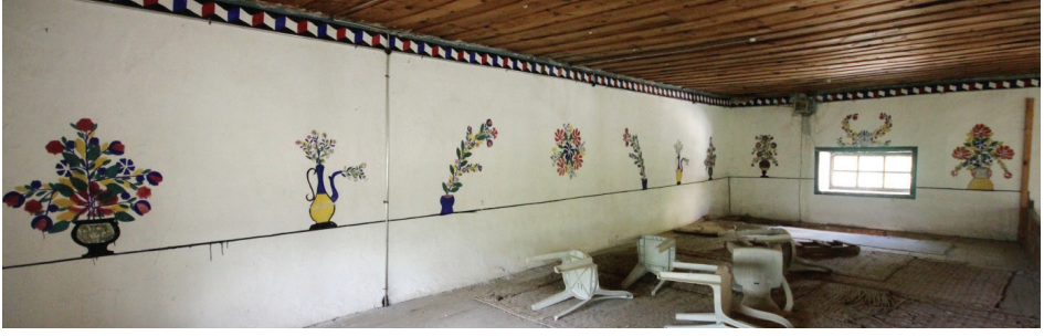
Görsel 25: Kuzey Duvarı Üst Seviye Genel Görünüşü

Mihrap ile batıdaki pencere arasında dikey dikdörtgen panoda çok renkli bir cami tasvirine yer verilmiştir (Görsel 24). Yüksek tek kubbeli olduğu anlaşılan cami kademeli olarak alçalmaktadır. Beş minareli olması dikkat çeken camide, öndeki kubbeli mekân son cemaat yeri, ana kubbenin arkasından seçilen kule de altıncı minare olmalıdır. Kubbe ve minareler âlemlerle sonlanmaktadır. Önünde çiçekli ve ağaçlı geniş bir bahçesi bulunan camiye merdivenlerle çıkılmaktadır.