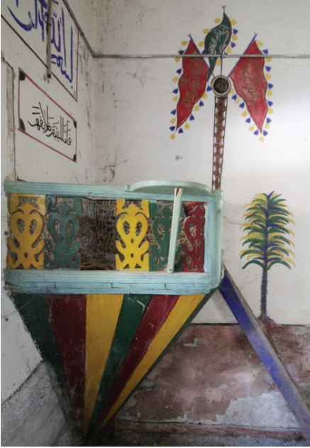
Görsel 21: Güney Duvarı Sancak Motifi

Güney duvarında vaiz kürsüsünün köşesinden bir sancak motifi yukarı doğru uzanmaktadır (Görsel 20-21). Kahverengi geometrik süslemeli direğin ucundaki sancağın bir daireden çıkan üç kolu bulunmaktadır. İki yandaki kırmızı sancaklardan güneydekinde Besmele, kuzeydekinde Kelime-i Tevhid, ortadaki yeşil sancakta “Fatiha Suresi’nin 2. Ayeti” yazılıdır. Sancakların etrafından sarı, mavi püsküller sarmaktadır. Sancakla pencere arasında vaiz kürsüsü hizasında bir kiraz ağacı motifine yer verilmiştir. Güney duvarında doğudaki pencere ile mihrap arasında, Kâbe tasvirli bir pano yerleştirilmiştir (Görsel 22). Çerçevesiz dikdörtgen panoda mavi revaklı sarı zeminli geniş avlunun ortasında siyah örtülü Kâbe iki yanında da birer minber yer almaktadır. Avluda revaklardan Kâbe’ye dört yönde yollar uzanmaktadır. Avluda çok silik şekilde Türkçe olarak “Mekkenen Kâbe-i Şerif” yazısı okunabilmektedir. Avlunun etrafında minareler, kapı ve pencereler görülebilmektedir. Avlunun dışındaki zemin siyah renge boyanmıştır. Kâbe tasvirinin üst kısmında “Allah” lafzıyla oluşturulmuş bir ibrik motifi yer almaktadır. Sancak ve ibrik motifi ile alt ve üstten iki pencere arasında denk gelecek şekilde yerleştirilmiş sarı zeminli dikdörtgen bir pano içerisine “Levlake levlak lema halaktul eflak” hadisi yazılmıştır.