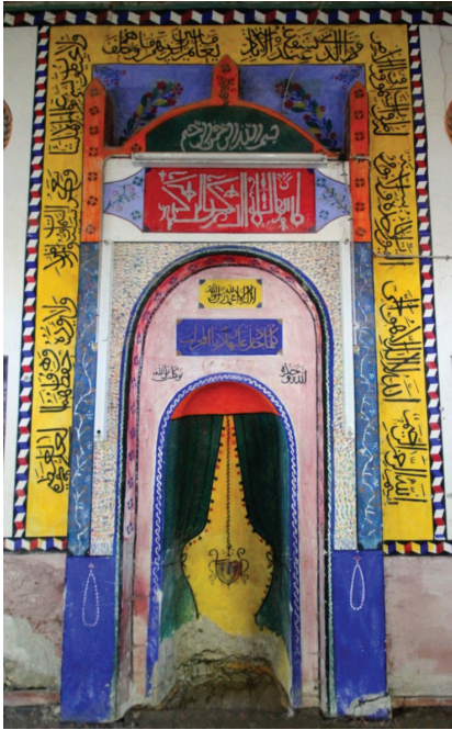
Görsel 23: Güney Duvarı. Mihrap