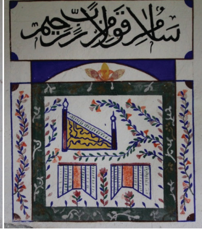
Grsel 19: Dođu Duvarı Cami Tasviri