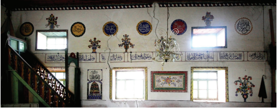
Grsel 13: Batı Duvarı Genel Grnř

yuvarlak kemerli kapı yerleřtirilmiřtir. Cennet tasvirinin kemerinin st kısmına bitiřik dikdrtgen panoda “Besmele ve Fetih Suresi’nin 1. ayeti” yazılıdır. Gneyden ikinci ve çnc pencerelerin arasında yatay dikdrtgen bir halı motifi grlebilmektedir (Grsel 15). Beyaz zemin zerine eksende byk bir iek motifi ve křelerde karanfil motifinden oluřan halı, iki ince iki kalın drt bordrle evrelenmiřtir. İten birinci sarı ve çnc kırmızı renkli ince bordrler sade, ikinci yeřil renkli bordr geometrik motifli ve en dıřtaki drdnc bordr kırmızı ieklidir. Halının kısa iki yanından saaklar sarmaktadır. çnc pencere ile mezzin odası arasına vazodan ıkan iek motifleri ve bir am aęacı motifi yerleřtirilmiřtir. Batı duvarında mahfilin alt kısmında iki byk vazodan ıkan iek motifi ile bir am aęacı motifi sonradan yapılan boyalar altında kaldıęından belli belirsizdir.