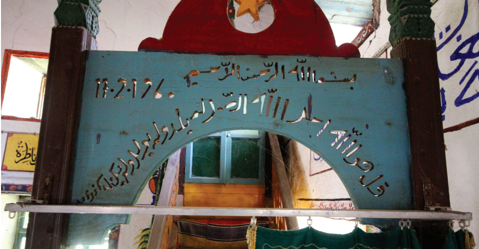
Görsel 6: Güzelyurt Tahtalı Köyü Camii minber kitabesi