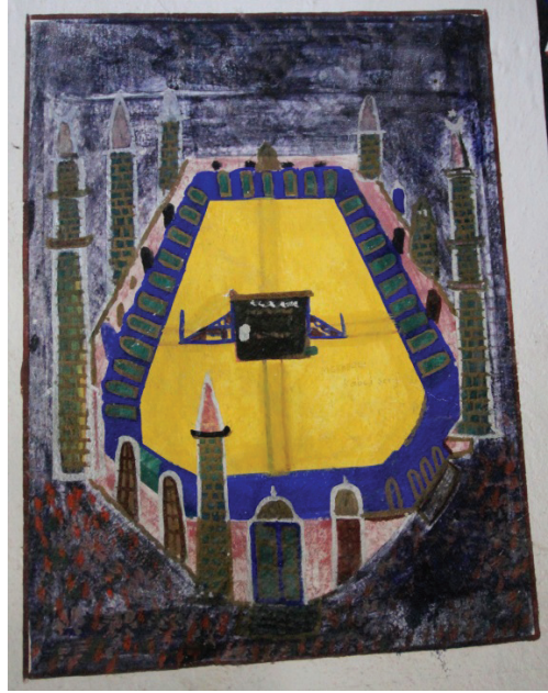
Görsel 22: Güney Duvarı Kâbe Tasviri

Güney duvarının ekseninde yer alan mihrabı dıştan Besmele ve Ayet-el Kürsi’nin yazılı olduğu sarı zeminli ayet kuşağı çevrelemektedir. Bir bütün olarak dışa taşırılan mihrap yuvarlak kemerli derin olmayan bir eyvan şeklinde de girinti yapmaktadır (Görsel 23). Dışa taşıntılı kısım ayet kuşağının iç kısmında ayrı bir kuşak olarak