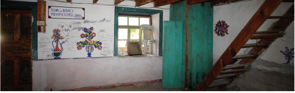
Görsel 16: Harim Mekânı Kuzey Duvarı Genel Görünüşü

sarı, kırmızı, mavi, yeşil, beyaz renklerin kullanıldığı bir ibrik ve bir vazodan çiçekler çıkmaktadır. Bu motiflerin üst kısmında siyah bir çerçeve içerisinde mavi renkle usta ismi yazılıdır (Görsel 16).