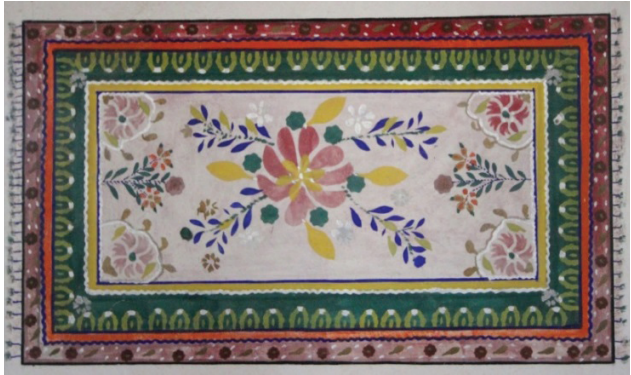
Grsel 15: Batı Duvarı Halı Motifi

Kuzey duvarında alt seviyede batıdan ilk motif ince uzun gvdeli ve bol yapraklı bir aęaç motifidir. Pencere ile ana giriř kapısı arasında byk bir vazodan ıkan iekler, sıvaların altından zorlukla seilebilmektedir. Kapının doęusu ile pencere arasında