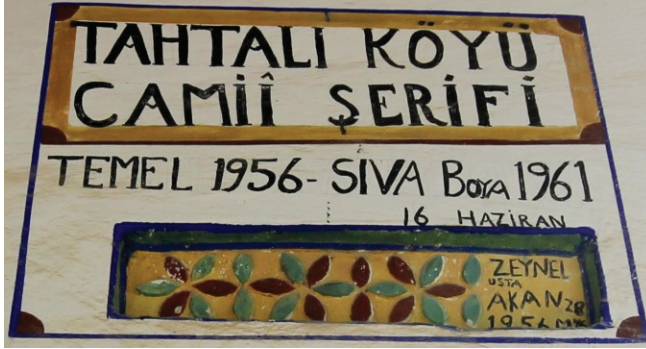
Grsel 1. ameli Gzelyurt Tahtalı Ky Camii. Kitabe 1

D enizli il merkezinin yaklařık 70 km gneyinde ameli İlesi'nin Gzelyurt Mahallesi'nde bulunan Tahtalı Ky Camii'nin inřa ve sslemelerini belirten kitabesi son cemaat yeri gney duvarının batısında st křede bulunan bir panoda yer almaktadır. Yatay olarak ikiye ayrılmıř kareye yakın dikdrtgen panonun st kısmında Trke olarak "Tahtalı Ky Camii řerifi", alt kısmında "Temel 1956- Sıva Boya 1961" alt sırada ise "16 Haziran" okunmaktadır (Grsel 1).