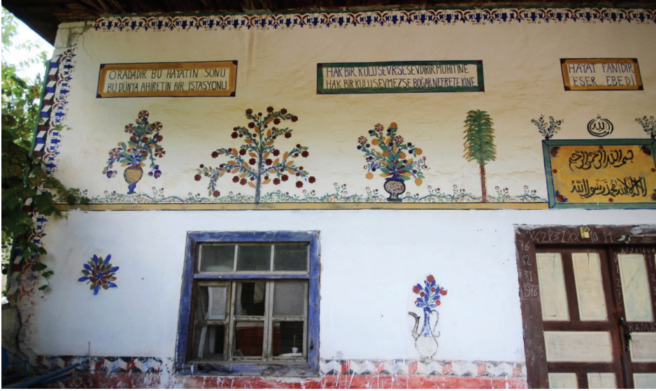
Görsel 8: Son Cemaat Yeri Güney Cephe Detayı 1

istasyonu”, ikinci panoda “Hak bir kulu severse sevdiren muhitine Hak bir kulu sevmezse boğar nefrete kine”, üçüncü panoda “Hayat fanidir Eser Ebedi”, dördüncü panoda “Akıl gibi mal İyi huy gibi dost, Edep gibi miras Teğfik gibi rehber, İlim gibi şeref bulunmaz” yazılıdır (Görsel 9).