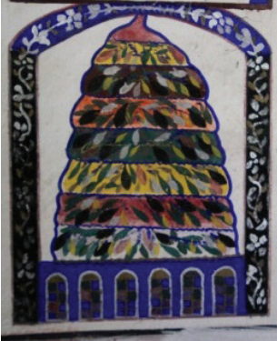
Grsel 14: Batı Duvarı Cennet Motifi