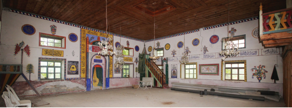
Görsel 12: Güney ve Batı Duvarı Genel Görünüşü

Eksendeki çift kanatlı kapıdan girilen harim mekânının tüm duvarları bezelidir (Görsel 10-11-12). Batı duvarında güneyden ilk pencereyi yeri değiştirilen minber kapatmaktadır. İlk ve ikinci pencere arasında bir cennet tasviri yer almaktadır (Görsel 13-14). Tasviri çevreleyen yuvarlak kemerli mavi, siyah çerçevenin içinde yukarı doğru daralan beyaz, sarı, kırmızı, yeşil sekiz basamak yapraklarla bezenmiş, alta altı adet