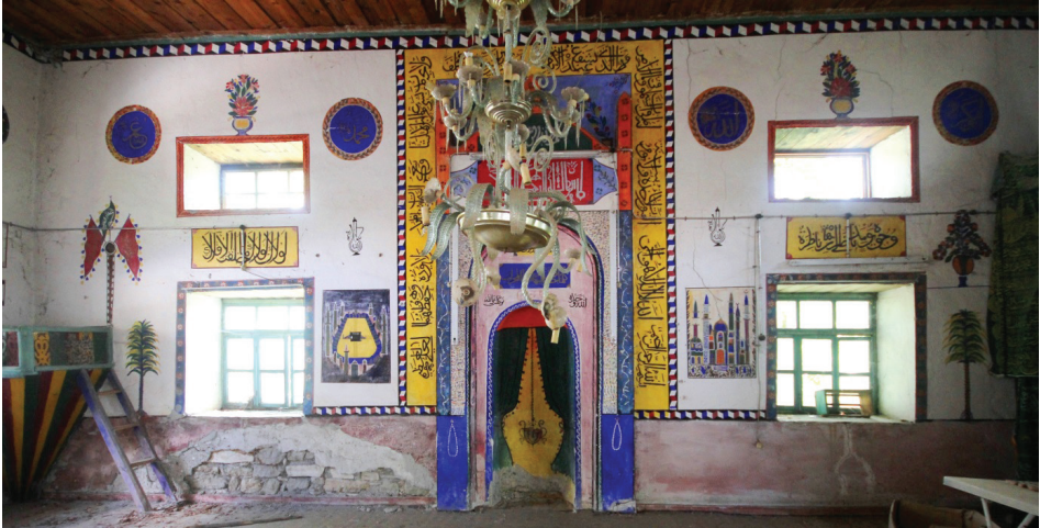
Grsel 20: Harim Mekni Gney Duvarı Genel Grnř