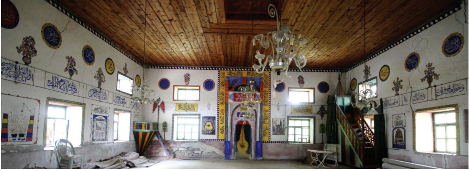
Görsel 11: Harim Mekânı Genel Görünüşü 2