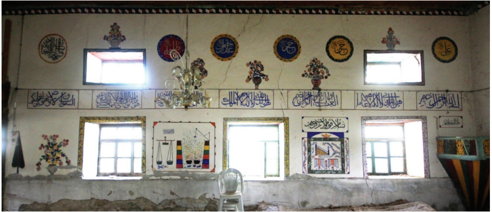
Görsel 17: Harim Mekânı Doğu Duvarı Genel Görünüşü

Doğu duvarında alt hizada duvara bitştirilmiş mahfil merdivenlerinin üst kısmında duvara yapılmış kırmızı, yeşil, mavi renklerin kullanıldığı güller ve yapraklar daire şeklinde büyük bir çiçek motifi oluşturmaktadır. Bu motif, kuzey cephede alt seviyede iki yandaki çiçek motiflerine benzemektedir. Merdivenin alt kısmında sıvaları döküldüğünden gövdesinin büyük kısmı kaybolmuş küçük bir ibrikten çıkan çiçek motifleri bulunmaktadır. Duvarda kuzeyden birinci ve ikinci pencere arasına bir çam ağacı motifi ve desenli bir vazodan çıkan renkli yapraklı kırmızı karanfil, gül ve çiçekler görülmektedir. İkinci ve üçüncü pencerelerin arasında tek bir panoya yer verilmiştir. Bu dikdörtgen panoda cehennem tasviri, yukarıya doğru daralan iki yandaki renkli altı basamak arasında kaynayan ve etrafa ateşler saçan iki kazan ile yukarıdan kazanlara doğru sarkan bir zincir şeklindedir. Aynı panoda cehennem tasvirinin kuzeyinde mizan terazisi, terazinin üzerinde Kelime-i Tevhid yazısı ve altında da makas motifi yer almaktadır (Görsel 17-18).