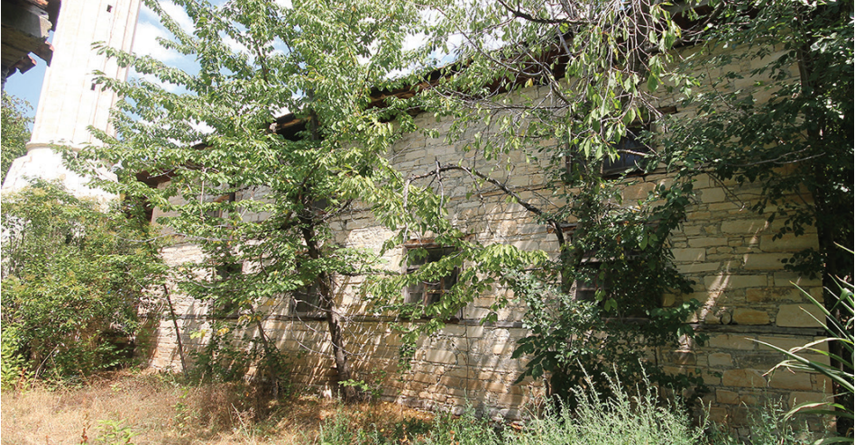
Görsel 4: Güzelyurt Tahtalı Köyü Camii. Batı Ceph

batısında kalan alt kısmı kapatılarak müezzin odasına dönüştürülmüştür. Caminin kuzey-doğu köşesinde ahşap bir dolap ve mahfile çıkışı sağlayan merdivenlere yer verilmiştir.