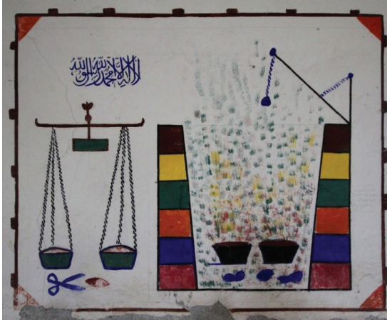
Grsel 18: Dođu Duvarı Cehennem Tasviri

Dođu duvarında alt hizada çnc ve drdnc pencere arasında yeşil kare çerçevesi bir pano ierisinde beyaz zemin zerine stte minber, altta biri giriř kapısı diđeri mihrabı sembolize etmesi gereken iki imgeye yer verilmiřtir. Cami izlenimi vermek iin yukarıdan panoyu, dıřı mavi ii beyaz basık bir yarım daire evrelemektedir. Panoda boş kalan yerler kıvrık dal, yaprak ve kk ieklerle doldurulmuřtur. Panoyu dıř iki yandan da kıvrık dallar sınırlandırmaktadır. Panonun st kısmına bitiřtirilmiř dikdrtgen panoda ise “Yasin Suresi’nin 58. Ayeti” yazılıdır. Gneydođu kşedeki vaiz krssnn st kısmına dođu duvarında “Duha Suresi’nin 9. Ayeti” okunabilmektedir. Aħřap vaiz krss okgen izlenimi verecek řekilde yeşil, kırmızı ve sarı renklere boyanmıřtır. Krssnn korkuluk kısmı ajur tekniđinde aħřap sslemelere sahiptir (Grsel 19).