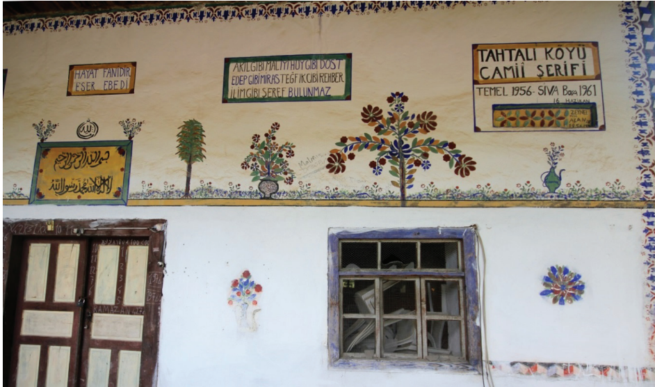
Görsel 9: Son Cemaat Yeri Güney Cephe Detayı 2