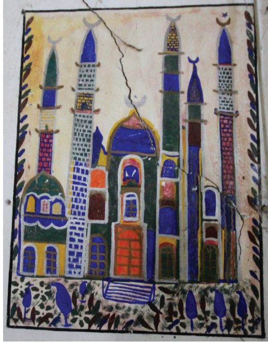
Görsel 24: Güney Duvarı Cami Tasviri