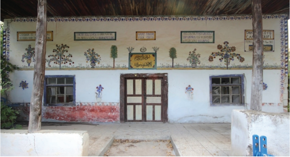
Görsel 7: Güzelyurt Tahtalı Köyü Camii Son Cemaat Yeri

Caminin son cemaat yeri güney duvarını iki silme dolaşmaktadır. Siyah zeminli kırmızı-beyaz ve mavi renkli zikzak motifli dıştaki ilk silme, cepheyi iki yandan sınırlamakta ve pencerelerin alt hizasından başlayan süslemelere zemin teşkil etmektedir. Kırmızı yapraklar ve mavi palmetlerden oluşan içteki ikinci silme, cepheyi iki yandan ve üstten kuşatmaktadır. Harime giriş kapısı ile iki yandaki pencereler arasında ibrikten çıkan mavi dallar ve kırmızı çiçekler yerleştirilmiştir. Pencerelerin iki dış kenarına kırmızı, mavi ve yeşil renkli büyük bir çiçek motifi yapılmıştır (Görsel 7).