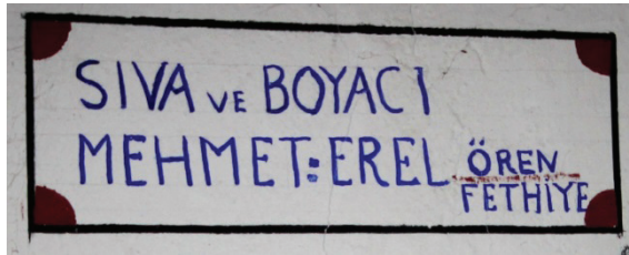
Grsel 2. ameli Gzelyurt Tahtalı Ky Camii. Kitabe 2