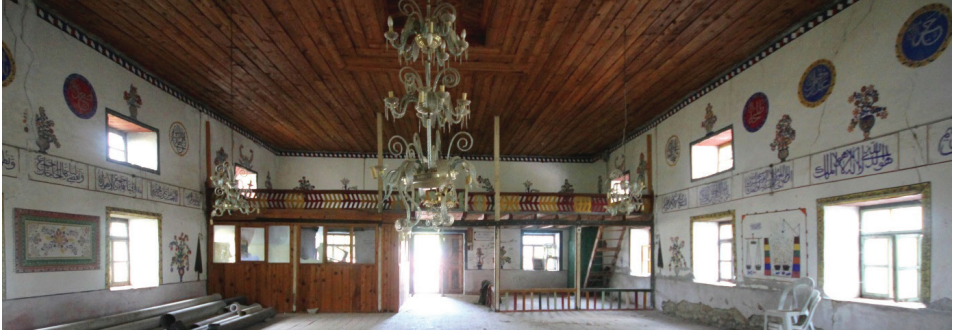
Görsel 10: Harim Mekânı Genel Görünüşü 1