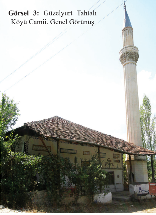
Görsel 3: Güzelyurt Tahtalı Köyü Camii. Genel Görünüş

Dıştan doğu ve batı cephelerde alt seviyede dört, üst seviyede üç pencereye yer verilmiştir (Görsel 4). Güney cephede her iki seviyede iki, kuzey cephede giriş kapısının iki yanına yerleştirilmiş birer pencere bulunmaktadır. Alt seviyedeki pencereler kareye yakın dikdörtgen, üst seviyedeki pencereler yatay dikdörtgen formdadır. Ahşap hatıllı moloz taş malzemeden yapılmış caminin sadece kuzey cephesi sıvalıdır. Cami kiremit kaplı dört eğimli kırma çatı ile örtülüdür.