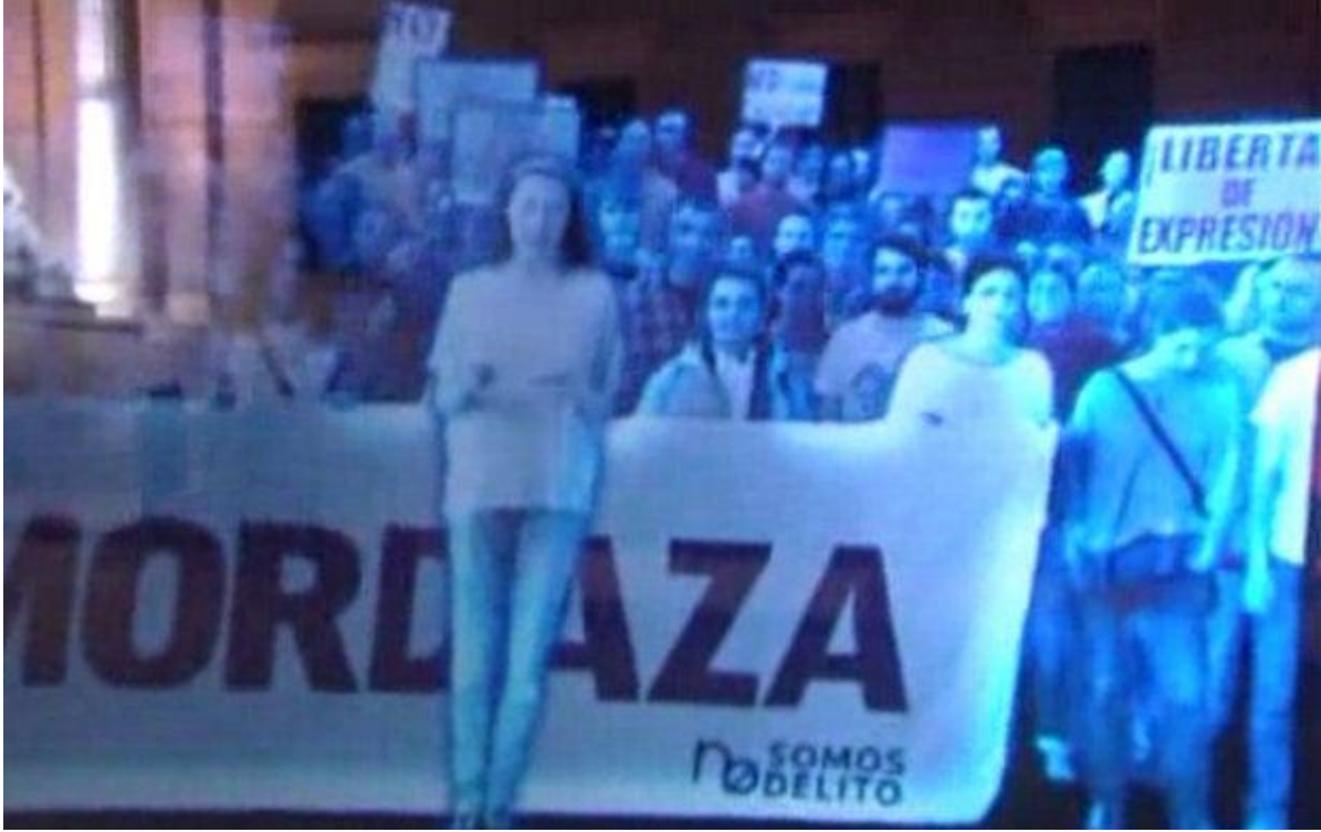
Resim 4: No Somos Delito platformu sözcüsünün okuduğu basın açıklaması

bakıldığında ise eylemin veya eyleyişin simülasyon haline getirilmesi durumu daha net gözlemlenebilmektedir. Zira görsel olarak binlerce protestocu Parlamento binasının önünde yürümüştür. Olayın kendisi imgeler ve semboller aracılığı ile simüle edilmeden önce; teknolojinin kullanımı ile holografik birer kopyaya (tabiri caizse 'hayaletlere') dönüştürülmüş, bilgisayar ortamında kurgulanmıştır. Böylelikle simüle edilmiş imgeler üzerinden kamuoyuna yansıyan bir simülasyon eylem yaratılmıştır.