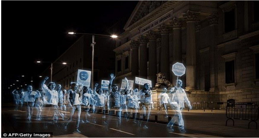
Resim 2: Önceden kaydedilen hologramlar, parlamento binası önünde yürüyüş yapmakta.

Hologramas por la Libertad sitesinde ziyaretçilere, eyleme katılma ve avaa.org üzerinden yürütülen imza kampanyasına katkıda bulunma çağrısı yapılmıştır. Katılımcılara siteye, hologram eylem esnasında kullanılması amacıyla yazılı mesajlarını, sesli mesajlarını (sloganlarını) ya da görüntülerini yükleyerek eyleme katılım sağlayabilmeleri imkanı tanınmıştır. Söz konusu yüklemeler eylemden önce bir araya getirilmiş ve kurgulanmıştır. Eylemde bir temel olarak kullanılmak üzere 50 'gerçek' katılımcı (No Somos Delito, STK aktivistleri ve gönüllü bireylerden), 6 Nisan 2015 tarihinde Madrid yakınlarında bir kasabada, film yapımcısı Esteban Crespo tarafından eylem yürüyüşü yaparken filme alınmıştır. Alınan görüntüler, siteye yüklenen yazılı/sözlü mesajlar ve katılımcıların görüntüleri ile birlikte kurgulanmıştır. Eyleme toplamda 17.000'den fazla katılımcı iştirak etmiştir (Escobar-Lopez, 2015: 9-10). Eylem yaklaşık olarak 300.000 Euro'ya mal olmuştur, işçilik, ekipman ve teknik destek de dahil olmak üzere tüm giderler medya profesyonelleri tarafından karşılanmıştır, STK olan No Somos Delito Platformu açısından bir maliyeti olmamıştır (Wood ve Flesher Fominaya, 2015: 147).