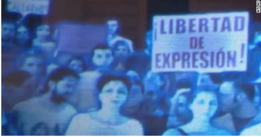
Resim 5: "İfade Özgürlüğü!" döviz

hologramları aracılığı ile olsa dahi, 'bir araya' gelerek eylem yapmalarına olanak tanımıştır. Eylem bu özelliğiyle yapıldığı itibarıyla biriciktir.