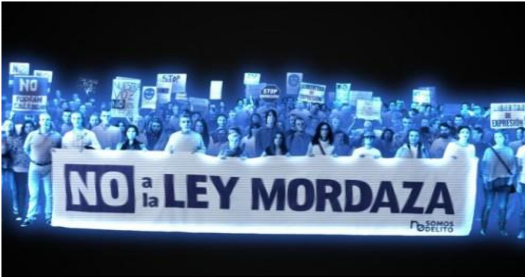
Resim 3: "Konuşma Özgürlüğünü Kısıtlayan Yasaya Hayır" yazılı pankartın ardında yürüyen "hayalet" eylemciler.