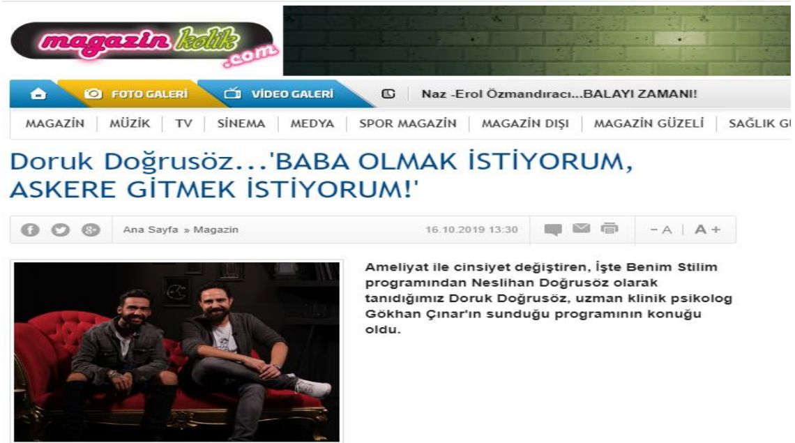
Resim 2. Magazinkolik.com, 16 Ekim 2019

Kaynak: http://gzone.com.tr/doruk-dogruso-z-baba-olmak-istiyorum/