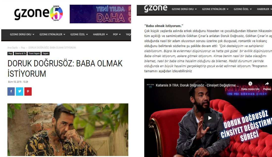
Resim 1. Gzone, 18 Ekim 2019