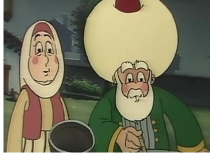
2. Şekil 10: Nasreddin Hoca - ? (5 no.lu) Çizgi Filminden Bir Kare (URL 7)

4 no.lu çizgi filmde dönem özelliklerini yansıtan görsel imgeler, kullanılmaktadır. Çizgi film incelendiğinde Hoca, hanımı, eşiği ve halktan kişiler çizgi filmde yer verilen tipler olarak karşımıza çıkmaktadır. Nasreddin Hoca'nın diğer çizgi filmlerden farklı olarak klasik tasvirinden kısmen farklı şekilde sunulduğu görülmektedir. Çizgi filmde dikkat çeken bir nokta da Hoca'nın Timur'la çeşitli sahnelerde karşımıza çıkmasıdır. Çizgi filmde yer verilen fıkralar incelendiğinde fıkraların var olduğu şekliyle senaryoya aktarıldığı, herhangi bir dönüşüme uğramadığı anlaşılmaktadır. Bu bulgular, Hoca'nın tip olarak kısmen dönüşüme uğradığı fakat fıkralarının dönüşüme uğramadan sunulduğu şeklinde yorumlanabilir.