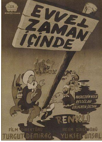
Şekil 1: Evvel Zaman İçinde Çizgi Filminin Afişi (URL1)

Nasreddin Hoca ilk kez 1951 yılında yapılan “Evvel Zaman İçinde” isimli çizgi filmle karşımıza çıkmaktadır. Çizgi filmin hazırlanmasında ciddi bir çaba harcanmış, 40 kişilik bir ekip tarafından bu proje yürütülmüştür. Bu çizgi film, yapımcısının ve sahibinin Turgut Demirağ olduğu “AND Film” şirketince Yüksel Ünsal’a yaptırılmıştır. Çizgi film, geleneksel animasyon olarak da isimlendirilen hücre animasyonu tekniğiyle hazırlanmıştır. Çizgi film üç bölümden oluşmaktadır: Nasreddin Hoca, Keloğlan ve Güldüren Sultan (Uçan 2018: 1137).