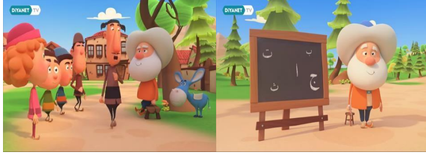
Şekil 14: Şeker Hoca - 2016 (7 no.lu) Çizgi Filminden Bir Kare (URL 10)

7 no.lu çizgi filmde Hoca bulunduğu dönem itibariyle seyirci ile sunulmakta; eşeği, hanımı, çocuğuyla karşımıza çıkmaktadır. Diğer tipler incelendiğinde giyimi, konuşması Karadeniz bölgesine ait olduğu düşünülen Laz Cemal isminde bir tip dikkat çekmektedir. Diğer bir dikkat çeken tip ise doktor rolünde olan Lokman Hekim'dir. Hoca bu çizgi filmde ahalinin problemlerine akılcı çözümler üretmekte, sorularına hazır cevaplılıkla karşılık vermektedir.