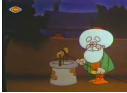
Şekil 8: Nasreddin Hoca - 1990 (3 no.lu) Çizgi Filminden Bir Kare (URL 5)