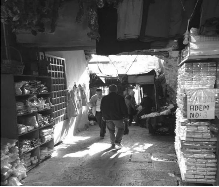
Resim I. Suluhan'dan Hacı Dođan Mahallesi'ne Açılan Kapı

Hasan Paşa vakıflarından olan ve önceki adı Hasan Paşa Hanı olarak geçen Suluhan, araştırma konumuz olan Hacı Dođan Mahallesi'nde bulunan İbadullah Camiinin yanında yer almaktadır ve Vakıflar Genel Müdürlüğü tarafından restore edilmiştir. 1