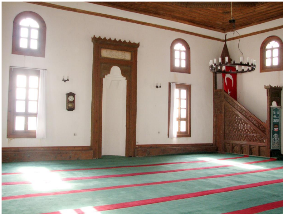
Fotoğraf 9. İsabey Camii. Harimin Güney Duvarı (09.02.2019).

Harimin doğu ve batı duvarlarında alt kotta üçer, üst kotta ise ikişer pencere, güney duvarında da alt ve üst kotta ikişer pencere açıklığına yer verilmiştir. Alt sıra pencereleri boyuna dikdörtgen, üst sıra pencereleri ise yarım yuvarlak kemerlidir. Alt ve üst sıra pencerelerinin pervazları ve doğramaları ahşaptır.