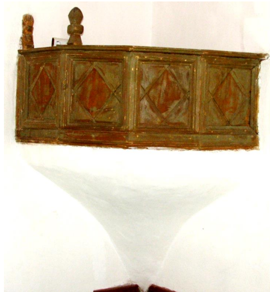
Fotoğraf 12. İsabey Camii. Vaaz Kürsüsü (09.02.2019).