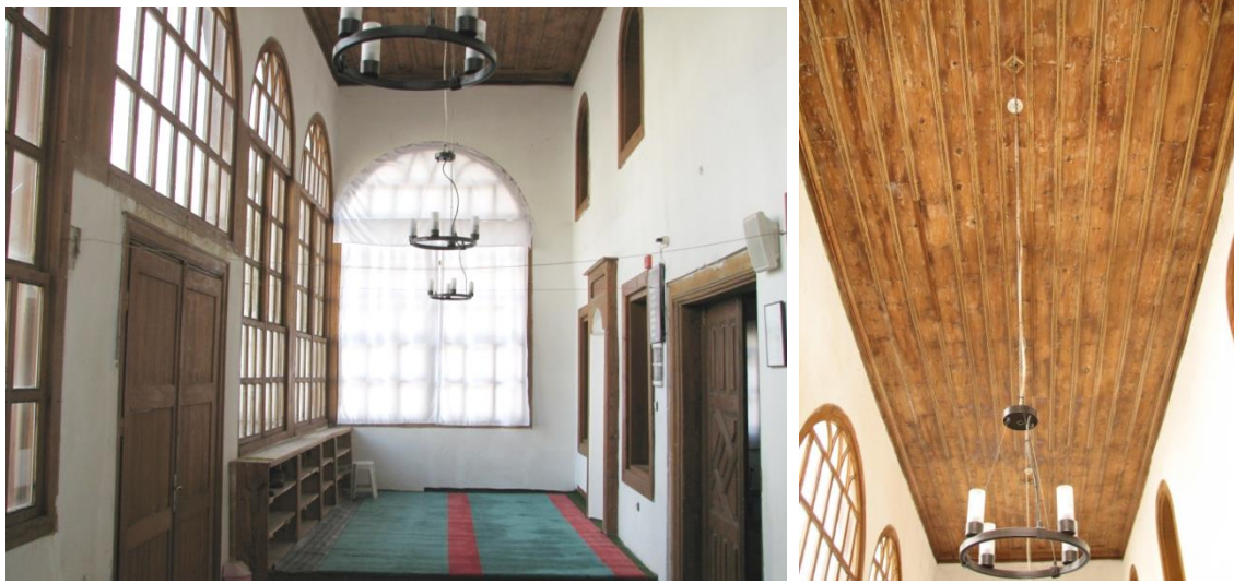
Fotoğraf 4-5. İsabey Camii. Son Cemaat Yeri (09.02.2019).

Son cemaat yerinin güney duvarı simetriktir. Ortada harime girişi sağlayan kapı, kapının iki yanında ise aralarında birer dış mihrap bulunan ikili pencere sistemi yer almaktadır. Dikdörtgen formlu giriş açıklığı, iki kanatlı ahşap kapı kanatlarına sahiptir. Kapının geometrik süslemeleri künde-kari tekniğindedir. Alt kottaki iki pencerenin ve üst kotta yer alan pencerelerin doğramaları ve ahşap pervazları yenilenmiştir. Yarım daire formlu dış mihraplar birer yuvarlak kemerli kavsara ile örtülüdür. Duvar yüzeyinden taşıntı yapan mihrap çerçeveleri ahşap doğramalarla kaplanmıştır. Mihraplarda herhangi bir bezeme öğesi yoktur.