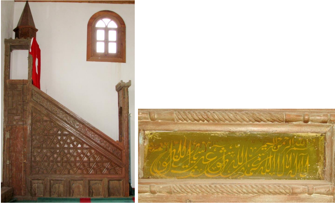
Fotoğraf 10-11. İsabey Camii. Minber (09.02.2019).

Harimin güneydoğu köşesinde yer alan vaaz kürsünün ahşap korkulukları dört bölmeye ayrılmıştır. Her bölme silmelerle kare şeklinde kademelendirilmiştir. Kare kartuşların içerisine de eşkenar dörtgenler/baklava motifleri yerleştirilmiştir. Yeşil ve kahverengi renklerle boyanan mahfilin kapısının üzerinde, iki tane de babası vardır.