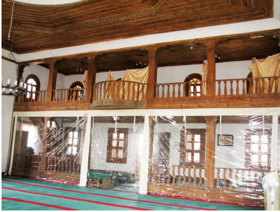
Fotoğraf 8. İsabey Camii. Harimin Kuzey Duvarı ve Kadınlar Mahfili (09.02.2019).

Harimin doğu ve batı duvarlarında alt kotta üçer, üst kotta ise ikişer pencere, güney duvarında da alt ve üst kotta ikişer pencere açıklığına yer verilmiştir. Alt sıra pencereleri boyuna dikdörtgen, üst sıra pencereleri ise yarım yuvarlak kemerlidir. Alt ve üst sıra pencerelerinin pervazları ve doğramaları ahşaptır.