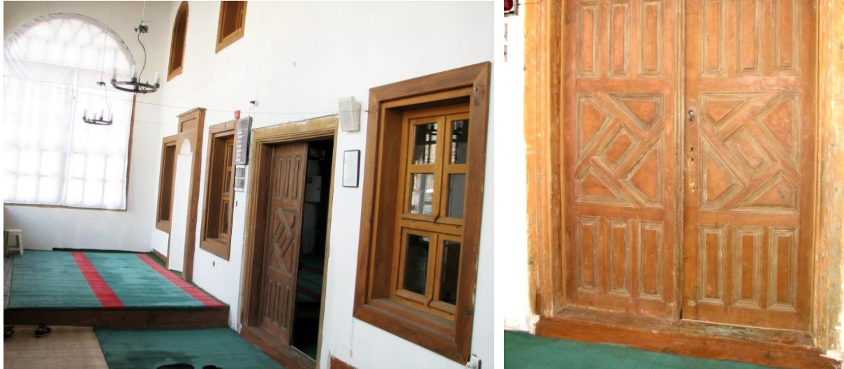
Fotoğraf 6-7. İsabey Camii. Son Cemaat Yeri ve Harim Girişi (09.02.2019).

Son cemaat yerinin güney duvarı simetriktir. Ortada harime girişi sağlayan kapı, kapının iki yanında ise aralarında birer dış mihrap bulunan ikili pencere sistemi yer almaktadır. Dikdörtgen formlu giriş açıklığı, iki kanatlı ahşap kapı kanatlarına sahiptir. Kapının geometrik süslemeleri künde-kari tekniğindedir. Alt kottaki iki pencerenin ve üst kotta yer alan pencerelerin doğramaları ve ahşap pervazları yenilenmiştir. Yarım daire formlu dış mihraplar birer yuvarlak kemerli kavsara ile örtülüdür. Duvar yüzeyinden taşıntı yapan mihrap çerçeveleri ahşap doğramalarla kaplanmıştır. Mihraplarda herhangi bir bezeme öğesi yoktur.