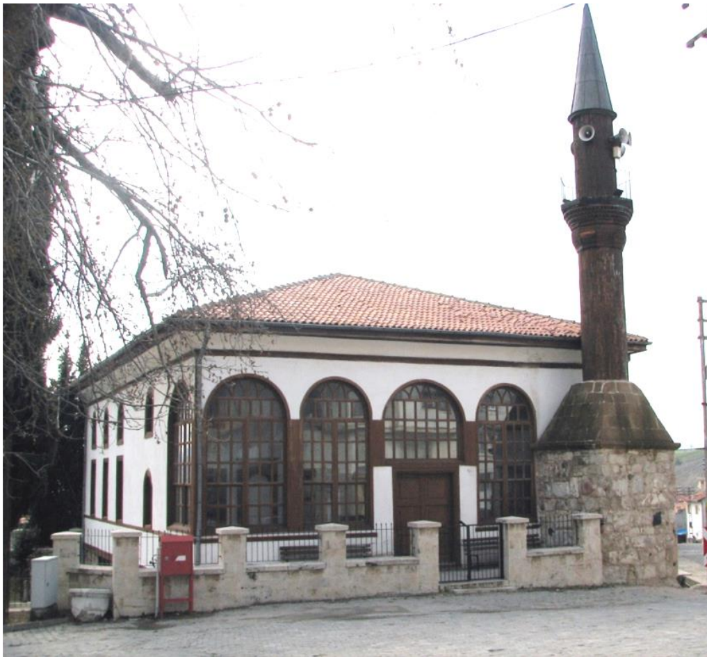
Fotoğraf 1-3. İsabey Camii. Kuzeybatı, Doğu ve Kuzey Cephe (09.02.2019).

Son cemaat yeri kuzey cepheden dışarıya dört kemer gözü ile açılmaktadır. Ahşap desteklerle taşınan kemerlerin şekli yarım yuvarlaktır. Kemer gözleri camekanlarla kapatılmıştır. Son cemaat yerinin doğu ve batı duvarları da büyük boyutlu birer pencere ile dışarı açılmaktadır. Neredeyse tüm duvarı kaplayan pencereler de yarım yuvarlak kemerlidir. Son cemaat yeri çıtalı ahşap tavan ile örtülmüştür. Son cemaat yerinin giriş aksı dışında kalan doğu ve batı kısımları sekilerle yükseltilmiştir.