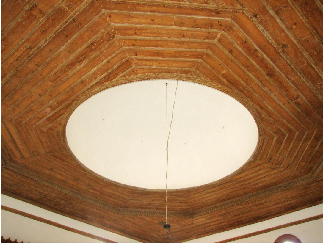
Fotoėraf 13. İsabey Camii. Harimin Ahşap Tavanı ve Baėdadi Kubbesi (09.02.2019).

İsabey Camii'nde harim ıtalı dz ahşap tavan ile rtldr. Tavan nce kare sonra sekizgen bir okertme ile kademelendirilmiř ve merkeze de baėdadi bir kubbe yerleřtirilmiřtir. Kubbenin ii sıvanmıř ve kire badana ile boyanmıřtır.