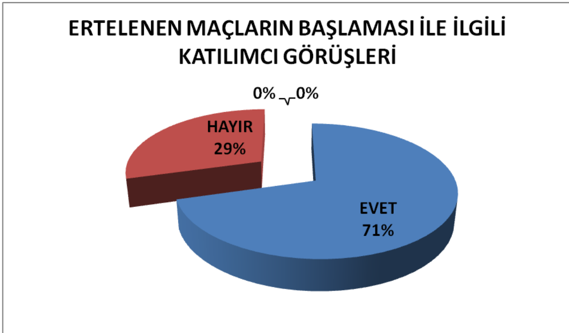
Şekil 1. Katılımcıların Maçların Başlaması İle İlgili Görüşleri

Maçların başlaması ile ilgili profesyonel futbolcuların görüşleri değerlendirildiğinde; futbolcuların 12'sinin (%71) Evet Başlasın, 5'inin (%29) Hayır Başlamasını yönünde görüş bildirdikleri görülmüştür.