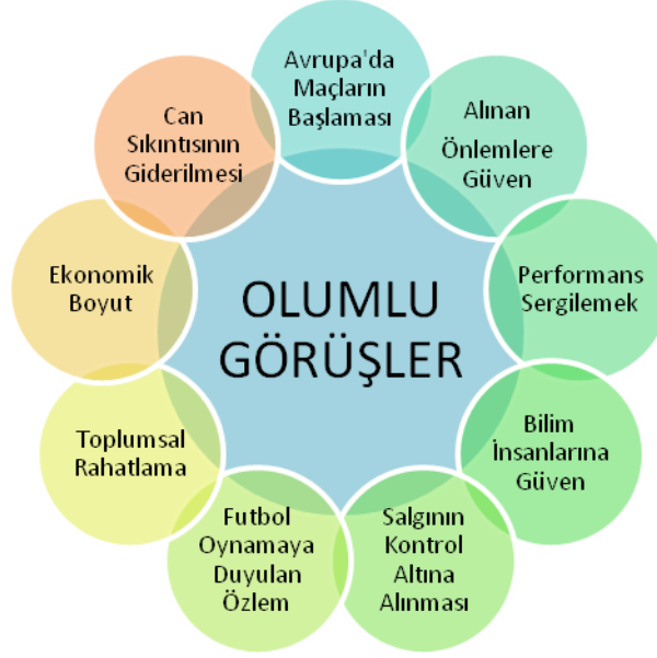
Şekil 4. Profesyonel Futbolcuların Ertelenen Maçların Başlaması İle İlgili Olumlu Görüşlere Ait Kodlar

Profesyonel futbolcuların maçların başlamasına ilişkin olumlu görüşleri değerlendirildiğinde, Avrupa'daki maçların başlaması, Federasyon ve yetkililer tarafından alınan önlemlere ve bilim insanlarına olan güven, bireysel ve kulüpsel anlamda elde edilen ekonomik kazancın azalması, futbol oynamaya duyulan özlem, futbol aracılığı ile toplumsal rahatlamanın sağlanması, maçların oynanması ile performansın gösterilebilmesi ve buna bağlı olarak da önümüzdeki sezon transfer olabilme şansı, futbol sayesinde can sıkıntısının giderilmesi ve salgının kontrol altına alınmasına bağlı olarak futbolcuların olumlu görüşe sahip oldukları görülmektedir.