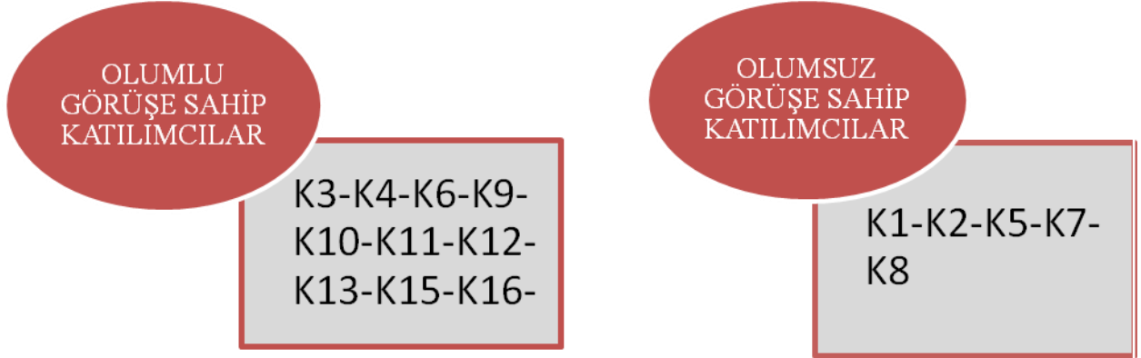
Şekil.3. Katılımcı Görüşlerine Göre Ertelenen Maçların Başlamasına Yönelik Olumlu Görüşlere Ait Temalar