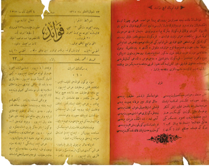
Resim 6. Murat Emri efendi'nin Fevâid'deki yazısı

sütun (?) edebiyatımıza derç-i tahrir edilmiştir.” (Resim:6)