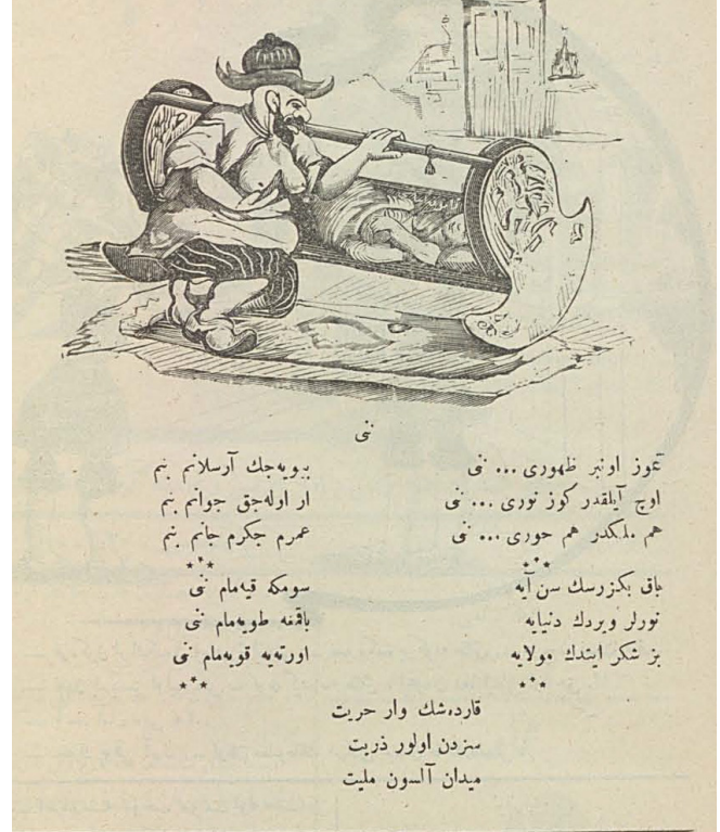
Resim 3. Karagöz Gazetesinde, II. Meşrutiyetin ilalını ile ilgili karikatür.

bilgi verilmiştir. Karagöz'ün isminin altında "Şimdilik pazartesi ve perşembe günleri neşr olunur musavvir eğlence gazetesidir." yazmaktadır.