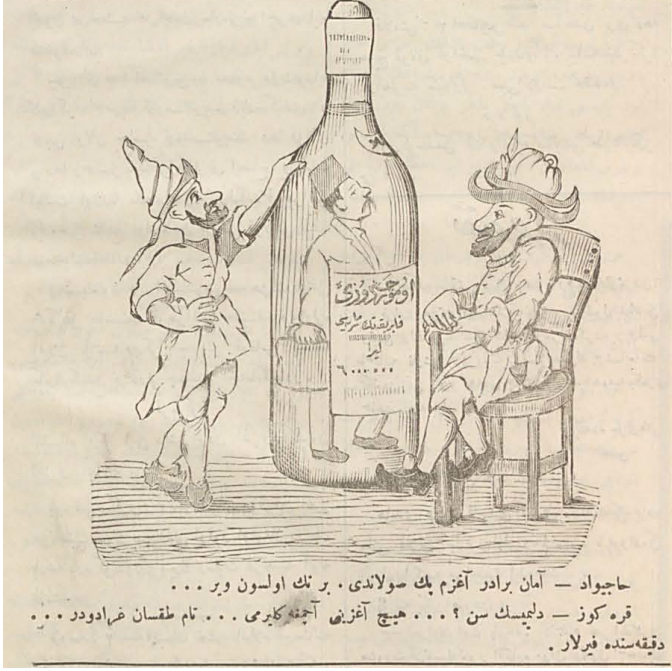
Resim 4. Şişedeki Adam, Karagöz Gazetesi, 1326.

Karagöz'ün karikatürleri son derece iğneleyici olmasına rağmen yayın hayatı boyunca iktidar ile yayın politikası arasında kayda değer bir çatışma olmamıştır. Bu karikatürlerden biri "Şişede durduğu gibi durmaz" deyimine de atıfta bulunularak çizilmiş "şişedeki adam" karikatürüdür: