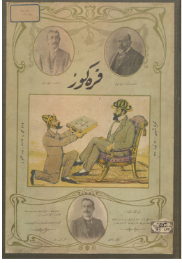
Resim1. Karagöz Gazetesi Kapağı, 1326. TBMM Arşivi.

birçok yerinde oynatılan Karagöz, geleneksel Türk tiyatrosunda çok özel bir konuma sahiptir. Karagöz'ün kendi içinde zaten bağımsız bir hüviyeti vardır. Perdenin dünya, hayallerin insan ve arkadan suretlerin varlık sebebi olan ışığın da yaratıcı olduğu düşüncesine inanılmıştır. Bu çerçeve içinde Karagöz, Hacivat ve perdedeki diğer suretler aynı zamanda sorgulanması gereken konuların sorgulandığı, yöneticilerin zaman zaman tenkit