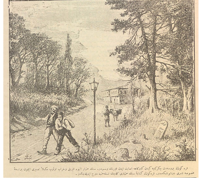
Resim 5. Karagöz'ün mezarının Çekirge Caddesindeki çizimi.

oluşu da eski bir şey olduğunu ehl-i dikkate ayan ve taşın arkasındaki 'Hayâlî tarik-i nakşiyeden es-Seyyid Mustafa Tevfik ibaresi de taşı yaptıranı beyan eder. Karagöz'ün tercüme-i haline dair mutallî' olduğumuz bazı ma'lumatı tevsî' ve tetkik için uğraşyoruz. Neticede bi't-tabi neşri-sütun eyleyeceğiz. Bu babta vukuf u malumat sahibi olan zevat-ı kiramın himmetlerini rica u intizar eyleriz." İfadesi yer almaktadır.