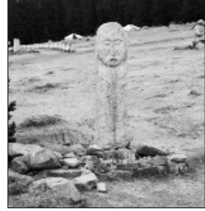
Moğolistan'daki Türk Yazıt ve Heykelleri

kesin can güvenliğini düşünürdü. Bir keresinde Hindistan'a giden bir kervanın yolda soyulması üzerine, bu olayda mallarını yitiren bir kadının; “kontrol edemeyeceğin yerleri niye alıyorsun” demesi yüzünden, bundan sonra top- raklarından geçen bütün kervanların korunacağını duyurduğunu 9 biliyoruz.