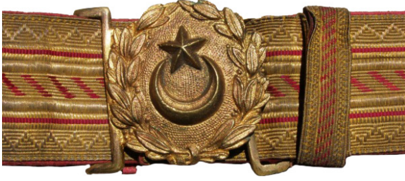
Fotoğraf 14: Erkân ve ümerâya mahsus sırma kemer takımı detay. 71