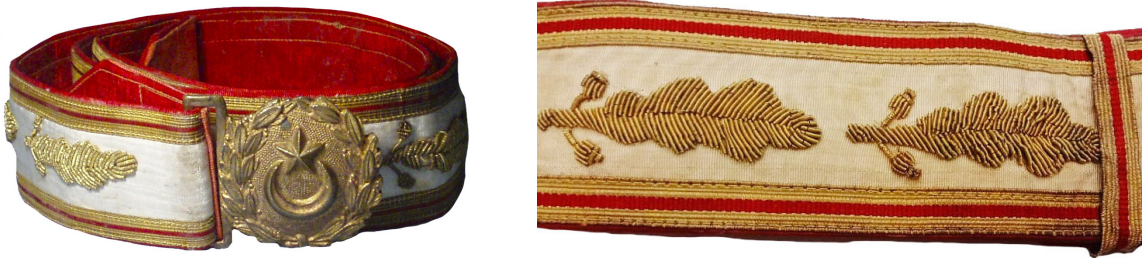
Fotoğraf 9: Merasimlerde büyük üniforma ile kullanılan sarı sırma işlemeli kemer ve işleme detayı. 64

Resmi tören ve ziyaretlerde sarı sırma kemer takılır. (Fotoğraf 9) Padişahların altın sırma ile imâl edilen kemerleri vardır. Tanzimattan sonra kemer tokaları Osmanlı Devleti arması ile gemi çapası, top namlusu ve güllesi, ayıldız gibi amblemler taşımıştır. 63 Suvârî sınıfına mensup paşalar arka kısmında küçük bir çanta bulunan sırma ile imâl edilmiş bir kemer kullanır.