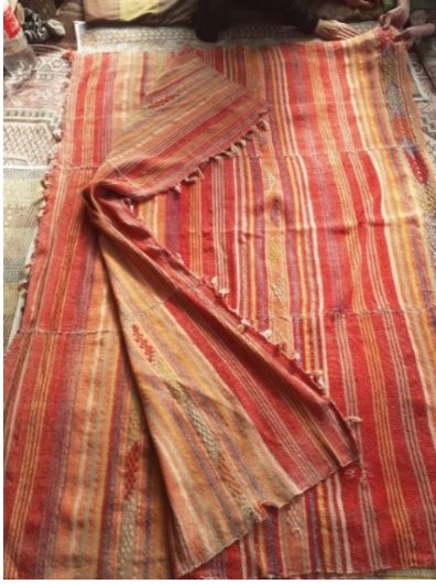
Resim 2: Kızılihram (Şavkar, 2019).

Kızılihramların süslemesinde renkli şeritlerin yanında ilave atkıyla yapılan cicim tekniği kullanılmaktadır. “Cicim, bezayağı dokumalar üzerine renkli ilave atkıyla yapılan havsız bir dokuma çeşididir.” 11