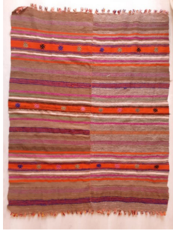
Resim 4: Ton Değişikliği Bulunan Kızılihram (Şavkar, 2019).

Geleneksel dokumalarımızı değerli kılan özgün desenlerinin yanı sıra kullanılan doğal boyarmaddelerdir. Doğal boyarmaddelerle yapılan boyamacılık sentetik boyalarla yapılan boyama işlemine göre biraz zahmetli olmakla beraber daha sağlıklı ve uzun ömürlü olmaktadır. Ham olarak doğal rengi ile kullanılan krem yün aynı zamanda çeşitli bitki türlerinin kök, kabuk, yaprak ve tohumlarının kaynatılması ile elde edilen renklerle de boyanmaktadır.