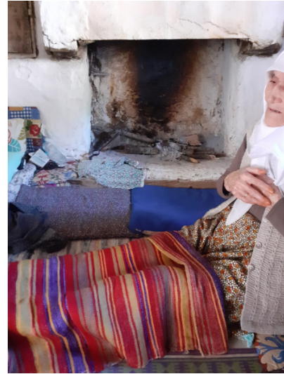
Resim 13: Seccade Olarak Kullanılan Kızılihramlar (Şavkar, 2019).

Yöredeki dokuma geleneği birçok merkezde olduğu gibi yaklaşık 30 yıl öncesine kadar devam etmiştir. Ekonomik gelişmeler, yöredeki tarım ve sera faaliyetleri, köyden kente göç ve bunun gibi çeşitli sebeplerden dolayı yaşanan değişimlerden sonra dokuma eylemi bırakılmıştır. Yörük yaşam tarzının ayrılmaz bir parçası olan dokumalar bugün çeyiz sandıklarında varlıklarını sürdürmektedir.