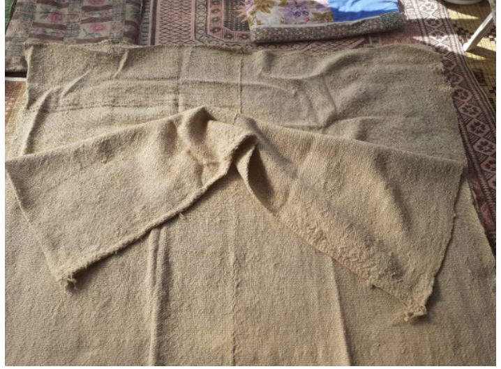
Resim 3: Akihram (Şavkar, 2019).

Yörüklerin yaptığı dokumalar arasında en kıymetlisi kabul edilen ince kalitedeki Kızılihramlar dokumada düz zemininde kırmızı rengin hakim olmasından dolayı bu ismi almıştır. 12 Yaşam biçimleri dolayısıyla çeyiz kültürünün pek gelişemediği Yörüklerde kızların en önemli çeyizleri rengârenk ve üzeri motiflerle süslenmiş olan Kızılihramlardır.