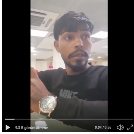
Şekil 2: “Halk artık isyan etme noktasına geldi. Elinde binlerce TL lik akıllı telefonla, boyuyla posuyla, kocaman eli silah tutan adam bu mu mazlum? #Suriyelilerİstemiyoruz bunları geri gönderin. Sabrımız kalmadı! Milletin parasını bunlara yediremezsiniz!” şeklinde paylaşılan videodan alınan ekran görüntüsü.