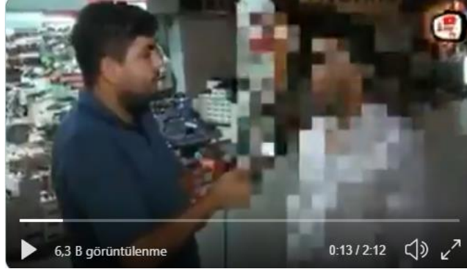
Şekil 1: “Türkler işsizse bana ne! Bu benim değil senin (Türkiye’nin) sorunun!” şeklinde paylaşılan videodan alınan ekran görüntüsü.