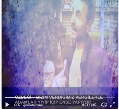
Şekil 3: “Başlarda alışmaya çalıştım, hümanist düşündüm, defalarca empati kurdum ama yok olmuyor bunları sevemiyorum, istemiyorum çünkü ben mülteci olsam bu kadar yüz­süz olmazdım. Çekilir köşeme mülteci gibi davranırdım. İstenmiyorlarsa sorun bizde değil onlarda.” şeklinde paylaşılan videodan alınan ekran görüntüsü.