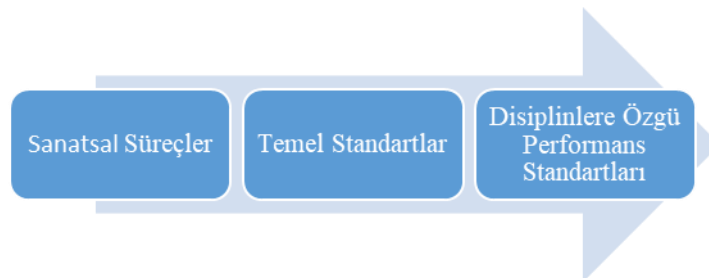
Görsel 1. Ulusal Temel Sanat Standartları Tasarım Yapısı.

Sanat disiplinlerinin her biri bu sanatsal süreçleri bazı biçimlerde birleştirmektedir. Bu süreçler sanat ve öğrenci arasındaki bağı tanımlamaktadır ve organize etmektedir. Her sanatsal süreç iki veya üç temel standarda ayrılmaktadır. Temel standartlar, öğretmenlerin öğrencilerinden sanat eğitimi boyunca göstermelerini bekledikleri genel bilgi ve becerileri tanımlamaktadır. Temel standartların, sanat disiplinleri ve sınıf seviyeleri arasında paralel olduğu ve sanatsal okuryazarlığın somut eğitimsel ifadesi olduğu belirtilmektedir. Temel standartların altında da disiplinlere özgü (dans, medya sanatları, müzik, görsel sanatlar, tiyatro) performans standartları bulunmaktadır. Bu şekilde, performans standartları, temel standartları belirli ve ölçülebilir öğrenme hedeflerine dönüştürmektedir. Bağlı ve hizalanmış bir sistemi yansıtan tasarımın, disiplinler arasında ortaklığa ve her disiplindeki özgüllüğe izin verdiği böylece ulusal standartlar için uygun genişlik ve derinlik seviyesini belirlediği düşünülmektedir. Aşağıdaki model tüm tasarımın bir bölümünü temsil etmektedir: