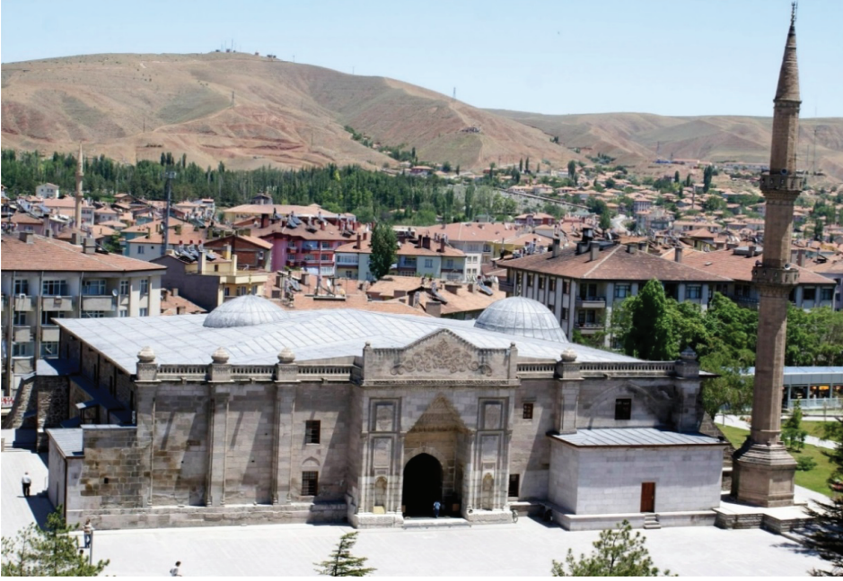
Foto. 1: Karamanoğlu Mehmet Bey Camii/Ulu Camii