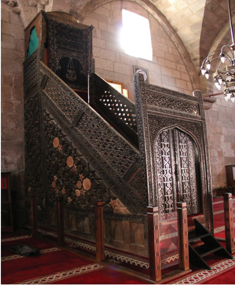
Foto. 4: Minberin sol tarafından eksilen parçalar ve yerine takılan benzerleri