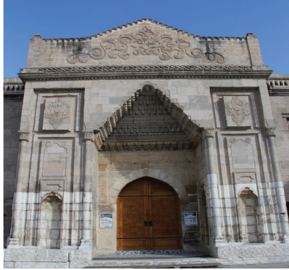
Foto. 2: Ulu Camii'nin ana giriş kapısı

köşesinde aydınlatma işlerinde kullanılan bezir, zeytinyađı ve caminin çeşitli eşyalarının konulduđu bir bezirhane bulunmaktadır. (Erdal vd. 2017: 100).