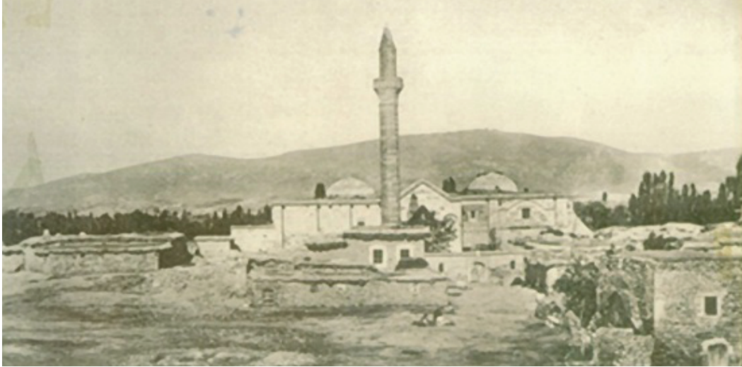
Foto. 3: 1895 yılında Ulu Camii ve Minaresi

Evliya Çelebi Seyahatnamesi'nde Aksaray anlatılırken caminin minaresinin ana yapıdan uzakta bir yerde olduđu belirtilmektedir (Yıldırım, 2012: 54). Aksaray Müzesi'nde muhafaza edilen ve Ferit isiminde birisinin hazırlamış olduđu kitabede belirtildiđi üzere daha önceki yıllarda var olan bu minare yıkılmış ve yerine H.1118 (M.1706/1707) yılında Abdullah Ađa ođlu Seyyid Hacı Mehmet isimli bir hayırsever tarafından yeni bir minare yaptırılmıştır. 5 Caminin batı kısmında bulunan bu minarenin zamanla eğilerek yıkılmasıyla, 1925 yılında, caminin güneybatı tarafına, camiden ayrı olarak günümüzdeki çift şerefeli minare inşa edilmiştir (Konyalı, 1973: 275; Konyalı, 1974: 1235).