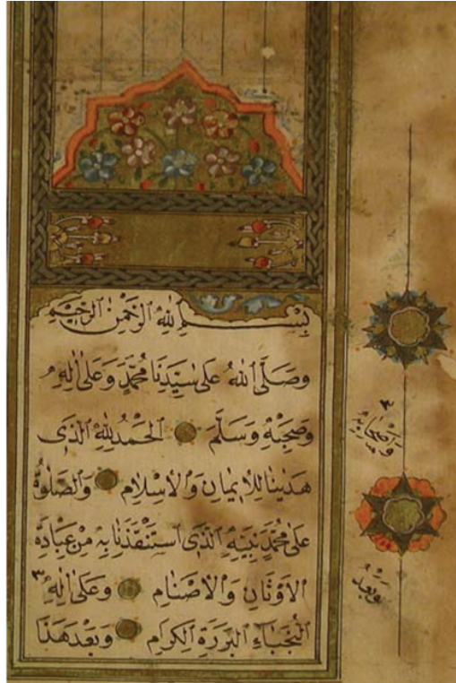
Resim 13: 1791 tarihli Delâilü'l-Hayrât nüshasında serlevha tezhibi (O. Nuri SOLAK, “Konya Bölge Yazma Eserler Kütüphanesi’nde Bulunan Bazı Delâilü'l-Hayrât’lardaki Tasvirler”)