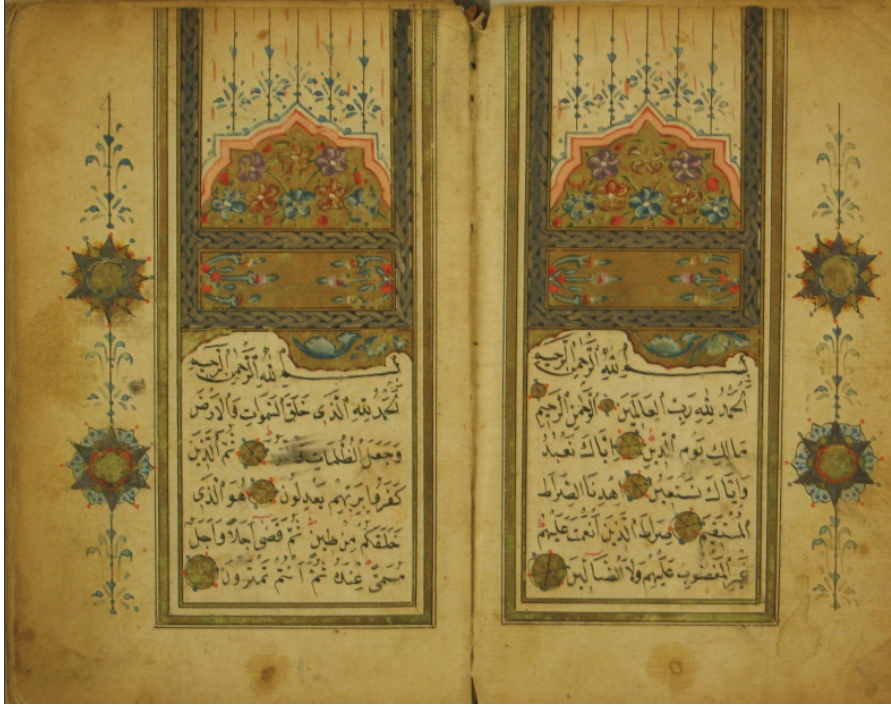
Resim 3. Eserin serlevha tezhibi