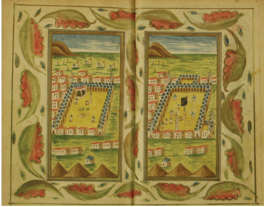
Resim 10. Eserde Mescid-i Haram ve Mescid-i Nebevî tasvirleri