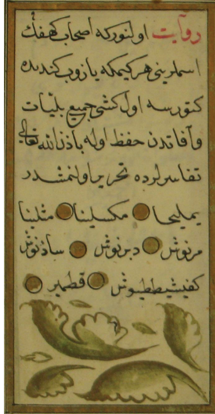
Resim 11. Eserde Ashab-ı Kef'ın isimlerinin yer aldığı sayfa