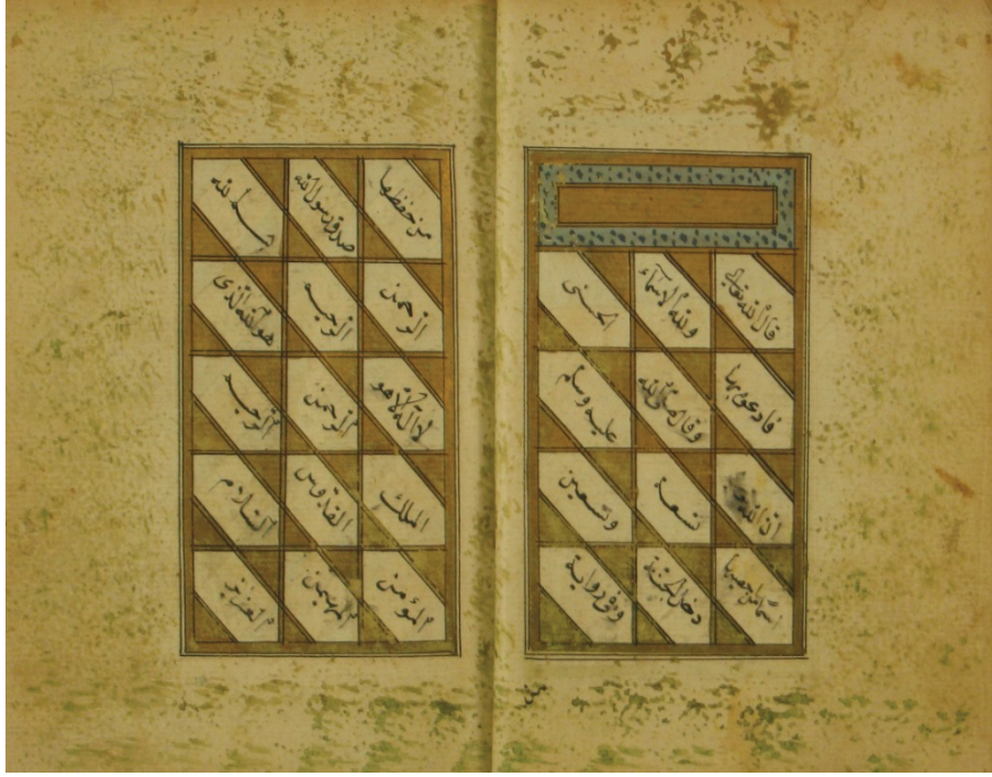
Resim 5. Eserde Esmâ'ül-Hüsna'nın yer aldığı sayfalardan ilk ikisi