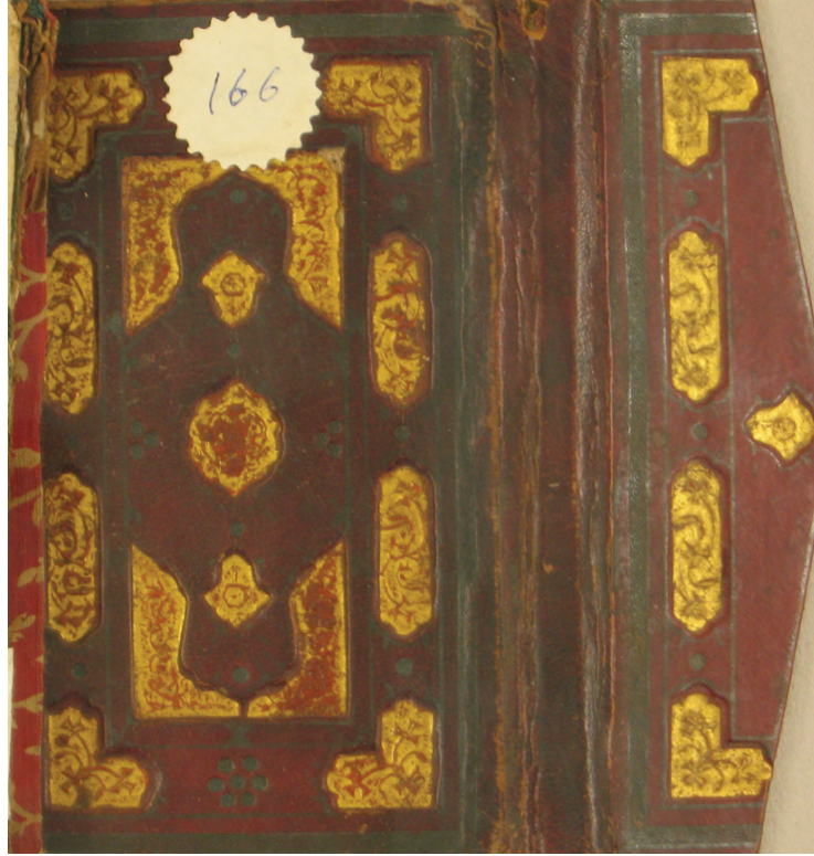
Resim 1. Eserin sertablı ve miklebli cildi