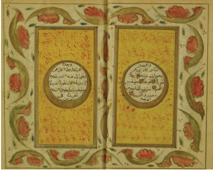
Resim 7. Hilye formunda Hz. Ebubekir ve Hz. Ömer'in vasıfları