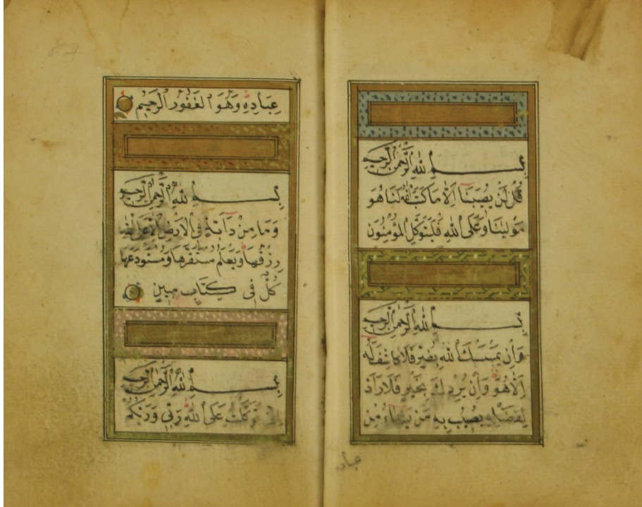
Resim 4. Eserdeki sûre başı tezhiplerinden örnekler