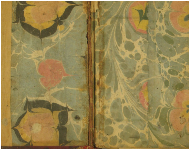
Resim 2. Eserin kapağındaki Hatip ebruları