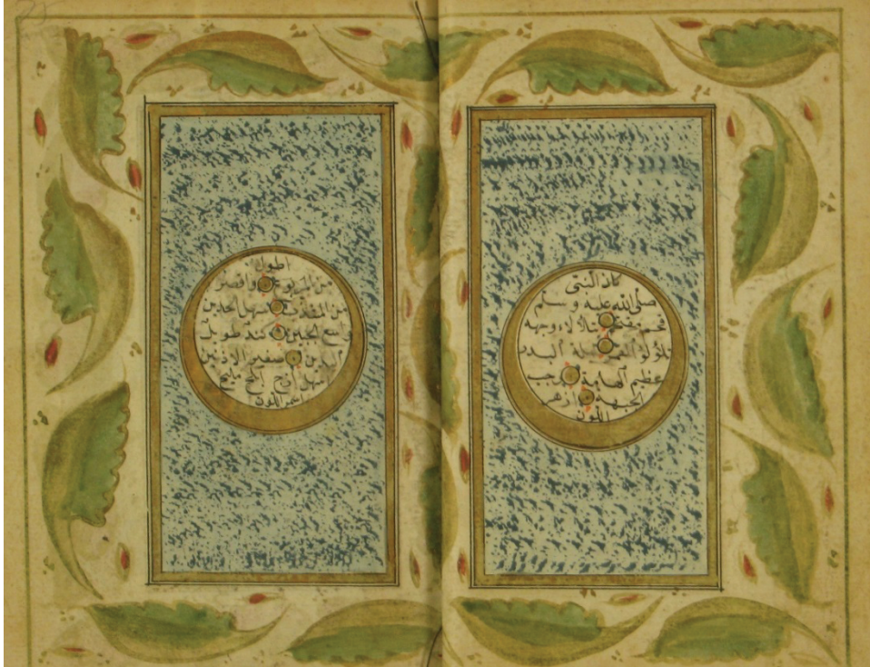
Resim 6. Hilye formunda Hz. Muhammed'in vasıfları