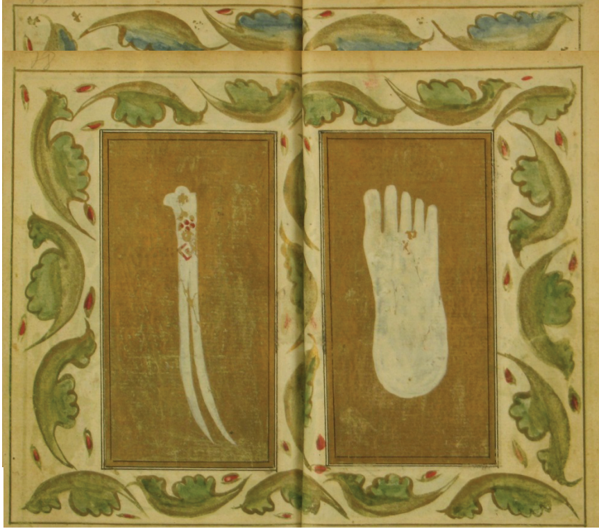
Resim 9. Eserde zülfikar ve kadem-i şerif tasvirleri