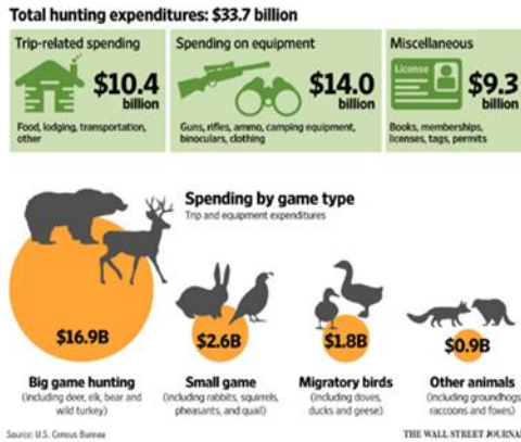
Şekil 1. ABD Toplam Avcılık Harcamaları.

Hesaplamalar yapılırken Amerika'daki yapılan hesaplama şablonu örnek alınarak ve ülkemizdeki diğer harcamalar ilave edilerek avcı turistlerin harcamaları hesaplanacaktır. Kaynak olarak ülkemizdeki TÜİK ile yaklaşık aynı işleri yapan Amerika Sayım Bürosunun istatistikleri ele alınmıştır.