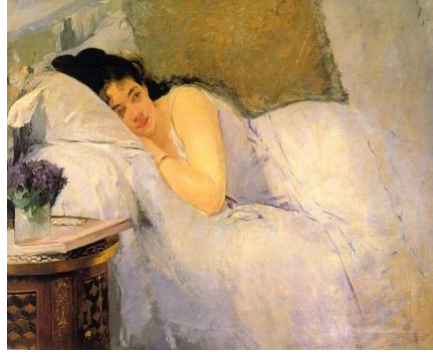
Resim 8. Eva Gonzales , Kadının Uyanışı, 1876, yağlı boya, 101.5 x 82.5 cm