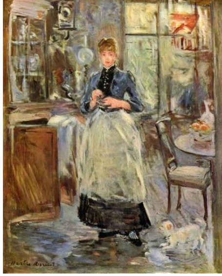
Resim 7. Berthe Morisot , Yemek Odasında, 1875, yağlı boya, 61.3 x 50 cm