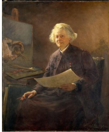
Resim 12. Anna Klumpke ,Rosa Bonheur, 1898, yağlı boya, 117.2 x 98.1 cm

Genel olarak hayatındaki ilgi ve şöhreti stresli bulan Rosa Bonheur 1859 yılında Paris'ten ayrılarak Fountainebleau Ormanlarının yakınındaki By kasabasında içinde çiftlik bulunan bir şato satın almış ve büyük bir atölye kurduğu bu kasabada Nathalie ile birlikte yaşamaya başlamıştır. Rosa Bonheur her sabah güne erken başlamış ve ormanda çalışabileceği yerler aramıştır. Diğer sanatçılardan uzakta ailesi ve arkadaşlarıyla vakit geçiren ressam, sadık dostu Nathalie Micas'ın 1889 yılında ölmesiyle derin ve ağır bir acı yaşamıştır. Aynı yıl Amerikalı ressam Anna Klumpke, Rosa Bonheur'un bir portresini yapmak istemiş ancak ressam kendisini iyi hissetmediği için bu teklifi geri çevirmiştir. 1893 yılında çıktığı Amerika turundan bir yıl sonra geri dönünce artık kendisini daha iyi hissettiğini belirten Bonheur, Anna Klumpke'nin teklifini kabul etmiş ve böylece Klumpke Fransa'da da resim eğitimi almıştır. Kısa süre sonra birbirinden etkilenen iki kadın 1898 yılında beraber yaşama sözleşmesi imzalamışlardır. Klumpke, Bonheur'un birkaç portresini çizmeyi ve sanatçının otobiyografisini yazmayı kabul etmiştir ( Resim 12 ). 1899 yılında Bonheur'un ölümünden hemen önce üç portre tamamlayan Klumpke 1908 yılında Rosa Bonheur: Her Life and Works/ Rosa Bonheur: Hayatı ve Çalışmaları adlı kitabını yayımlamıştır.