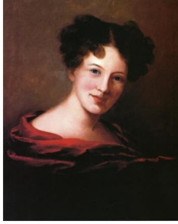
Resim 3. Sarah Miriam Peale, Otoportre, 1818, yağlıboya, 61x48cm