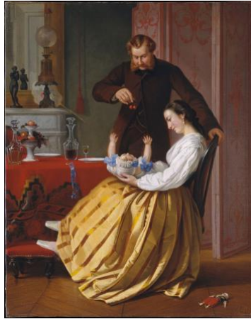
Resim 4. Lily Martin Spencer, Konuşma Parçası, 1851, yağlı boya, 71.9 x 57.5 cm

Fransız göçmen bir ailede 1822 yılında İngiltere’de doğan Lilly Martin Spencer sekiz yaşındayken ailesi ile birlikte New York’a taşınmış, sanatçı burada on üç yıl kaldıktan sonra Ohio’ya taşınmıştır. Küçük yaşta resme olan yeteneğiyle fark edilen Spencer, ailesinin desteği ile çeşitli sanatçılarla tanışmış, onlarla belirli sürelerde çalışma ve onlara asistanlık etme fırsatı bulmuştur. Resimlerinde mutlu ev kadınları, aile yaşamı gibi konulara yer veren ressam portre, natüremort resimleriyle de tanınmış ve 1902 yılında hayatını kaybetmiştir 6 ( Resim 4 ).