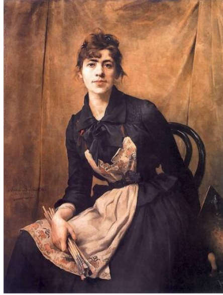
Resim 5. Anna Bilinska, önlük ve fırçalarla otoportre, 1887, 117x90cm, yağlı boya

Babasının desteği ile resim ve müzik alanlarında eğitim alan Polonyalı sanatçı Anna Bilinska (1857-1933) portre, natürmort ve manzara resimleri yapmış ve çalışmalarında pastel, yağlı boya ve suluboya kullanmıştır. Akademik resim eğitimi alan ilk Polonyalı kadın olan Bilinska, aynı zamanda 19. yüzyılda Avrupa'nın sanat merkezi olan Paris'te tanınan ilk Polonyalı kadın sanatçıdır. Yaptığı otoportresi ile Paris Evrensel sergisinde 1889 yılında altın madalya kazanmıştır 7 ( Resim 5 ).