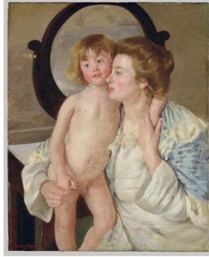
Resim 6. Mary Cassatt, Anne ve Çocuk, 1899, yağlı boya, 81.6 x 65.7 cm

temsilcilerinden biri olan Cassatt, çalışmalarında anne, çocuk ve ev yaşamı konu edinen resimler yapmıştır. 1900'lerin başlarında görme problemi yaşayan sanatçı, 1914'te çalışmalarına son vermiştir 8 ( Resim 6 ).