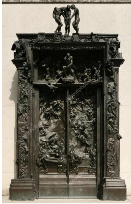
Resim 1. Aguste Rodin, Cehennem Kapıları, 1880-1917

19. yüzyılda kadınların sanat okullarına alınmalarının dışında sanat öğrenimi görmelerinin bir yolu da baba, eş, kardeş ya da sevgililerinin atölyeleri olmuştur. Ama kimi zaman bu durum yeteneklerinin sömürülmesine neden olmuş ve yaptıkları eserlere kendi imzalarını atamamışlardır. Fransız heykeltıraş Camille Claudel (1864-1943) babasının desteği ile 1883 yılında Rodin'in atölyesinde heykel dersleri almaya başlamıştır. Yeteneği ve etkileyici kişiliği ile diğer öğrencilerden ayrılarak Rodin'in gözdesi ve ilham kaynağı olmuştur. Rodin'in Claudel ile yakınlaşmasıyla beraber birçok işe imza atmışlardır. Rodin'in Cehennem Kapıları adlı eserinde Claudel'in etkilerinin çok olduğu ve büyük çoğunluğunun Claudel'e ait olduğu rivayet edilmektedir ( Resim 1 ).