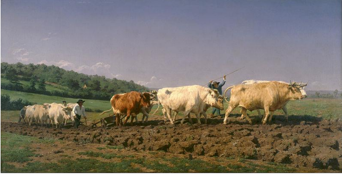
Resim 10. Rosa Bonheur, Nivernais'de Çiftçilik, 1849, yağlı boya, 1340 x 2600cm