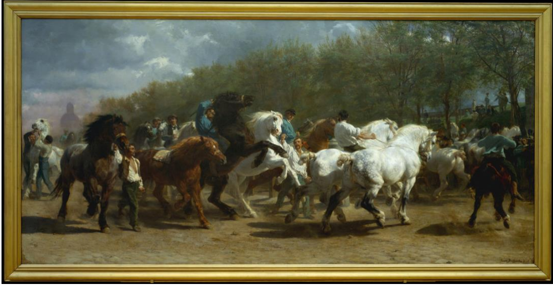
Resim 11. Rosa Bonheur, At Panayırı, 1852–55, yağlı boya, 244.5 x 506.7 cm