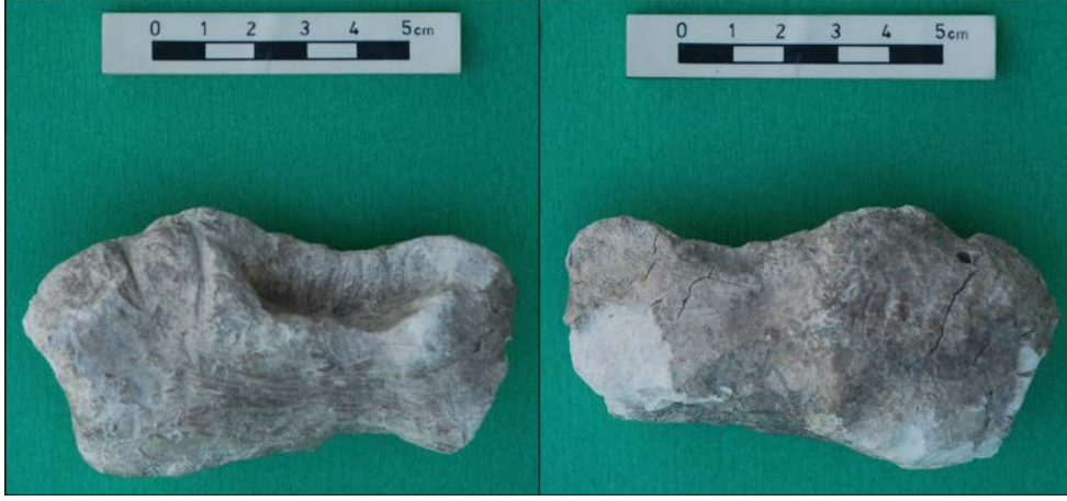
Resim 3: 3 numaralı, yarısı işlenmiş kabın iki yandan görünümü.