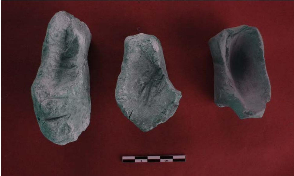
Resim 4: Soldan sağa 3, 2 ve 1 numaralı kapların üstten görünümü.