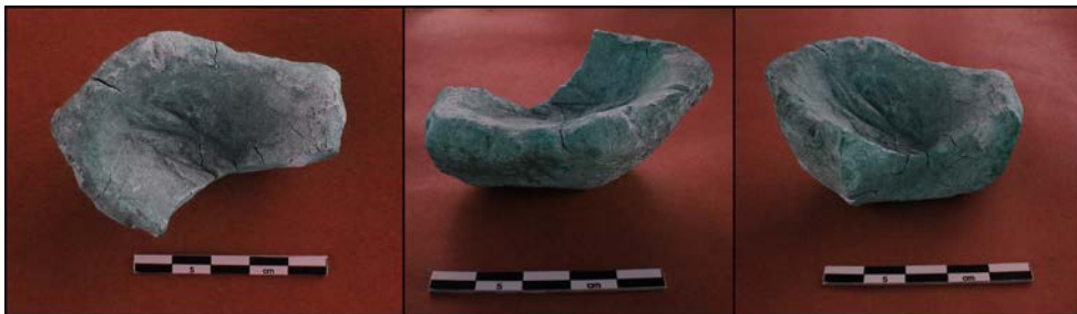
Resim 2: 2 numaralı kabın üstten ve iki yandan görünümü.