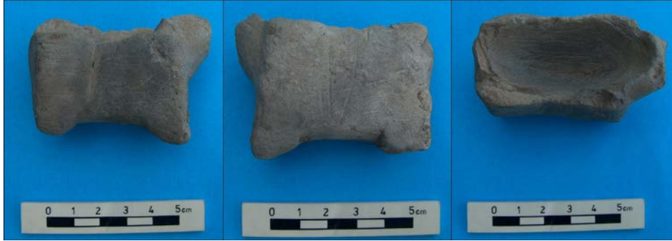
Resim 1: 1 numaralı kabın iki yandan ve üstten görünümü.