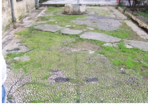
Res.10- İkiçeşmelik 773 Sokak'taki bir konağın bahçesini süsleyen çakıl mozaik.

İkiçeşmelik 773 Sokak'ta, XIX. yüzyıl sonları-XX. yüzyıl başlarında inşa edildiğini düşündüğümüz bir konağın bahçesi, bahçe ortasındaki sekizgen planlı havuz da dikkate alınarak bitkisel motifli bir tasarıma sahip çakıl mozaikler ile süslenmiştir (Res.10). Yüksek kaideli bir vazo içinden çıkan üç daldan, sağa ve sola kıvrılarak dönüş yapan ikisi çiçek ve yaprak motifleriyle sonlanırken, ortadan çıkan büyük dal havuza kadar yükselmekte, zemini bezeyen tüm motifler bu dala bağlanmaktadır. Kompozisyonu meydana getiren çiçeklerden laleler doğadaki görünümüne yakın verilmiştir.