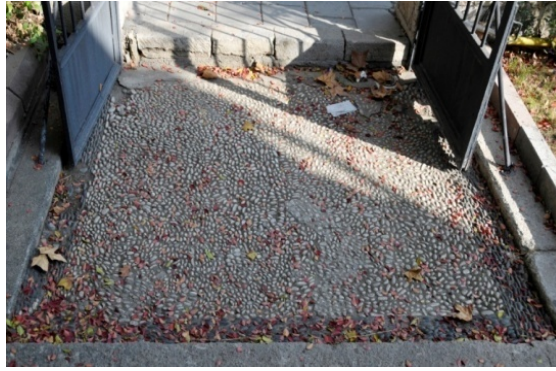
Res.16- Bornova Michel Topuz Evi, çakıl mozaik.

XIX. yüzyıl ilk yarısında inşa edilen Neo-klasik üsluplu bir mimariye sahip Bornova Michel Topuz Evi'nin 25 sokak girişinden konut girişine uzanan yolunda bulunan yaklaşık kare planlı bir bölüm süslemesiz tasarımıyla İzmir yapılarındaki çakıl mozaikler arasında yerini almıştır. Beyaz çakıl taşları ile doldurulan zemin, siyah çakıl taşları ile oluşturulan bir bordürle çevrelenerek hareketlendirilmeye çalışılmıştır (Res.16).