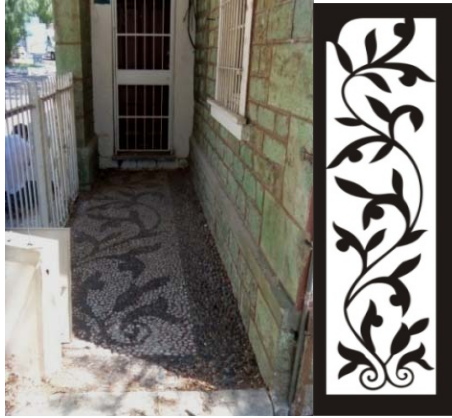
Res.15, Çiz.9-Buca, Tren İstasyonu lojmanı bahçesini süsleyen çakıl mozaik ve çizimi

7 Ocak 1866 yılında İzmir-Aydın Demiryolu hattının Buca'ya kadar uzatılması sonucu, inşası Eylül 1872'de tamamlanan demiryolu hattına 22 ait istasyon binası 23 ve lojmanına ait zeminlerde de çakıl mozaik süslemeler görülmektedir. XIX. yüzyılın son çeyreğinde, demiryolu hattının inşasının tamamlandığı 1872 yıllarına yakın bir tarihte inşa edilmiş olması muhtemel lojmana 24 ait çakıl mozaik süslemeler, lojman giriş açıklığına kadar uzanan koridor görünümlü bahçe zemininde yer almaktadır. Bu süsleme, iki yanı volütlü bir kıvrımla başlayan "S" şekilli daldan çıkan yapraklı bir düzenlemeye sahiptir (Res.15, Çiz.9). Bitkisel motifler ve kompozisyonu sınırlandıran bordür siyah renkli çakıl taşlarından oluşturulmuştur.