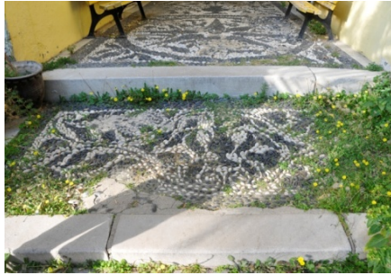
Res.8- Bornova Kuyulu Ev, bahçeye geçişi sağlayan basamaktaki çakıl mozaik.