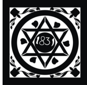
Çiz.6- Bornova Charnaud Köşkü,1831 tarihi bulunan çakıl mozaığın çizimi.

İncelenen İzmir konutlarının bahçelerini süsleyen çakıl mozaiklerde bitkisel ve geometrik süslemeleri bir arada bulunduran kompozisyonlar sıkça kullanılmıştır. Geometrik süslemede eşkenar dörtgenlerle oluşturulan baklava motifleri, bitkisel kompozisyonlarda ise antik bir vazo içerisinden çıkarak tüm zemini kaplayan kıvrım dal, yaprak ve çiçek kompozisyonları en çok işlenen konulardandır.