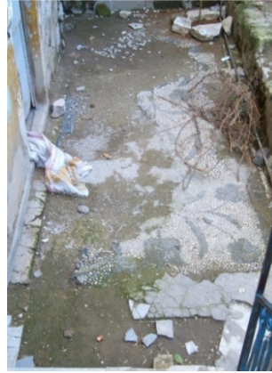
Res.13- İkiçeşmelik, 943 Sokak'taki konağın bahçesini süsleyen çakıl mozaik.

Kapani Konağı yakınında, 943 Sokak üzerinde bulunan ve XIX. yüzyıl sonları-XX. yüzyıl başlarına tarihlendirilmesi mümkün diğer bir konağın büyük bir bölümü yok olmuş çakıl mozaiklerinde aralarında lalenin de bulunduğu çiçek, yaprak ve dallarla oluşturulmuş kompozisyona ait motifler seçilebilmektedir (Res.13).