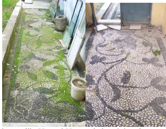
Res.11-12- İkiçeşmelik, Kapani Konağı bahçesini süsleyen çakıl mozaikler.

Kapani Konağı yakınında, 943 Sokak üzerinde bulunan ve XIX. yüzyıl sonları-XX. yüzyıl başlarına tarihlendirilmesi mümkün diğer bir konağın büyük bir bölümü yok olmuş çakıl mozaiklerinde aralarında lalenin de bulunduğu çiçek, yaprak ve dallarla oluşturulmuş kompozisyona ait motifler seçilebilmektedir (Res.13).