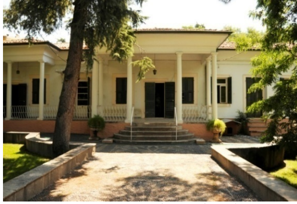
Res.2- Bornova, Charnaud Köşkü.