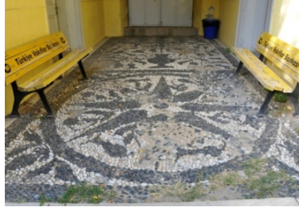
Res.7- Bornova Kuyulu Ev, giriş zeminindeki çakıl mozaikler.

görünümlü koridor ile (Res.7), bu zeminden bir basamak alçaltılarak bahçeye geçişin sağlandığı alanın zemini bu kompozisyona sahip çakıl mozaikle süslenmiştir (Res.8). Sokak girişinden bahçeye girilen ilk alanda baklava dilimlerinin bir açık, bir koyu dama görünümü verecek şekilde dizilmesiyle oluşturulan dikdörtgen bir pano bulunmaktadır (Çiz.7). Bu panoya bitleştirilen kare planlı orta pano, merkezdeki bir vazodan çıkan kıvrım dal, yaprak ve stilize çiçek motifleriyle doldurulmuştur. Bu bitkiler arasında üç yapraklı yonca ve lalelerin bulunduğu açıkça görülmektedir. Kare planlı son panoda, panonun merkezine yerleştirilmiş büyük bir dairenin içi sekiz kollu bir yıldızla bezenmiştir. Yıldız kol aralarına“S” kıvrımlı dallardan çıkan stilize lalelerin saat yönünde dönüş yapacak şekilde yerleştirilmesi sonucu kompozisyona çark-ı felek görünümü kazandırılmıştır.