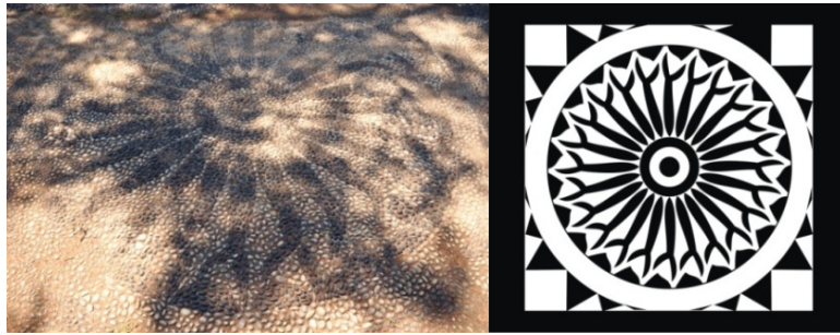
Res.3, Çiz.3- Bornova Charnaud Köşkü, sokak giriş eksenindeki ilk kare panonun görünüşü ve çizimi.

Sokak girişi eksenini üzerindeki kare planlı ikinci panoda ise bitkisel ve geometrik süslemelerin bir arada kullanıldığı görülmektedir (Res.4, Çiz.4). Merkezindeki büyük dairede on iki kollu yıldızdan geliştirilen geometrik motif bulunan bu panoda, daire ile kare arasında oluşan boş alanlarda ayaklı bir vazo içerisinde çıkan