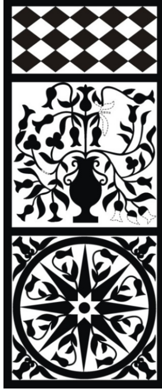
Çiz.7- Bornova Kuyulu Ev, giriş zeminindeki çakıl mozaiklerin çizimi.

Bu üçlü düzenlemeden bir basamak alçaltılan zemin, dikdörtgen planlı bir pano ile süslenmiştir. Bir bölümü tahrip olmuş mozaik, merkezdeki antik bir kaptan çıkan kıvrım dallı yaprak motifleriyle bezenmiştir (Res.8).