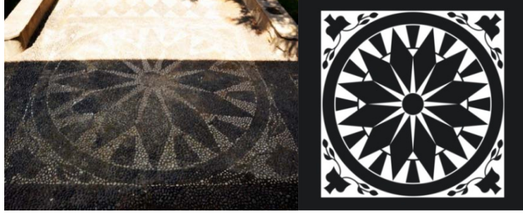
Res.4, Çiz.4- Bornova Charnaud Köşkü, sokak giriş eksenindeki ikinci kare panonun görünüşü ve çizimi.

yapraklı kıvrım dalların tomurcuk formu çiçekle sonlandırıldığı bir düzenleme yer almaktadır.