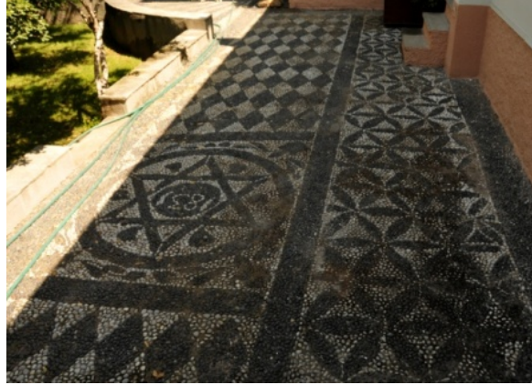
Res.6- Bornova Charnaud Köşkü, cephe sağ tarafında bulunan çakıl mozaiklerin genel görünüşü.

bulunan büyük bir dairenin içinde “1831” 20 tarihi yazılı bir Mühr-ü Süleyman motifi dikkati çekmektedir (Çiz.6).Bu tarih mozaiklerin buraya döşendiği tarih olmalıdır.