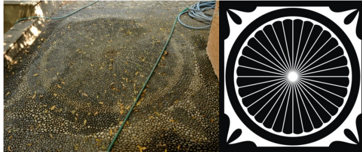
Res.5, Çiz.5- Bornova Charnaud Köşkü, cephe sol tarafında bulunan kare panonun görünüşü ve çizimi.

Köşkün verandasına çıkışı sağlayan merdivenlerin formuna uygun olarak yuvarlatılarak içi ışınsal düzende çizgilerle doldurulan çeyrek daire şekilli süslemeler, sokak giriş eksenindeki çakıl mozaikler ile köşkün ön cephesinde bulunanlara bağlantıyı sağlamaktadır. Cephenin sol tarafında iki, sağ tarafında dört adet pano bulunmaktadır. Bunlardan sol tarafta bulunan yamuk plana sahip ilk panonun beyaz çakıl taşlarıyla oluşturulan süslemelerine siyah çakıl taşları ile oluşturulan bir fon üzerindeymiş izlenimi verilmiştir. Yamuk planlı bir silme ile çevrelenmiş bu panoda silmenin içinde kalan alana içerisinde birer stilize yaprak motifi bulunan üç adet eşkenar dörtgen yerleştirilmiştir. Cephe, merkezinde ışınsal düzenli otuz iki dilimli bir daire bulunan kare bir pano ile sonlandırılmıştır (Res.5, Çiz.5).