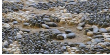
Res.1- Çakıl mozaik süslemelerden ayrıntı.

Çakıl mozaik Rodos işi bezeme, podima, çakıl kakma, karfato, çivileme gibi isimlerle de adlandırılmaktadır. Bu mozaikler sahil ve dere kenarlarından toplanan 5-7 cm. büyüklüğündeki siyah, beyaz, kırmızı, yeşil gibi çeşitli renklerdeki oval formlu doğal çakıl taşlarının dar yüzleri üste bakacak şekilde kurumamış çimento harcı içerisine, belirlenen desene uygun olarak, elle tek tek gömülüp, üzerinin cilalanmasıyla oluşturulmaktadır 7 (Res.1, Çiz.1). Uygulama derinliği, bitmiş zeminden itibaren en az 8 cm. olan çakıl mozaik süslemede 1 m 2 lik bir alanı kaplamak için toplamda 2500-3500 adet çakıl kullanıldığı bilinmektedir 8 .