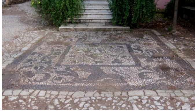
Res.9- Buca Erdem Caddesi üzerindeki köşkün bahçesini süsleyen çakıl mozaik.

İkiçeşmelik 773 Sokak'ta, XIX. yüzyıl sonları-XX. yüzyıl başlarında inşa edildiğini düşündüğümüz bir konağın bahçesi, bahçe ortasındaki sekizgen planlı havuz da dikkate alınarak bitkisel motifli bir tasarıma sahip çakıl mozaikler ile süslenmiştir (Res.10). Yüksek kaideli bir vazo içinden çıkan üç daldan, sağa ve sola kıvrılarak dönüş yapan ikisi çiçek ve yaprak motifleriyle sonlanırken, ortadan çıkan büyük dal havuza kadar yükselmekte, zemini bezeyen tüm motifler bu dala bağlanmaktadır. Kompozisyonu meydana getiren çiçeklerden laleler doğadaki görünümüne yakın verilmiştir.