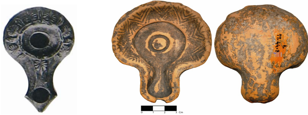
Resim 3: Delos'ta ele geçmiş bir kandil (Bruneau, a.g.e. , Pl. 15, Fig. 2812)