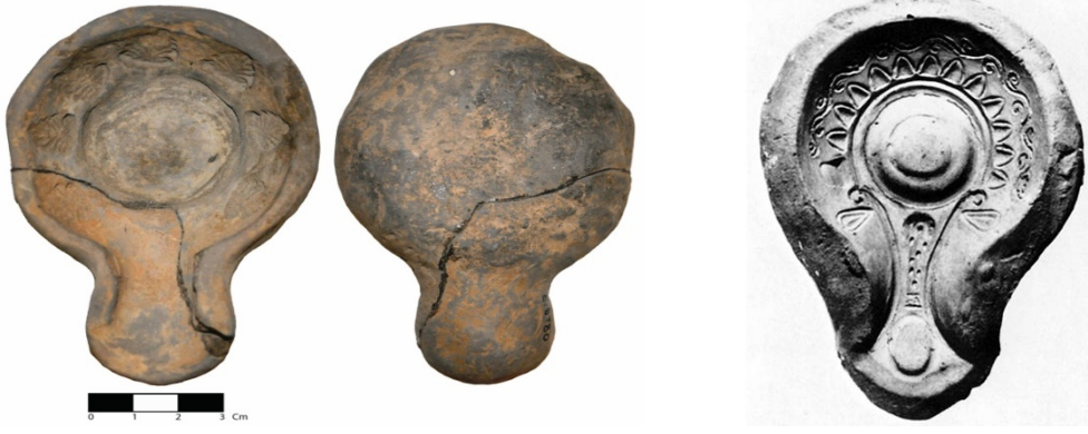
Kalıp 1: Burdur Müzesi env. 8780