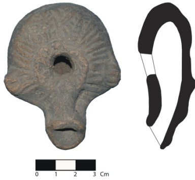
Resim 4: Burdur Müzesi env: K.233.66.75