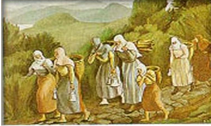
Resim 3 : Halil Dikmen, Tarla Dönüşü. ( III. Yurt Gezisi, Giresun.1940 ) ( http://www.resim-sanati-ve-ressamlar/107013-1940larin-turk-resim-sanati.html ) ( Erişim tarihi : 07.09.2009 )

Devlet yurt gezileri fikrini oluştururken, Cumhuriyetin ilanı ile birlikte değişen kültür ve sanat ortamını ele almış, bu gezilerde dünyadaki benzer örnekleri araştırılmış, uygulamanın nasıl yapılacağı hakkında karar verilmiştir. Yurt gezilerine katılacak sanatçıların belirlenmesi konusunda ise yetki, tek partili dönemin hükümeti tarafından Güzel Sanatlar Akademisi'ne verilir. Bu yüzden belirlenecek olan sanatçılar arasında, akademik unvanlı olmak veya akademi tahsili yapmış olma şartı vardır 4 .