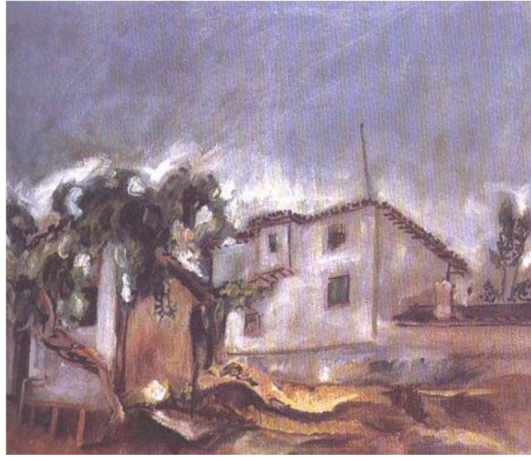
Resim 8 : Bedri Rahmi Eyüboğlu, Muradiye'de Kahve. (I. Yurt Gezisi, Edirne, 1938 ) (Başak Bugay, Yüksek Lisans Tezi)

Geziye katılan sanatçıların yol masrafları hükümet tarafından karşılanacak ve ayrıca zorunlu ihtiyaçları olarak her bir sanatçıya 300'er liralık ödeme yapılacaktır. Gezi sonrası sanatçıların eserleri Ankara Devlet Resim ve Heykel Müzesinde toplanacak ve her yılın 29 Ekim Cumhuriyet bayramına denk gelen gününde sergi açılacaktır. Bu açılan sergilerde yurdu gezen ressamların eserleri arasında yarışma düzenlenecek ve ilk