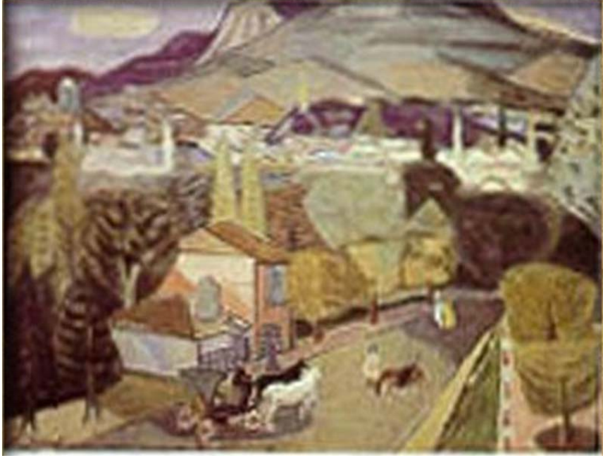
Resim 2 : Cevat Dereli, Gümüşhane. ( V. Yurt Gezisi, 1942 )

Türkiye Cumhuriyeti'nin kuruluşundan sonra gerçekleştirilen devrimler sonucunda, devletin sanat politikası, devlet desteğine ihtiyaç duyan sanatçıya sahip çıkmaktır. Bu sanatçılar halkın sorunlarını anlatacak eserler üretir. Devletin kültür politikası bu yönde belirlenmiştir. Bu kültür politikası belirlenirken, topluma yönelik ve toplumun sorunlarını ön plana çıkararak bir anlayışla sanata destek olacaktır 2 .