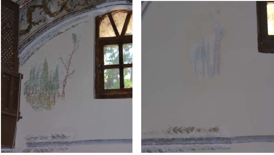
Resim 14. Eski Mordoğan Köyü Camii. Harim doğu ve batı duvarındaki orman manzaraları.

ve batı taraftakilerde birer orman manzarasının varlığı rahatlıkla seçilebilmektedir (Res. 14). Bu ormanlardan doğu taraftaki daha iyi durumdadır. Batı duvarındakiler ise belli belirsiz seçilebilmektedir. Her iki orman da incecik kırmızı gövdeleri üzerinde, yukarı doğru sivrilerek yükselen, büyüklü küçüklü yemyeşil servi ağaçlarından meydana gelmektedir. Ayrıca servilerin hemen yanı başında, birer palmye veya çam ağacı olarak düşünüldüğüne ihtimal verdiğimiz, daha uzun ve kalın gövdeli ikinci tür ağaçların da varlığı fark edilmektedir. Ne yazık ki çok azı korunabildiği için resmin geneli hakkında bir şey söylemek şimdilik pek mümkün değildir. Ağaçlardan ön palandakiler daha büyük, geridekiler ise küçük verilerek başarılı bir perspektif oluşturulmaya çalışılmıştır.