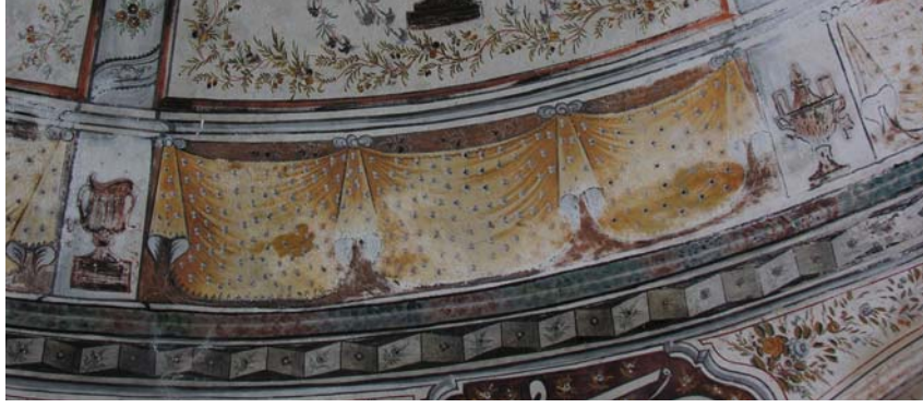
Resim 10. Eski Mordoğan Köyü Camii. Kubbe eteğinde yer alan süslemelerden ayrıntı.

Kubbeye geçişi sağlayan trompların da yüzeyi tamamen boyalı nakışlarla süslenmiştir. Bu bölümün tüm yüzeyini kaplayan ve tepede iri bir fiyonkla bağlanmış olarak asılı duran perde motiflerinde yeşil, sarı, beyaz ve kahverengi renkler hâkimdir (Res. 11). Bunların bir kısmı iyi korunamamış ve yer yer bozulmuştur. Süslemelerin ilk anda birbirlerinin kopyası oldukları düşünülse de ayrıntılarda bazı farklılıkların bulunduğu görülmektedir. Örneğin güneydoğu köşedeki trompta yer alan perde motifinin tepe noktasına kırmızı bir kurdele yerleştirilmişken, güneybatı köşedekinin yüzeyine, ortadan iki yana ayrılmış, kırmızı renkli ikinci bir perde tasviri daha işlenmiştir. Kenarları kıvrımlar yapan, eteklerinde püsküllerin yer aldığı perdelerin tüm yüzeyi yeşil, mavi, beyaz, sarı ve kırmızı renkte çiçekler açmış ince bahar dalları ile süslenmiştir (Res. 11).