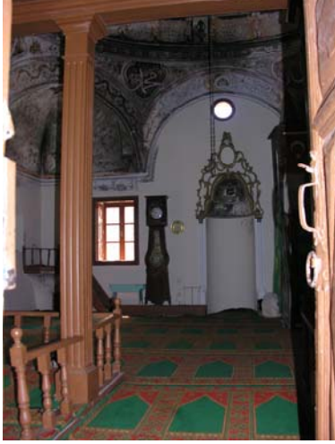
Resim 5. Eski Mordoğan Köyü Camii. Harimden genel görünüş.