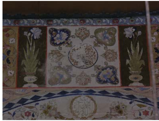
Resim 21. Zakatala-Mosul Köyü, Mosul Mescidi. Mihrap çevresindeki süslemelerden ayrıntı.