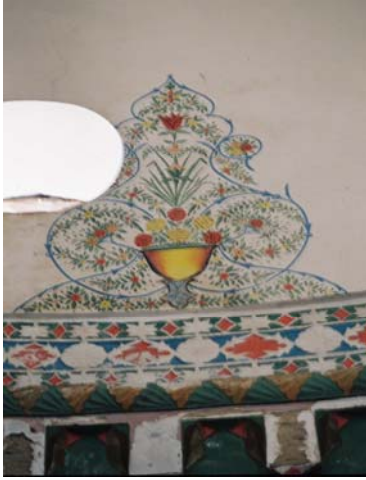
Resim 20. Kuba, Cuma Mescidi. Kubbe içindeki süslemelerden ayrıntı.

daha yakın ilişkiler geliştirmiştir. Bunun neticesinde Batılı etkiler toplumun her alanında olduğu gibi kültür ve sanat alanında da kendini göstermeye başlamıştır 27 . Diğer bir neden de iki kardeş ülkenin sanat adamları arasındaki karşılıklı etkileşimdir. Şehirlerdeki saraylara, evlere ve kimi camilere yapılan resimler bunun güzel göstergelerindedir. Bu yapılardan Şeki Han Sarayı'nda görülen kalem işi süslemeler, içinde canlı figürlerin yer alması bakımından diğerlerinden farklı bir görüntü sergilemektedirler.