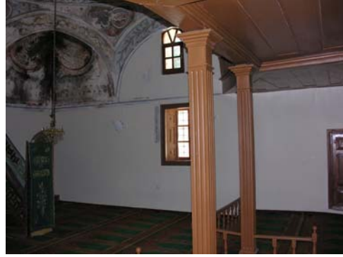
Resim 6. Eski Mordoğan Köyü Camii. Harim batı duvarında yer alan süslemelerden geriye kalanlar.