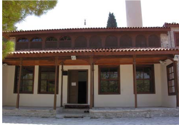
Resim 2. Eski Mordoğan Köyü Camii. Kuzey cepheden genel görünüş.