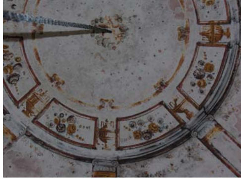
Resim 8. Eski Mordoğan Köyü Camii. Kubbe merkezinde yer alan genel süslemelerden ayrıntı.