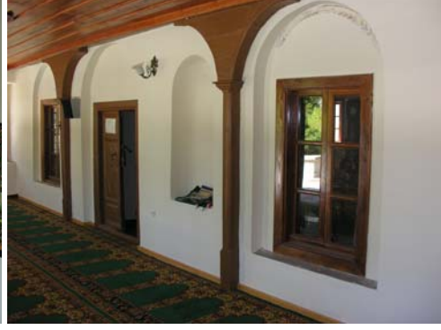
Resim 4. Eski Mordoğan Köyü Camii. Son cemaat yerinin onarımından sonraki durumu (2008).

Yapının harimi kare bir plana sahiptir. Buraya, kuzey duvarının ortasına yerleştirilmiş, dikdörtgen açıklık şeklindeki bir kapı ile girilir. Üzeri, sivri kemerli tromplarla geçilen tek bir kubbe ile örtülüdür. Toplam dokuz adet pencere ile aydınlatılan mekânın kuzey duvarı boyunca, ahşap kadınlar mahfili uzanmaktadır. Doğu duvarının güney ucunda sivri kemerli dikdörtgen bir niş, batı duvarının kuzey ucunda da minare girişi yer almaktadır. Ayrıca güney duvarının ortasında yarım daire profilli bir mihrap, güneydoğu köşesinde de küçük bir vaaz kürsüsü bulunmaktadır.