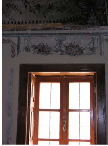
Resim 15. Eski Mordoğan Köyü Camii. Pencere üst seviyesinde yer alan süslemelerden geriye kalanlar.

Giriş açıklığıyla aynı eksen üzerinde yer alan mihrap güney duvarının ortasındadır. Yarım daire profilli mihrap nişi, çeyrek küre şekilli bir kavsara ile örtülmüştür. Nişin iki yanında; dikdörtgen kaidelere oturan, üzeri akantus yapraklarıyla süslü başlıklara sahip, yarım daire profilli alçı sütunçeler yer almaktadır (Res. 16). Caminin iç duvarları gibi mihrap kavsarasının tüm yüzeyi de boyalı bezemelerle süslüdür. Aslında mihrap nişinin de bir zamanlar boyalı nakışlarla süslü olduğu üst kesiminde kalan izlerden anlaşılmaktadır. Bu izler, tromp yüzeylerinde yer alan perde motiflerine süsleme karakteri ve üslup açısından çok yakındır (Res. 17). Renkli küçük çiçekler ve ince çizgiler perde kıvrımlarını hatırlatmakta, dolayısı ile de perde motiflerinin havasını vermektedir. O halde, bunlardan da anlaşıldığı üzere, buradaki süslememin de bir perde tasviri olabileceğini söylemek yanlış olmasa gerek.