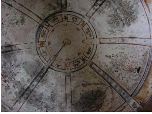
Resim 7. Eski Mordoğan Köyü Camii. Kubbede yer alan süslemelerden genel görünüşü.