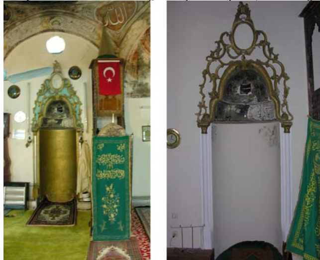
Resim 16. Eski Mordoğan Köyü Camii. Mihrab ve süslemelerinin onarım öncesi ve sonrasındaki durumu.

Giriş açıklığıyla aynı eksen üzerinde yer alan mihrap güney duvarının ortasındadır. Yarım daire profilli mihrap nişi, çeyrek küre şekilli bir kavsara ile örtülmüştür. Nişin iki yanında; dikdörtgen kaidelere oturan, üzeri akantus yapraklarıyla süslü başlıklara sahip, yarım daire profilli alçı sütunçeler yer almaktadır (Res. 16). Caminin iç duvarları gibi mihrap kavsarasının tüm yüzeyi de boyalı bezemelerle süslüdür. Aslında mihrap nişinin de bir zamanlar boyalı nakışlarla süslü olduğu üst kesiminde kalan izlerden anlaşılmaktadır. Bu izler, tromp yüzeylerinde yer alan perde motiflerine süsleme karakteri ve üslup açısından çok yakındır (Res. 17). Renkli küçük çiçekler ve ince çizgiler perde kıvrımlarını hatırlatmakta, dolayısı ile de perde motiflerinin havasını vermektedir. O halde, bunlardan da anlaşıldığı üzere, buradaki süslememin de bir perde tasviri olabileceğini söylemek yanlış olmasa gerek.