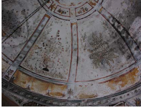
Resim 9. Eski Mordoğan Köyü Camii. Kubbede yer alan süslemelerden ayrıntı.

Sütunları taşıyan, profilli başlıklara sahip yüksek kaidelerin arası sarı renkteki perde motifleriyle bezelidir. Üstten birer fiyonkla bağlanarak asılı halde duran bu perdelerin bir kısmı iyi korunamamış ve yer yer boyaları dökülerek bozulmuştur. Perdelerin kıvrımları, sarının farklı tonları ile verilen ışık-gölge kontrastıyla oluşturulmuş ve yüzeyleri dört yapraklı, küçük çiçek motifleri ile doldurulmuştur. Sütun kaidelerinin üzerlerine ise birer kupa, ibrik, vazo veya kâse tasvirleri yerleştirilmiştir. Kubbe eteğinin en alt bölümünde ise zikzaklarla bezeli ince bir şerit görülmektedir. Işık-gölge oyunları ile kabartma hissi verilen bu zikzakların üzerlerine, son derece üsluplaştırılmış çiçek, belki de birer gül veya karanfil olan motifler yerleştirilmiştir (Res. 10).