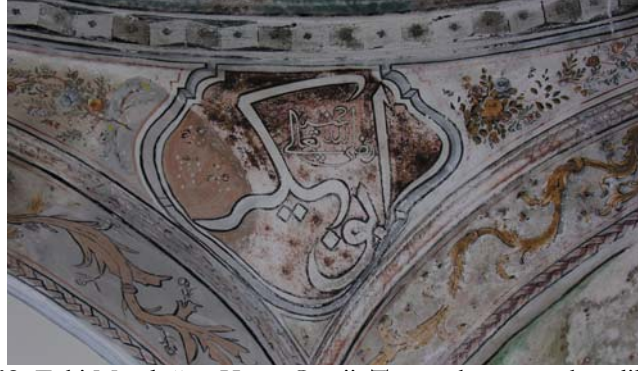
Resim 12. Eski Mordoğan Köyü Camii. Tromp kemer ve köşeliklerindeki süslemelerden ayrıntı.

12). Kemer yüzeylerinde ise akant yapraklarından oluşan “C” ve “S” şekilli kıvrık dallar, sarı ve kahverengi tonları ile dikkati çekmektedir. Dalların çevresine ve aralarına kırmızı, yeşil ve mavi renkli, ince yaprakları bulunan çiçek motifleri yerleştirilmiştir. Kemerlerin yüzeylerine yayılan “C” ve “S” kıvrımlı bu çiçekli dallar, kemerin tepe noktasında birer düğüm yaparak, yuvarlağa yakın oval madalyonlar meydana getirmektedir. Her birinin içi değişik bina tasvirleriyle süslenmiş bu madalyonlarından sadece güneyde, mihrabın üzerinde yer alanı diğerlerinden farklı bir motife sahiptir (Res. 13). Burada, ana madalyonun içine, önce iç içe dilimli iki küçük madalyon daha yerleştirilmiş, sonra da en içteki madalyonun ortasına, Arap harfleriyle “Besmele” istiflenmiştir. Birinci madalyonla ikinci madalyon arasında kalan boşlukta ise birbirlerine ince saplarla bağlanan palmet motifleri görülmektedir. Renk olarak siyah, beyaz ve sarı tercih edilmiştir. Camideki diğer yazılardan çok daha iyi yazılmış olan Besmele’nin hat kalitesi, buraya sonraki bir onarımda, şablonla yardımıyla yerleştirilmiş olabileceğini akla getirmektedir. Belki özgününde, burada da diğerleri gibi bir yapı tasviri yer alıyordu. Buna kesin karar vermek şimdilik güçtür.