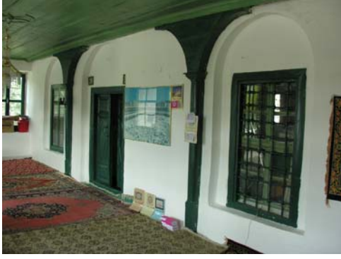
Resim 3. Eski Mordoğan Köyü Camii. Camii. Son cemaat yerinin onarımından önceki durumu (2005).