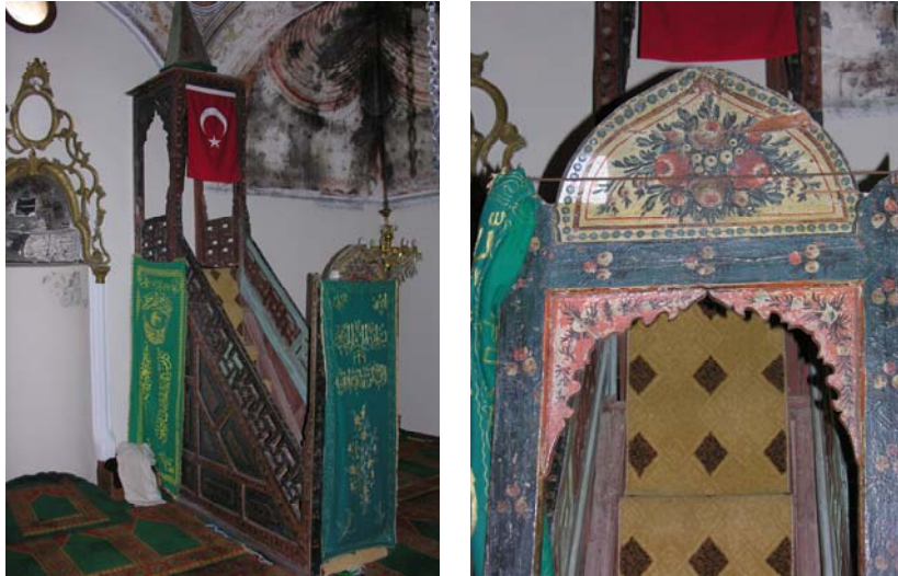
Resim 18. Eski Mordoğan Köyü Camii. Minber ve üzerindeki süslemelerden ayrıntı.

Mihraba göre sade olan minber ahşaptır (Res. 18). Kuruluş biçimi geleneksel şemayı korumuş, ancak yüzeyleri dönemin zevkine uygun süsleme unsurları ile bezenmiştir. Minber kapısında, aynalıklarda, köşkte ve köşk kısmının altında görülen kemerli geçitlerde batılılaşma döneminde sıkça rastlanan tek tek veya buket halindeki çiçeklerden ve yapraklardan oluşan kırmızı, yeşil, mavi ve sarı renkli bitkisel süslemeler görülmektedir. Ayrıca aynalık ve korkulukları çıtalarla meydana getirilmiş geometrik geçme örnekleriyle süslüdür.