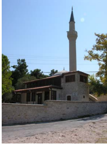
Resim 1. Eski Mordoğan Köyü Camii. Kuzeybatıdan genel görünüş.