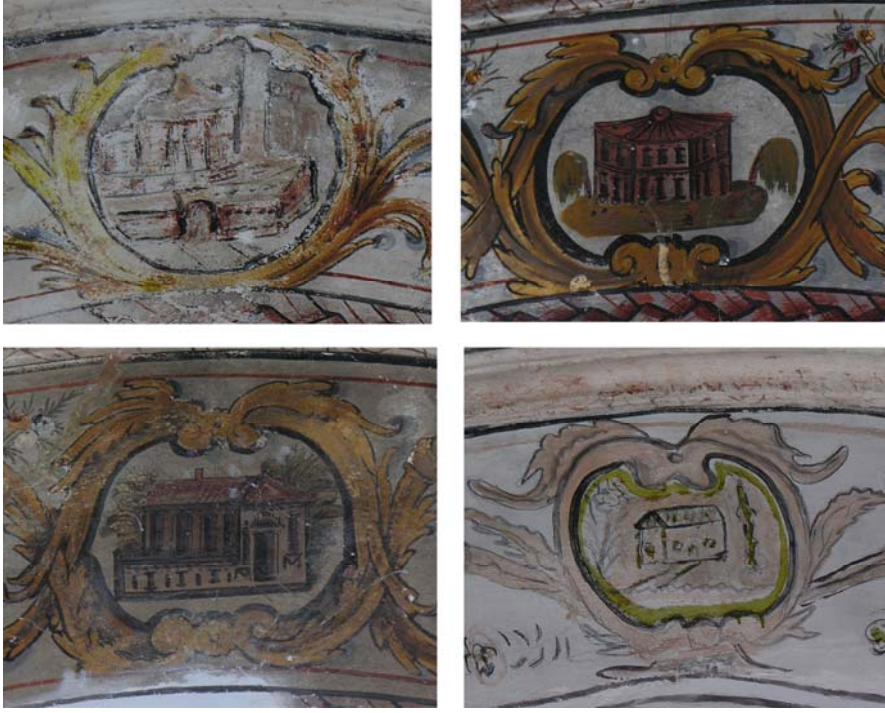
Resim 13. Eski Mordoğan Köyü Camii. Kemer yüzeylerindeki mimari tasvirler.

Mimari tasvirlerden batıda yer alan yüzeyel bir anlatıma sahiptir ve çocuksu çizgileriyle diğerlerinden ayrılır (Res. 13). Bu durum şu iki soruyu akla getirmektedir. Acaba bu tasvir ilk yapılışında böyle mi tasarlandı, yoksa sonradan mı bu şekli aldı? Tekniğinin sadeliği ve basit çizgilerle yapılmış olması, onarımlardan birinde bu şekli almış olabileceğini düşünmemize imkân vermektedir. Zira diğer mimari tasvirler, sağlam resim bilgisine sahip bir elin eseri olduklarını ve sanatçının anlatımlarında basit çizgileri kullanmadığını açıkça ortaya koymaktadır. Burada, daha önceleri yer alan ve hayli bozulmuş olan tasvirin tam algılanamaması böyle bir uygulamaya gidilmesine sebebiyet vermiş olmalı. Bu aynı zamanda, ülkemizdeki restorasyon hatalarının da güncel bir örneğidir. Ne yazık ki, yapıların mimari ve süsleme unsurlarına yönelik müdahalelerde hasar görmüş bölümlerin tamamen yenilenmesi ya da bu örnekte olduğu gibi tamamlanması yoluna gidilerek abartılı ve gereksiz restorasyonlar gerçekleştirilmekte, sonucunda da geri dönüşü mümkün olmayan durumlar ortaya çıkmaktadır.