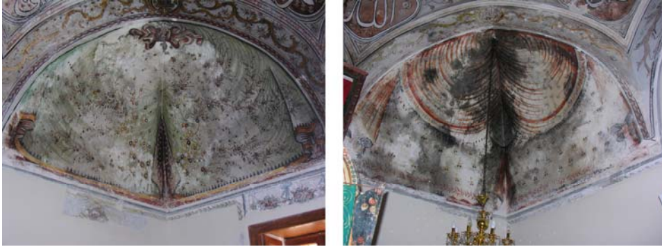
Resim 11. Eski Mordoğan Köyü Camii. Tromp süslemelerinden görünüş.

Kubbeye geçişi sağlayan trompların da yüzeyi tamamen boyalı nakışlarla süslenmiştir. Bu bölümün tüm yüzeyini kaplayan ve tepede iri bir fiyonkla bağlanmış olarak asılı duran perde motiflerinde yeşil, sarı, beyaz ve kahverengi renkler hâkimdir (Res. 11). Bunların bir kısmı iyi korunamamış ve yer yer bozulmuştur. Süslemelerin ilk anda birbirlerinin kopyası oldukları düşünülse de ayrıntılarda bazı farklılıkların bulunduğu görülmektedir. Örneğin güneydoğu köşedeki trompta yer alan perde motifinin tepe noktasına kırmızı bir kurdele yerleştirilmişken, güneybatı köşedekinin yüzeyine, ortadan iki yana ayrılmış, kırmızı renkli ikinci bir perde tasviri daha işlenmiştir. Kenarları kıvrımlar yapan, eteklerinde püsküllerin yer aldığı perdelerin tüm yüzeyi yeşil, mavi, beyaz, sarı ve kırmızı renkte çiçekler açmış ince bahar dalları ile süslenmiştir (Res. 11).