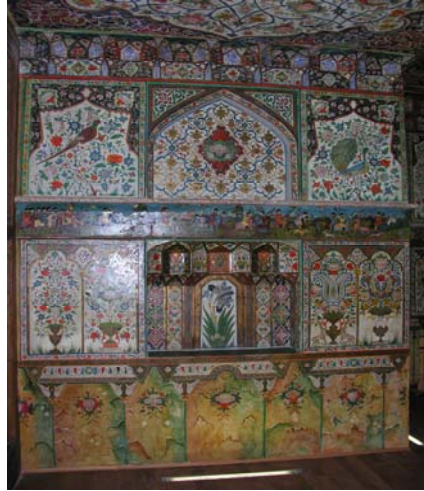
Resim 22. Şaki Han Sarayı. İkinci kat, merkez oda kuzey duvarındaki resimler