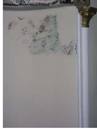
Resim 17. Eski Mordoğan Köyü, Camii. Mihrap nişi süslemelerinden geriye kalanlar ve kavsaradaki Kâbe tasviri.

Tepe noktasında, aşağı doğru sarkan, kırmızı güller ve çok yapraklı yeşil çiçeklerden oluşturulmuş iki çiçek buketi yer alan, çeyrek küre şekilli kavsaranın alt bölümünde bir perde, üst bölümünde ise Kâbe tasviri bulunmaktadır (Res. 17). Üç kıvrımlı perde motifinin bir kısmı iyi korunamamış ve bize göre sağ yarısı tahrip olmuştur. Sağlam durumdaki kısımlarından, perde kıvrımlarının beyaz ve siyahın farklı tonları ile verilen ışık-gölge kontrastıyla oluşturulduğu, yüzeylerinin ise kırmızı ve mavi renkli küçük çiçek motiflerinden oluşan bitki demetleri ile süslediği anlaşılmaktadır.